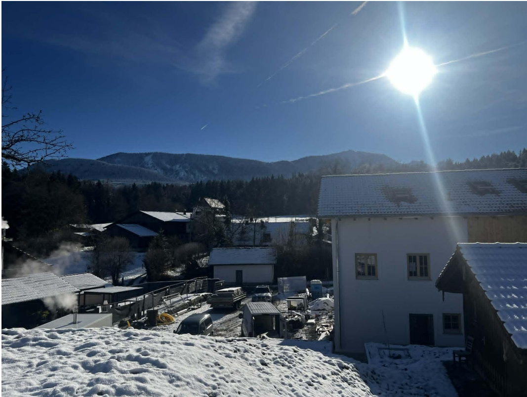
Bergblick vom Grundstück