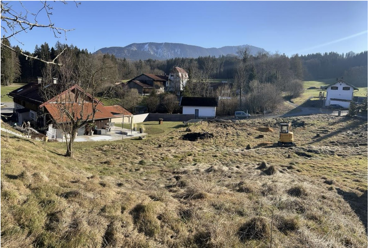
Blick auf den Hochries