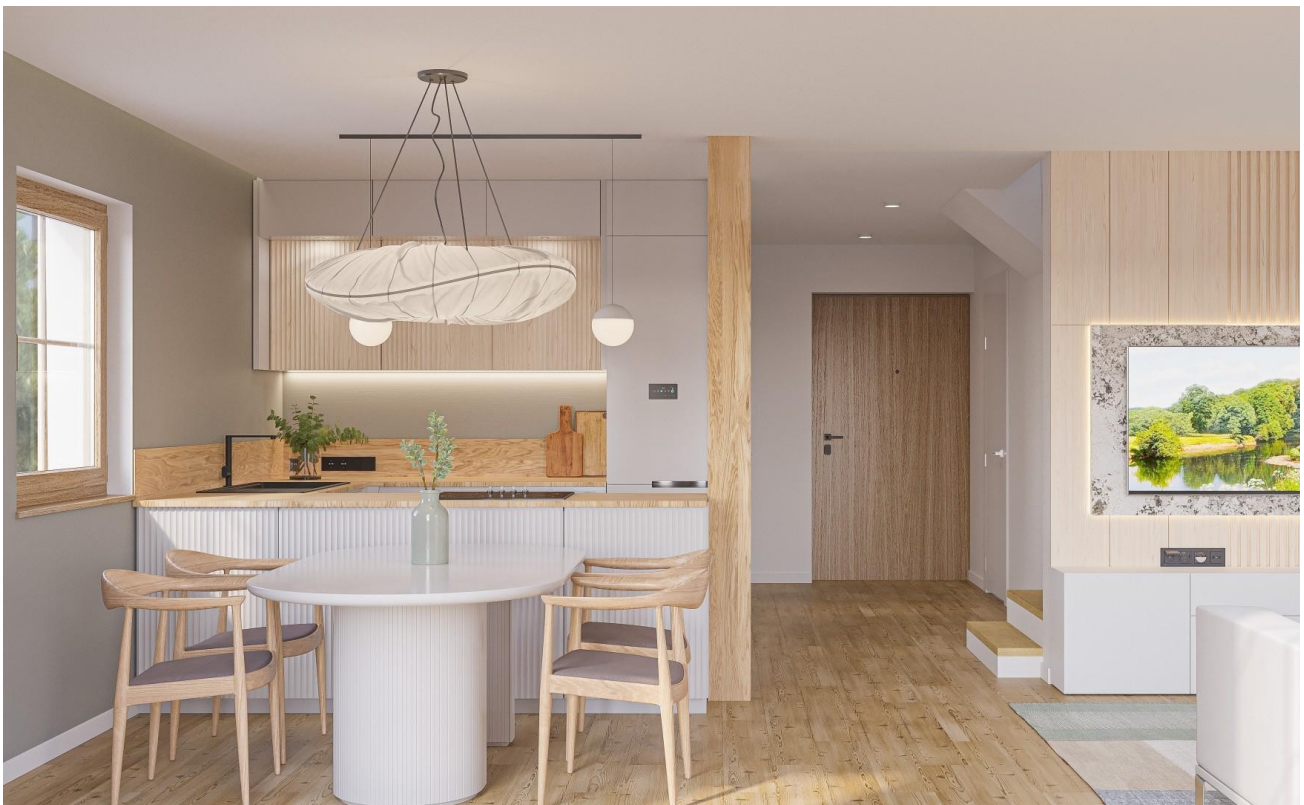
Küchen und Essbereich