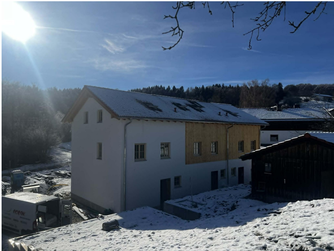
Nord Ansicht Reihenhaus