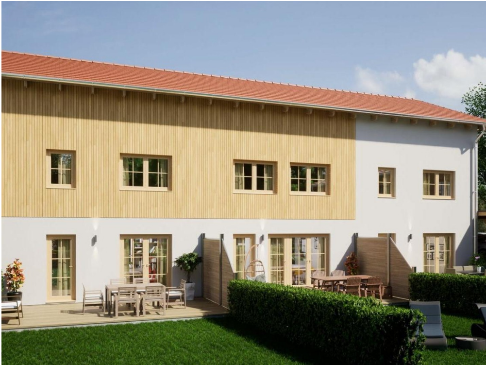
Süd Ansicht u. Terrasse