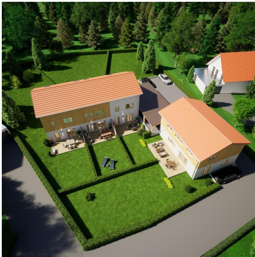
Luftansicht von Süden