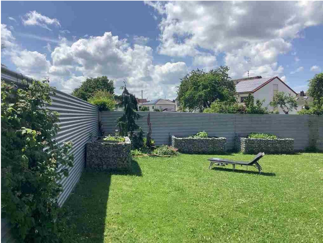
Rasenfläche hinterm Haus