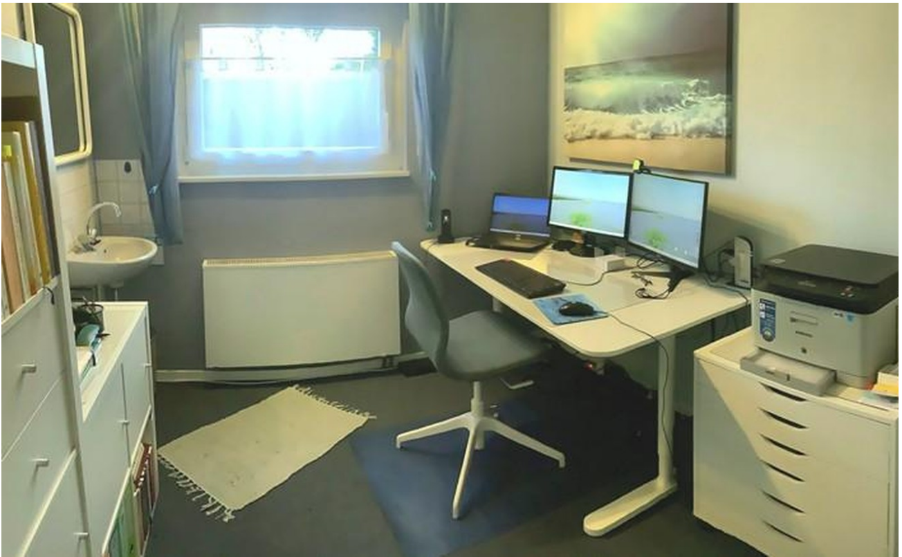
Büro im Untergeschoss