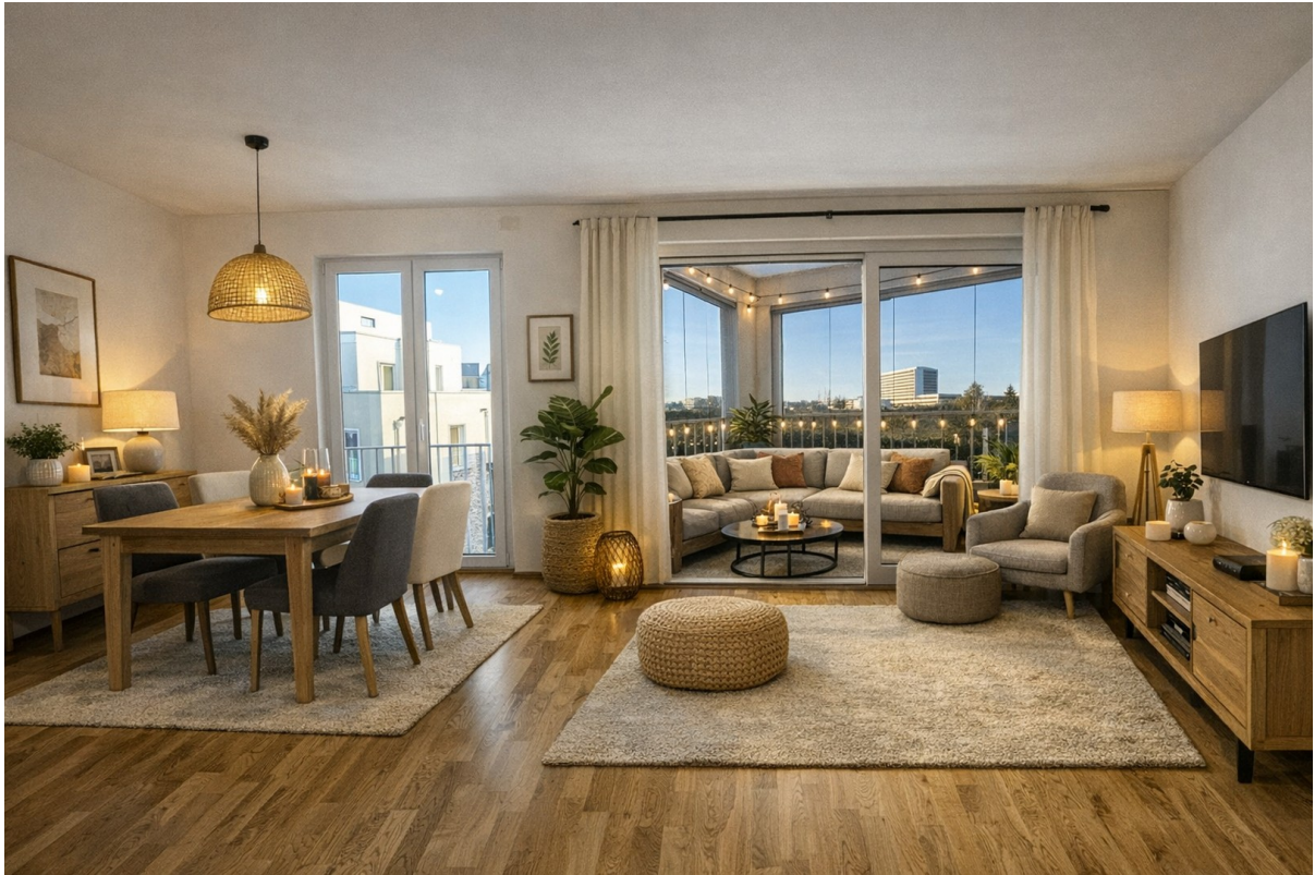
Wohnbereich (Visualisierung mit