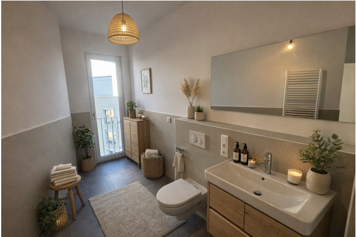
Bad (Visualisierung mit KI)