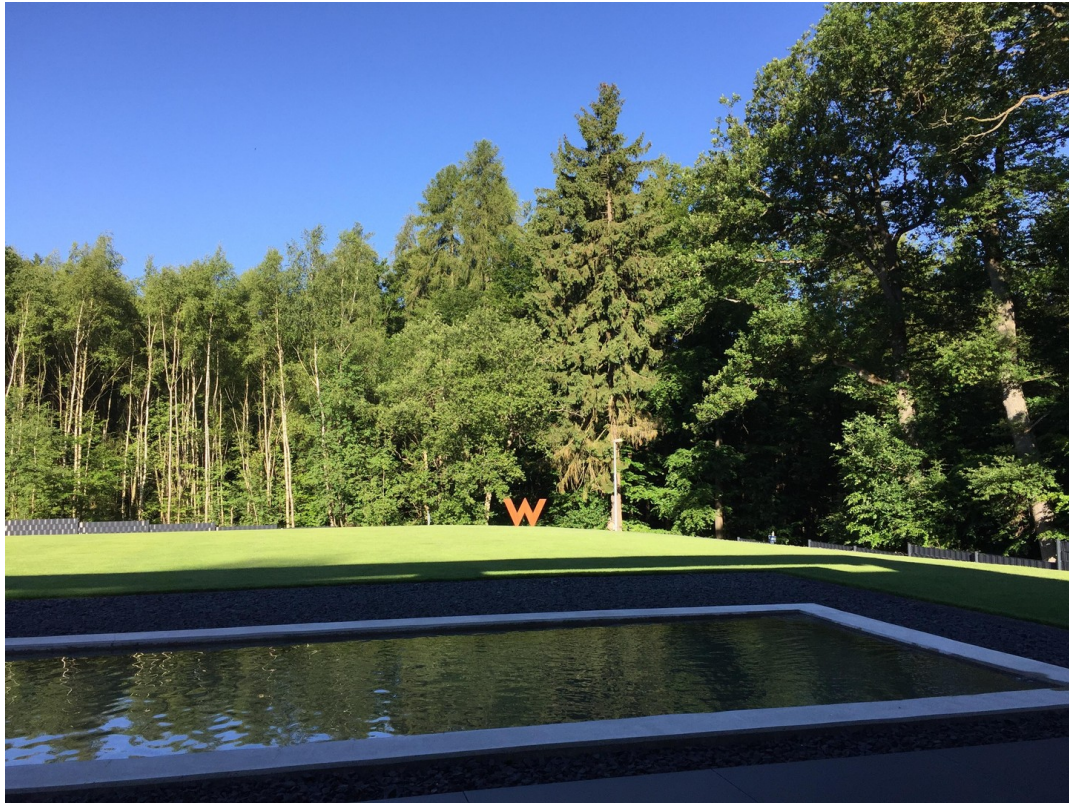
Blick in den Garten 2