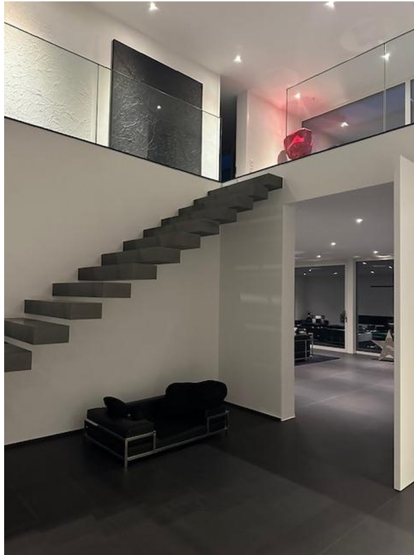
Kragarmtreppe aus Beton