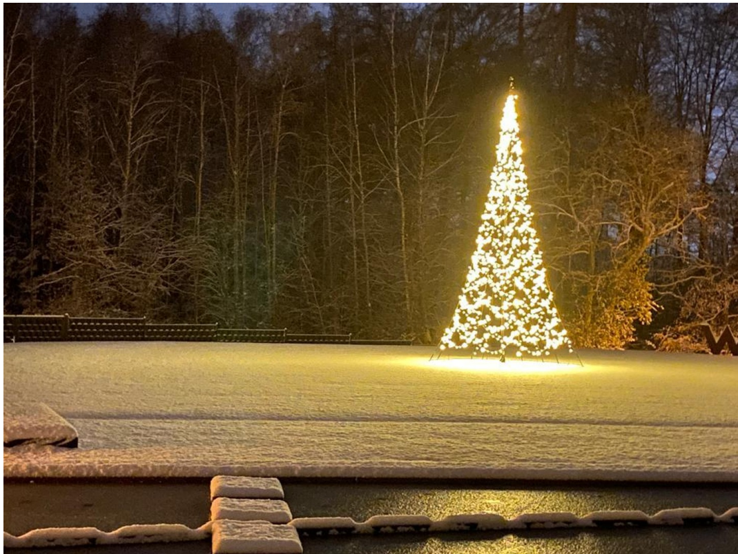
Impressionen von Weihnachten