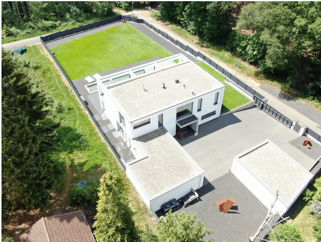
Hausansicht mit Garagen