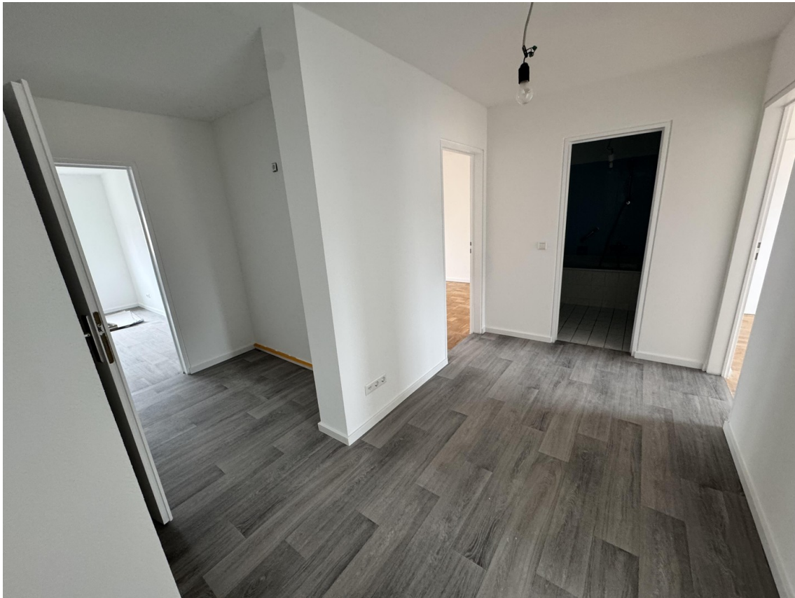
Eingangsbereich / Flur