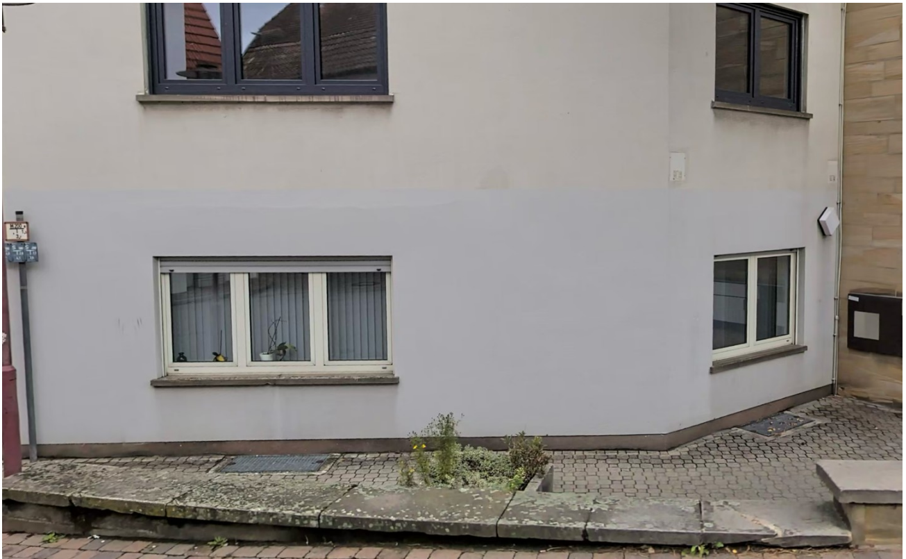
Außenbereich Stühle, Fahrrad