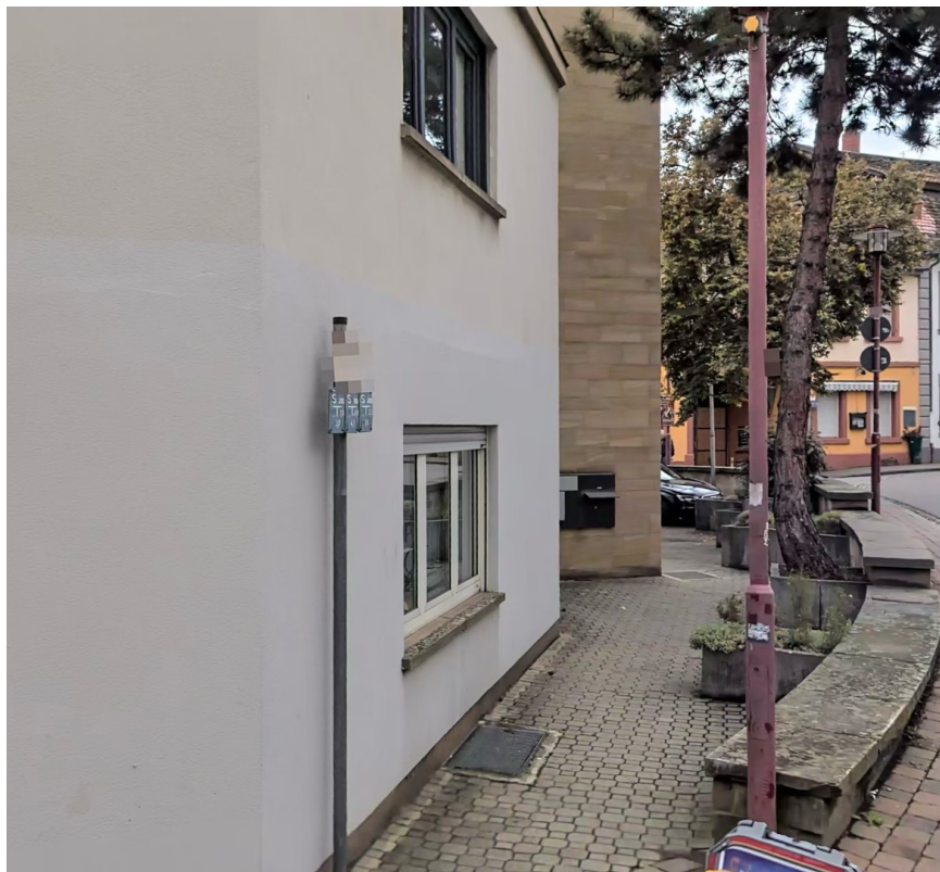
Außenbereich Stühle, Fahrrad