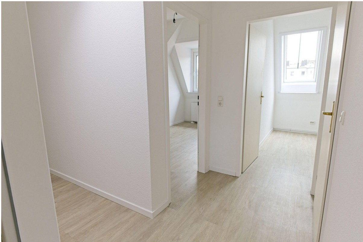
Blick vom kl. Zimmer i.d. Flur