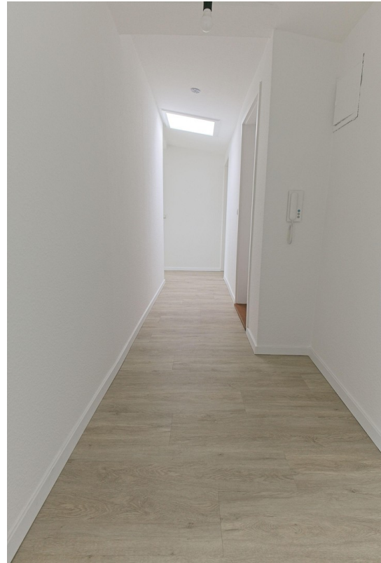
Blick vom Wohnzimmer i.d. Flur