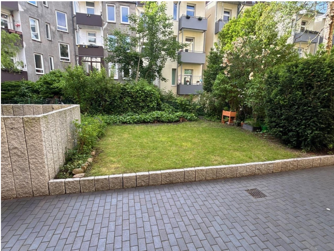
neu gestalteter Hof mit Garten