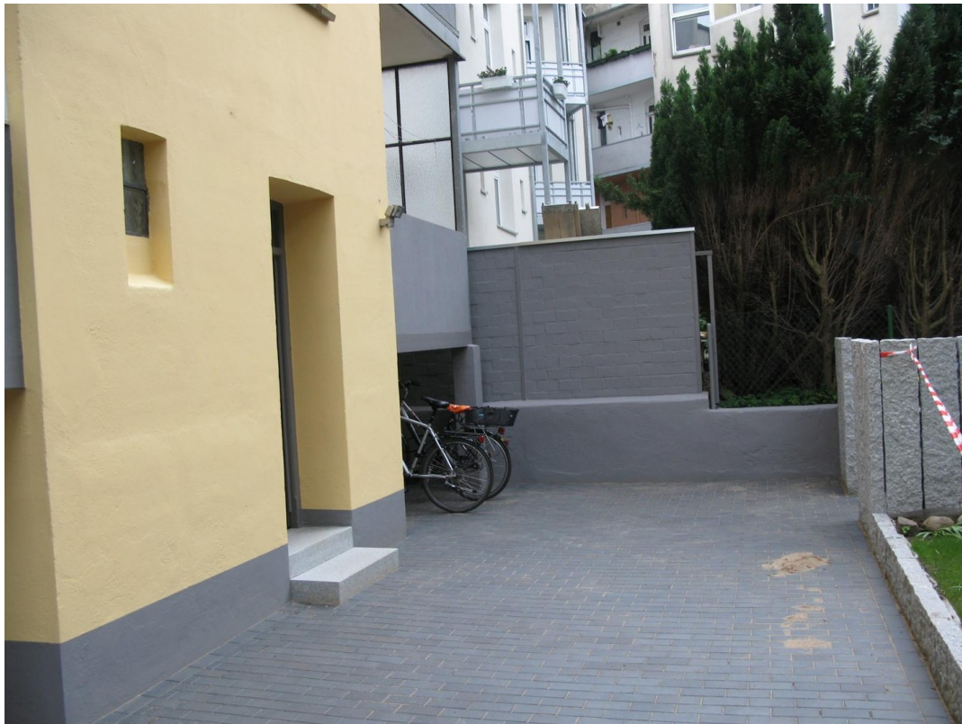
neu gestalteter Hof