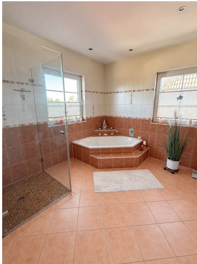
Hauptbad mit 2 Fenstern