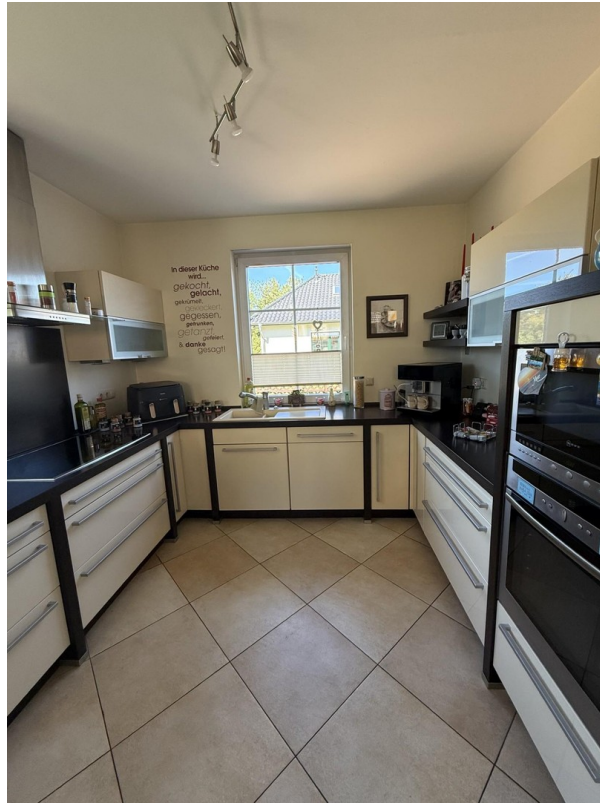
Blick in den Kochbereich