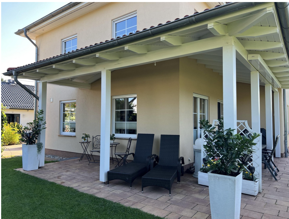
Terrasse mit Überdachung