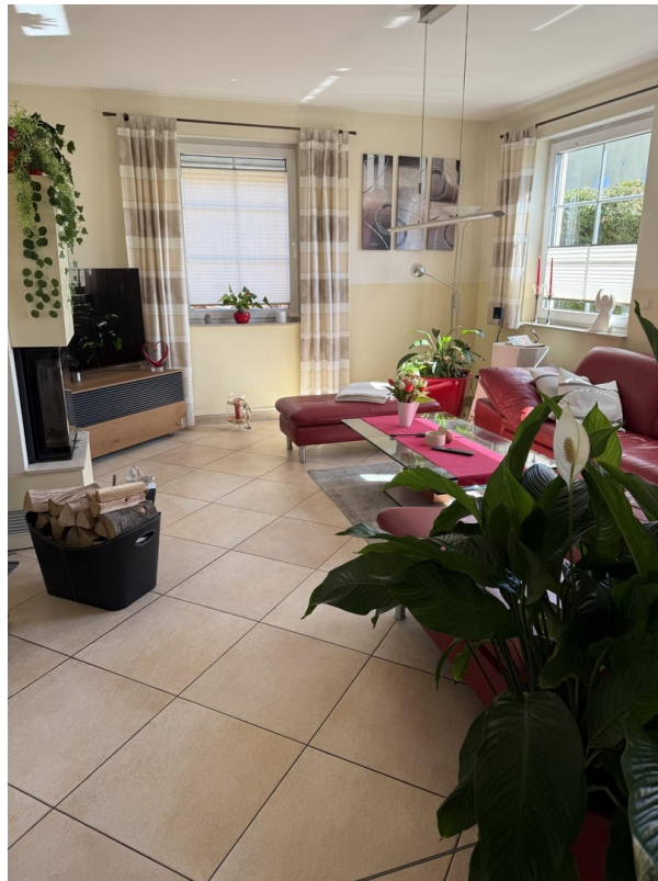
Wohnen zum Wohlfühlen mit Kami