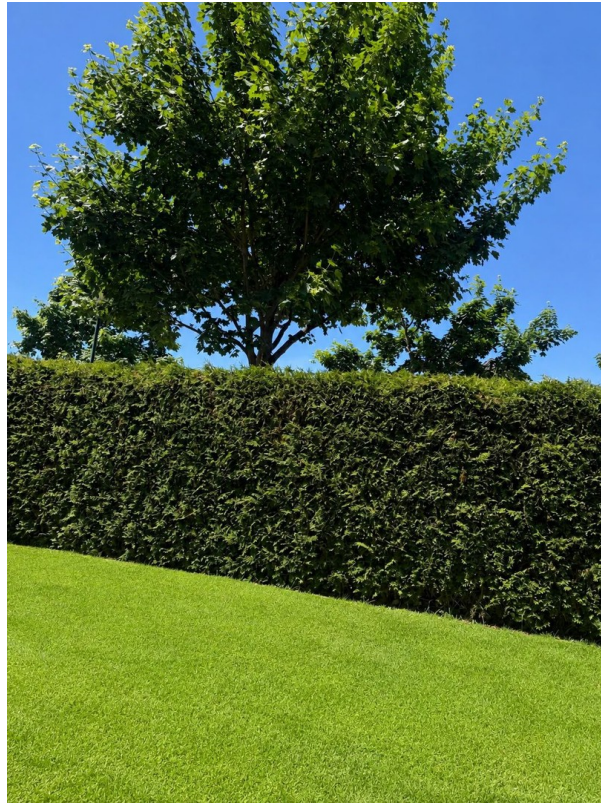
Hecke von innen