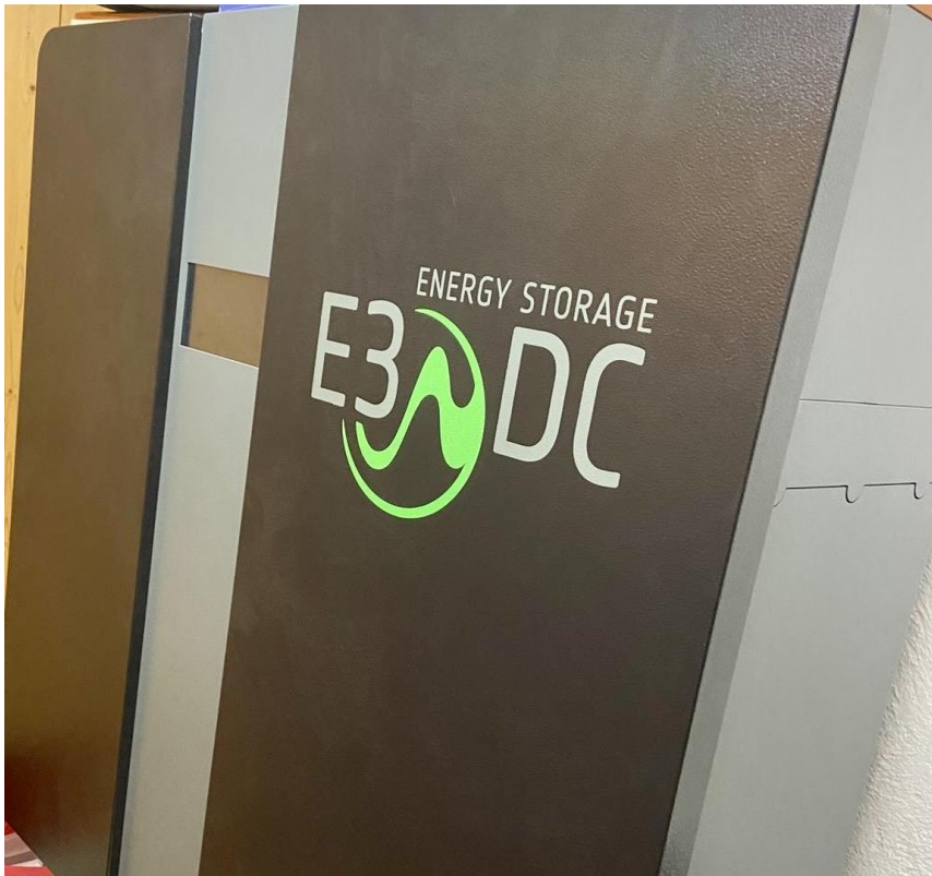
PV 10 kWh Speicher