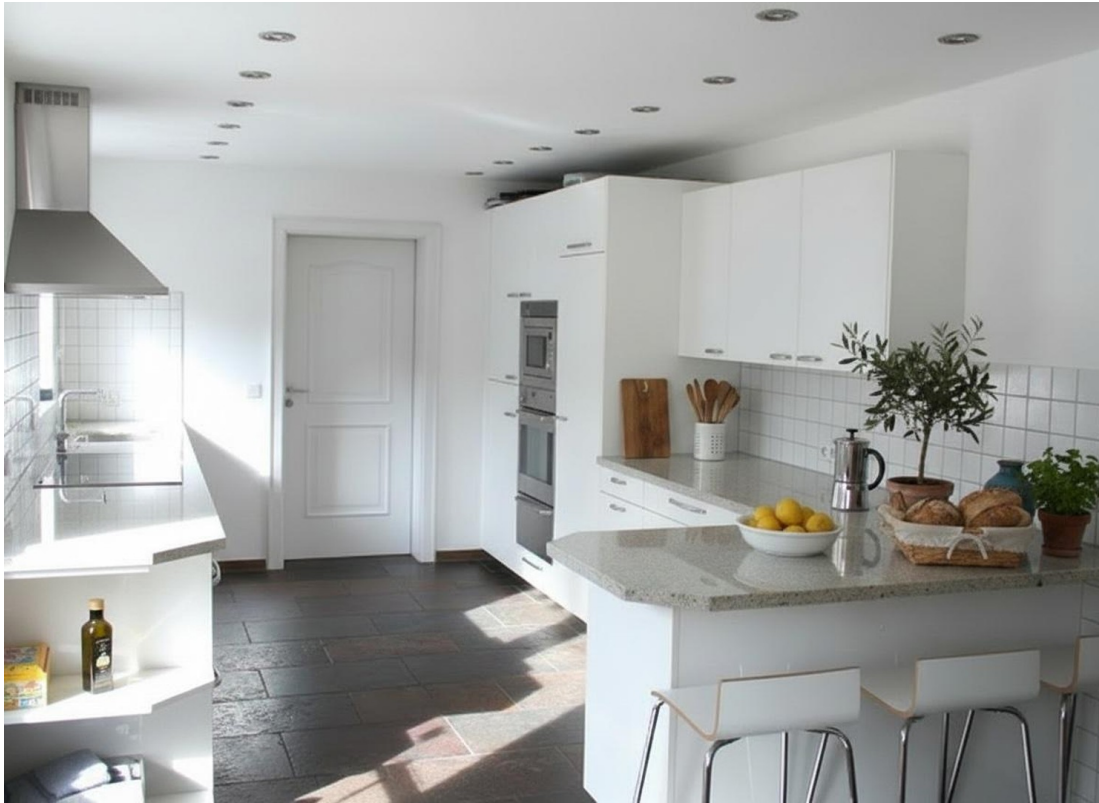
Küche mit Garagenzugang