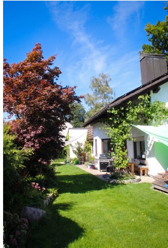
Hausansicht von hinten