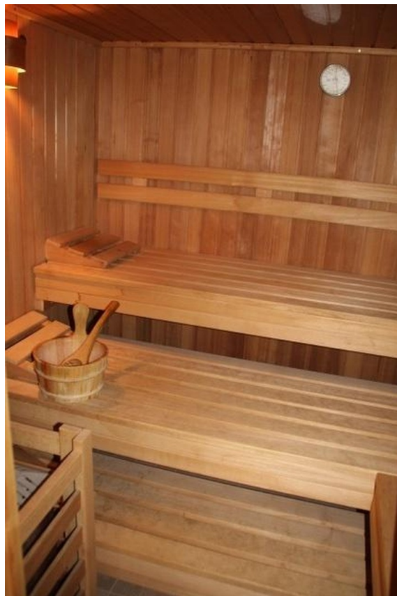
Sauna im Souterrain