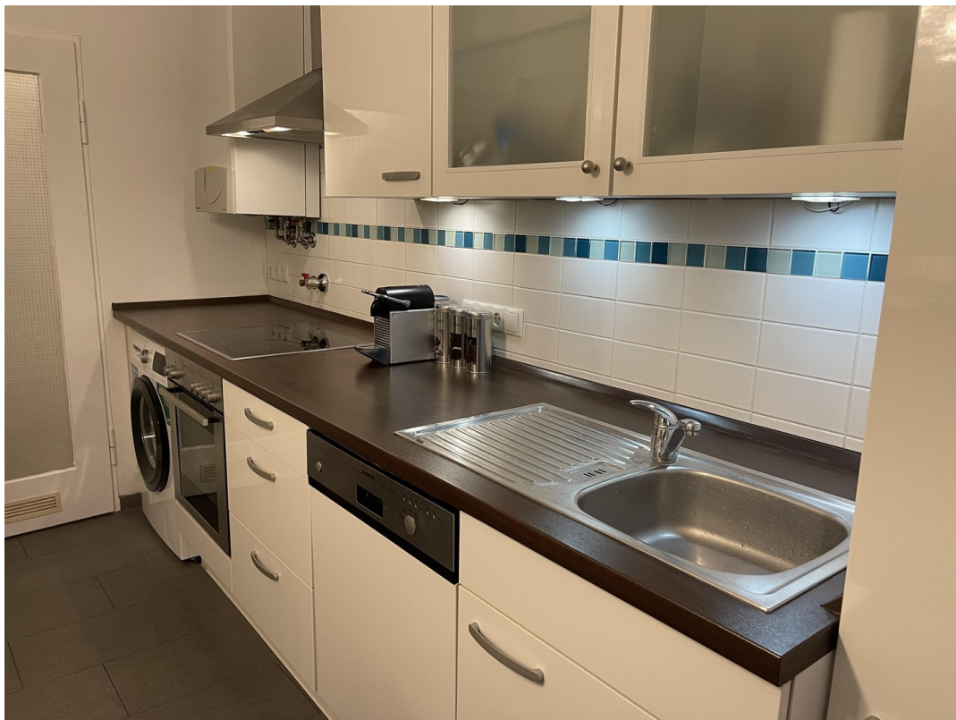
Küche mit Geschirrspüler