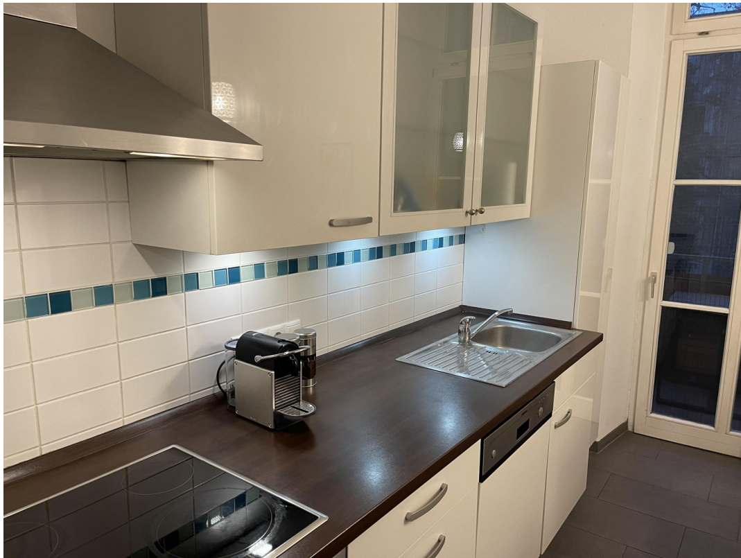
Küche mit Balkon