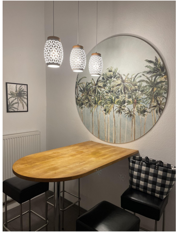
Küche / Essen