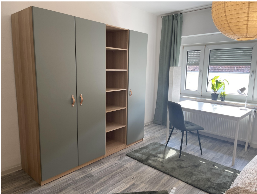
Schrank mit Schreibtisch