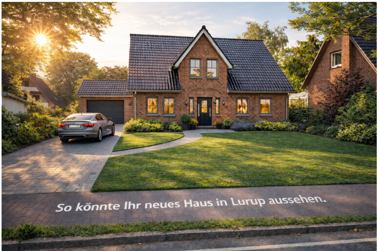
Beispiel Haus in Lurup vorn