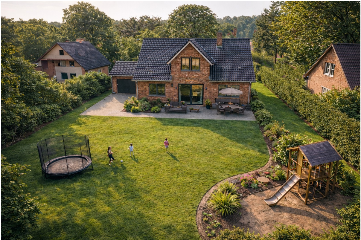
Beispiel Haus Garten