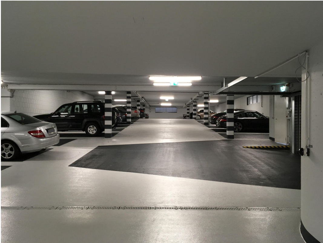
Tiefgarage mit 37 Stellplätzen