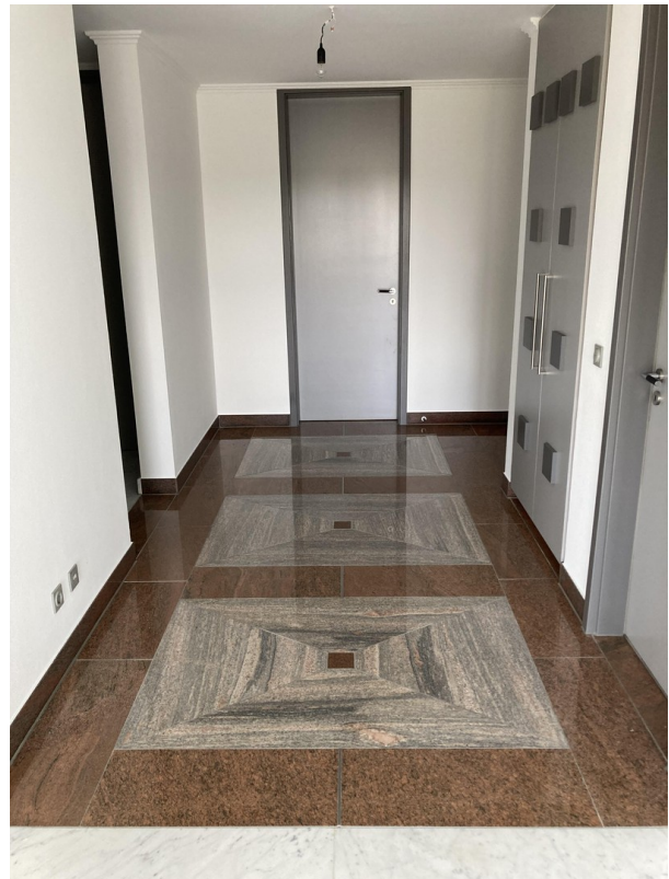
Eingangsdiele mit Granitboden