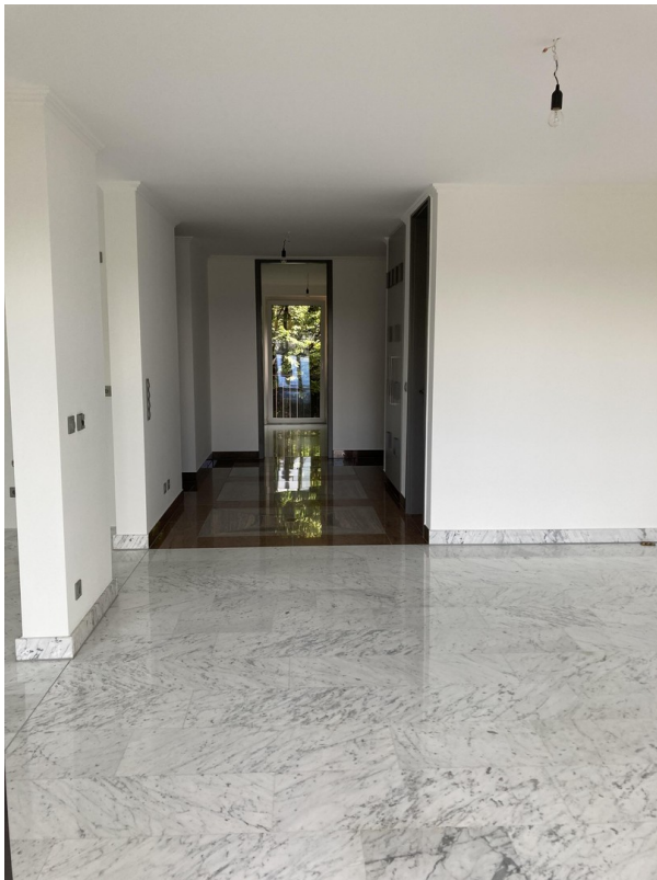
Blick auf Diele & Gästezimmer