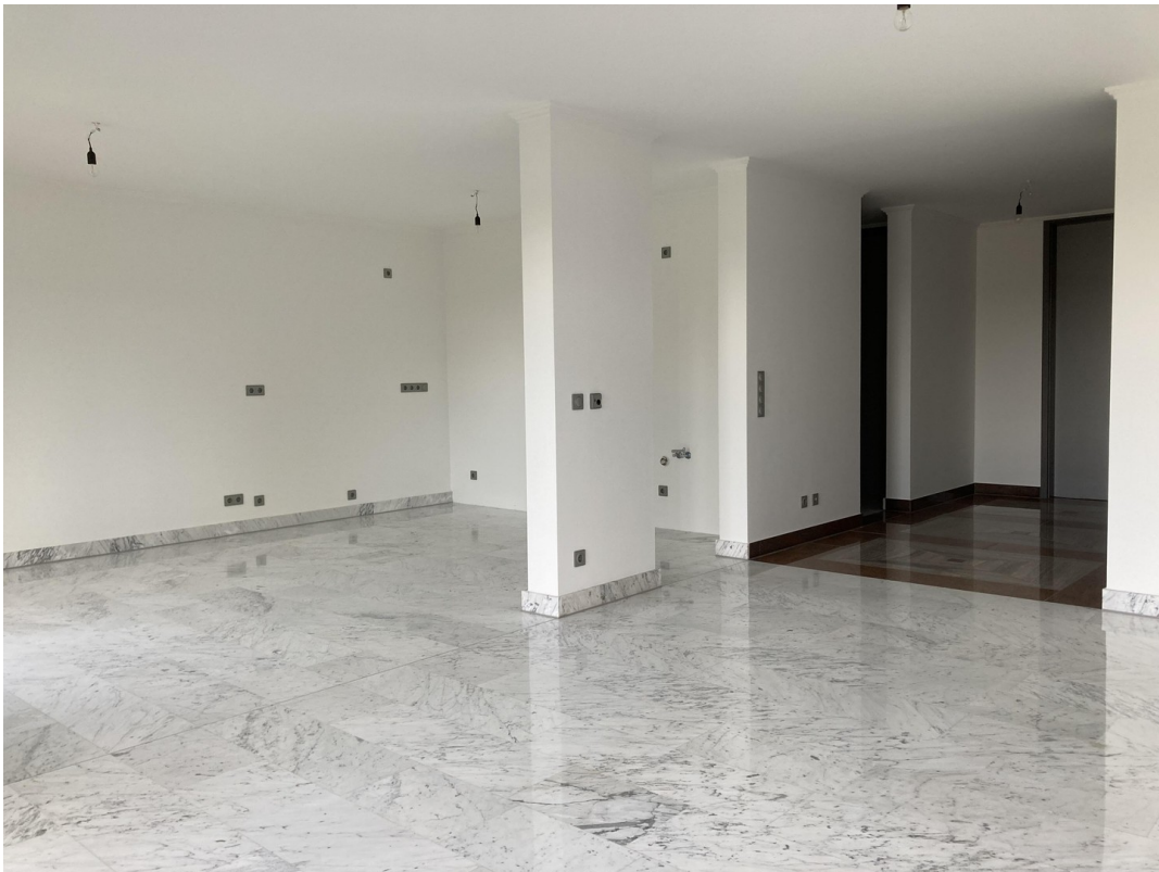
Blick auf Küche und Diele