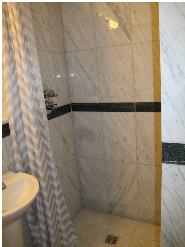
Dusche im Gästebad