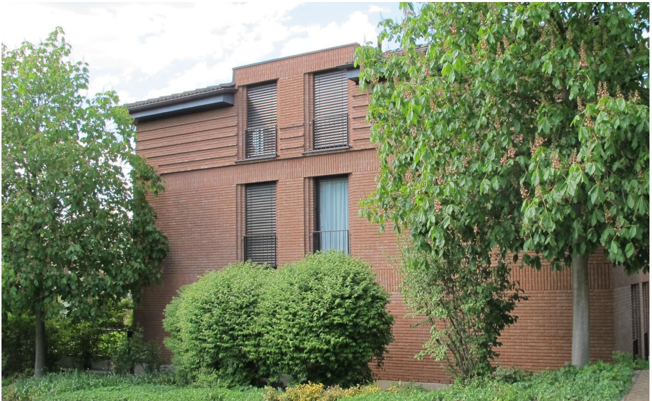
Außenansicht Haus 1