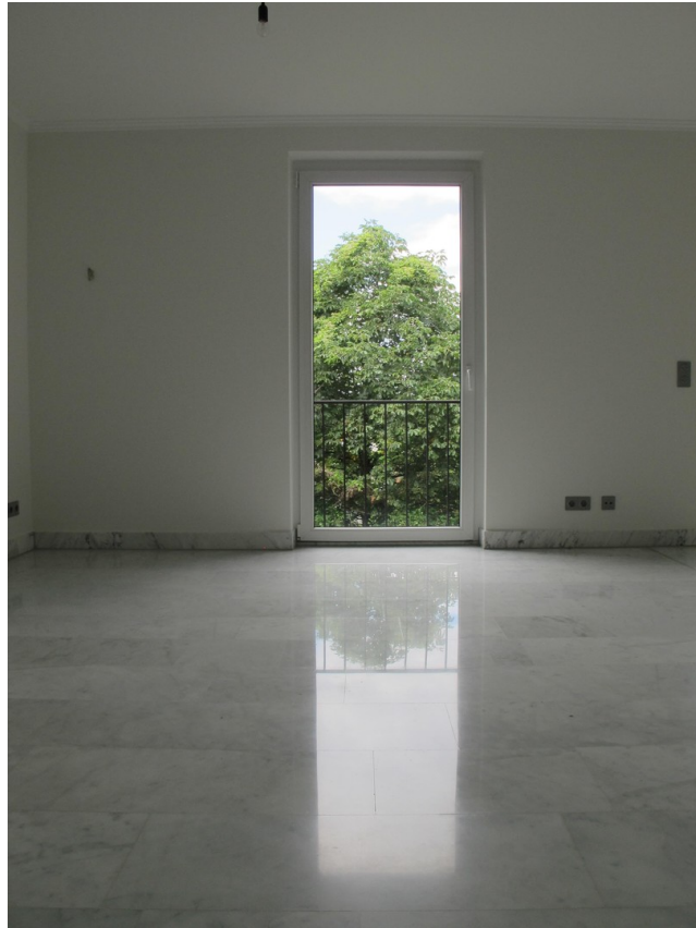
Blick aus der Küche