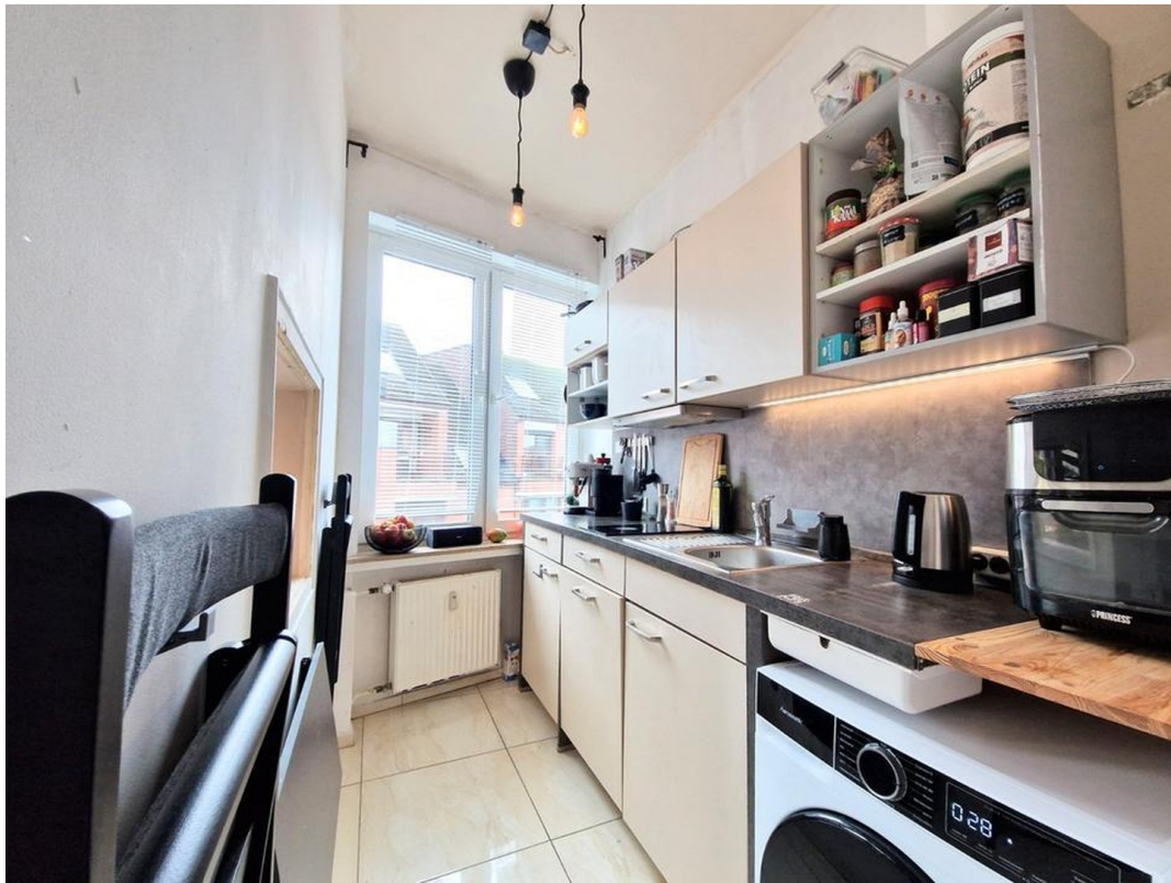
Küche mit Durchreiche