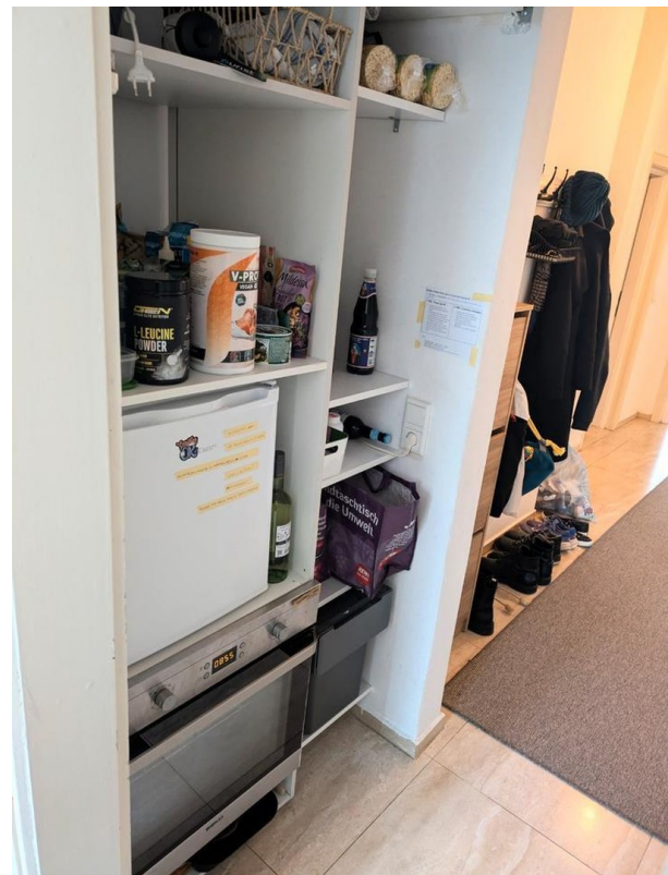
Vorraum zur Küche