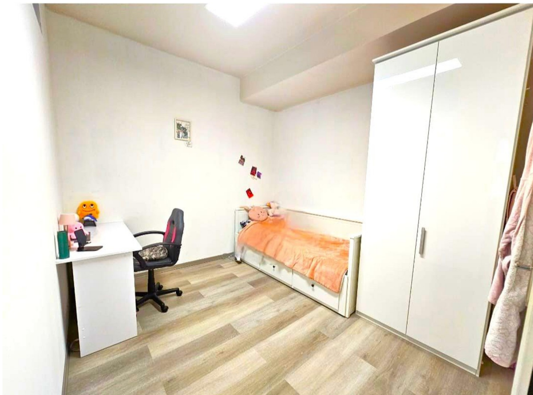
Schlafzimmer 3 (Durchgangsz.)