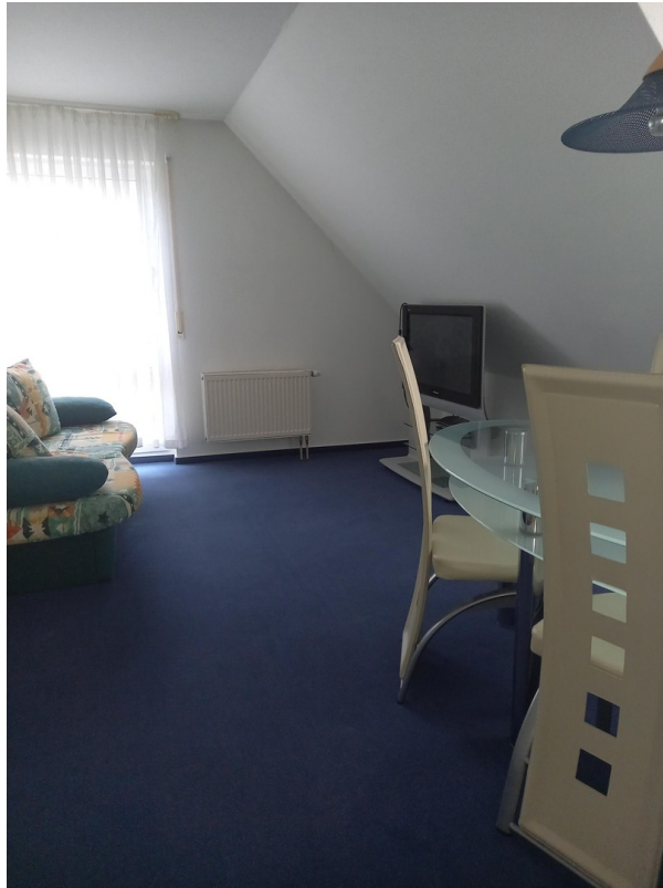
Zimmer 1 (Essen und Küche)