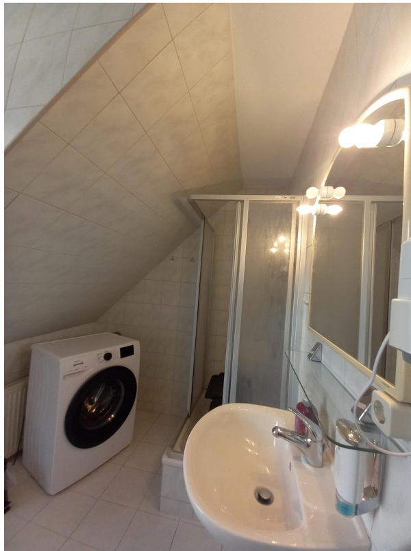
Badezimmer mit WaMa