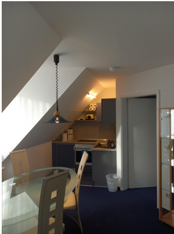
Zimmer 1 (Essen und Küche)