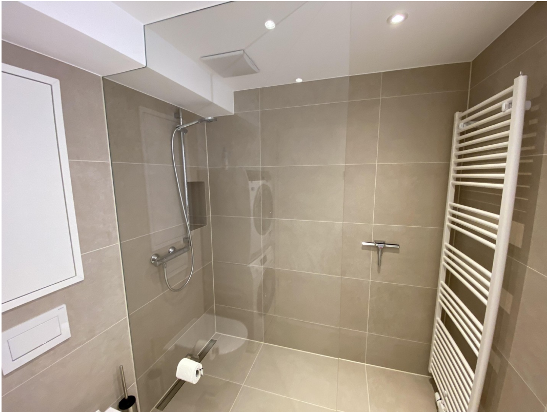
Bad mit Wandschränken