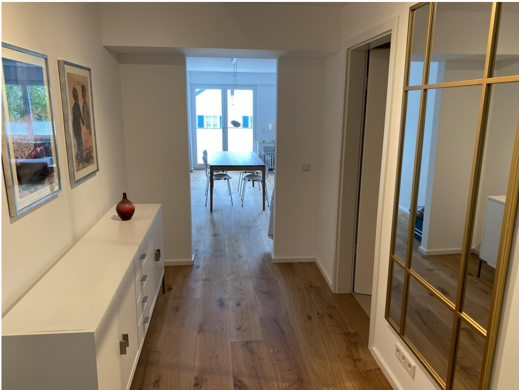
Flur, Blick Richtung Wohnzimmer