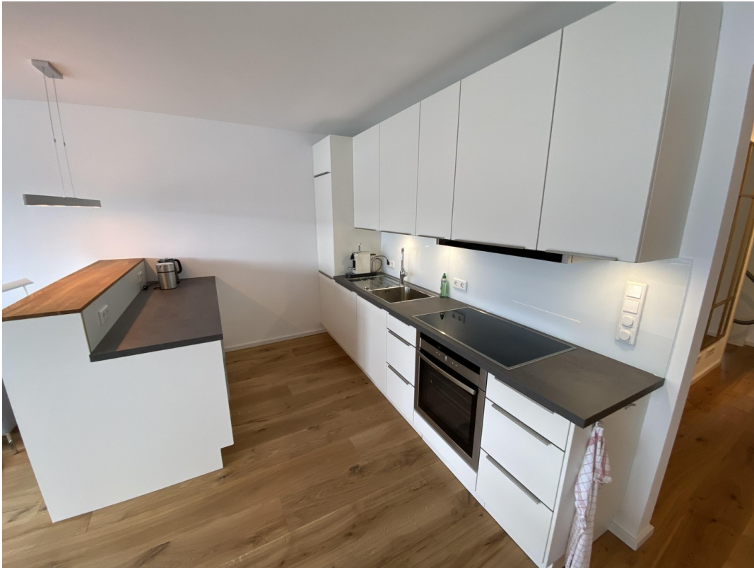
Hochwertige Küche mit Theke