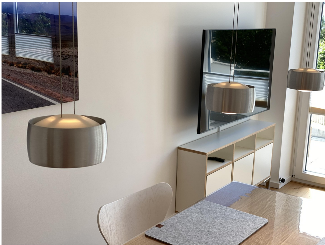
Wohnzimmer mit schwenkbarem TV