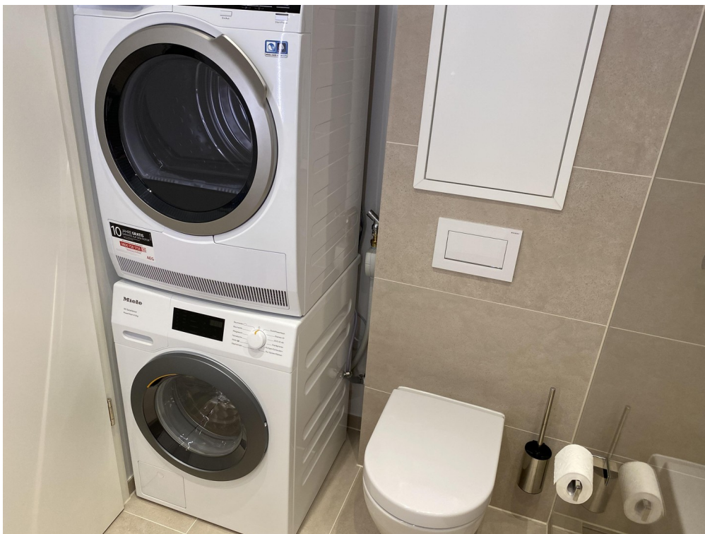
Bad mit Waschmaschine/Trockner