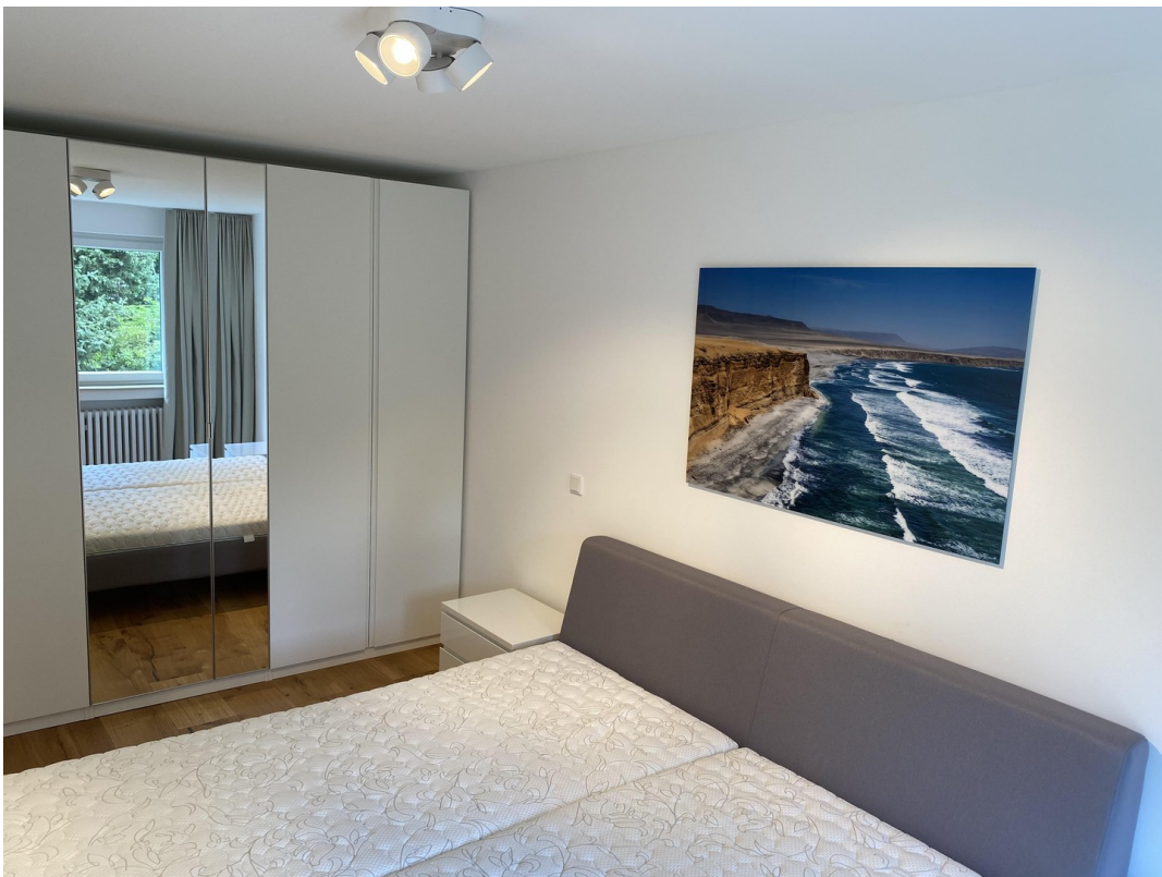
Schlafzimmer mit Bett 2x2m