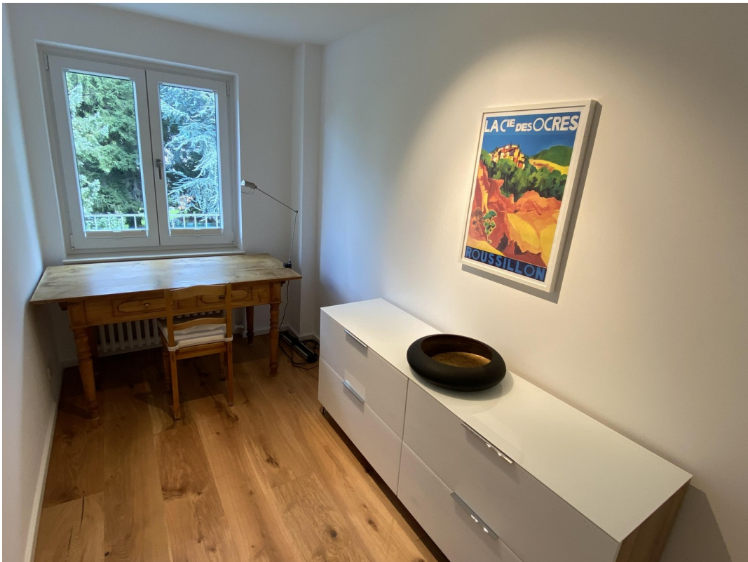
Arbeitszimmer Richtg Garten