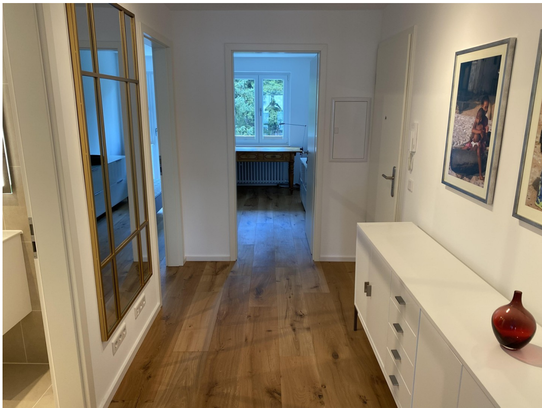
Flur, Blick Richtung ArbZi