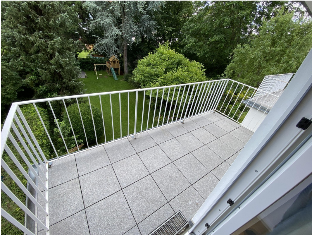
Balkon Schlafzi, Richtg NO