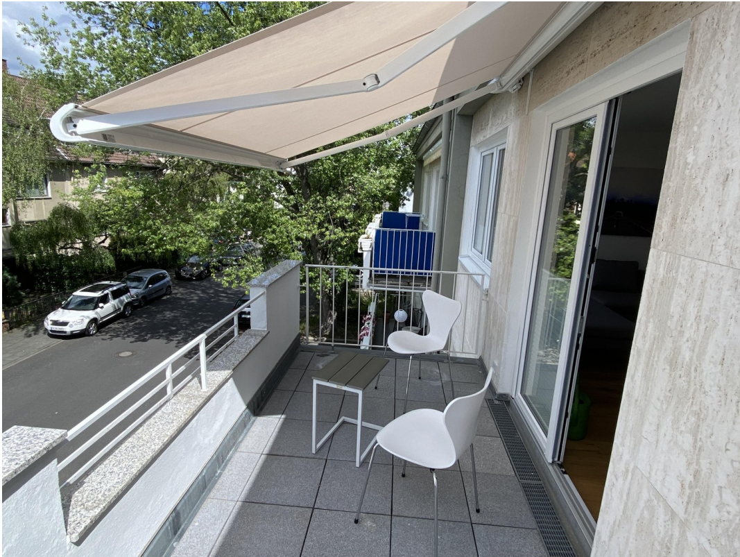
Balkon Richtung Süd-West