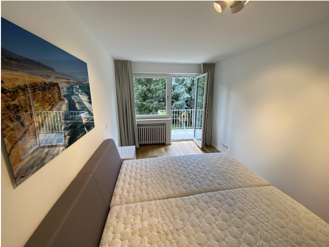
Schlafzimmer Richtung Garten