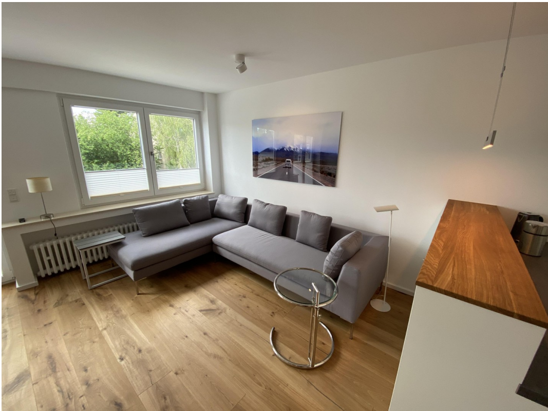
Wohnzimmer Richtung Süd-West