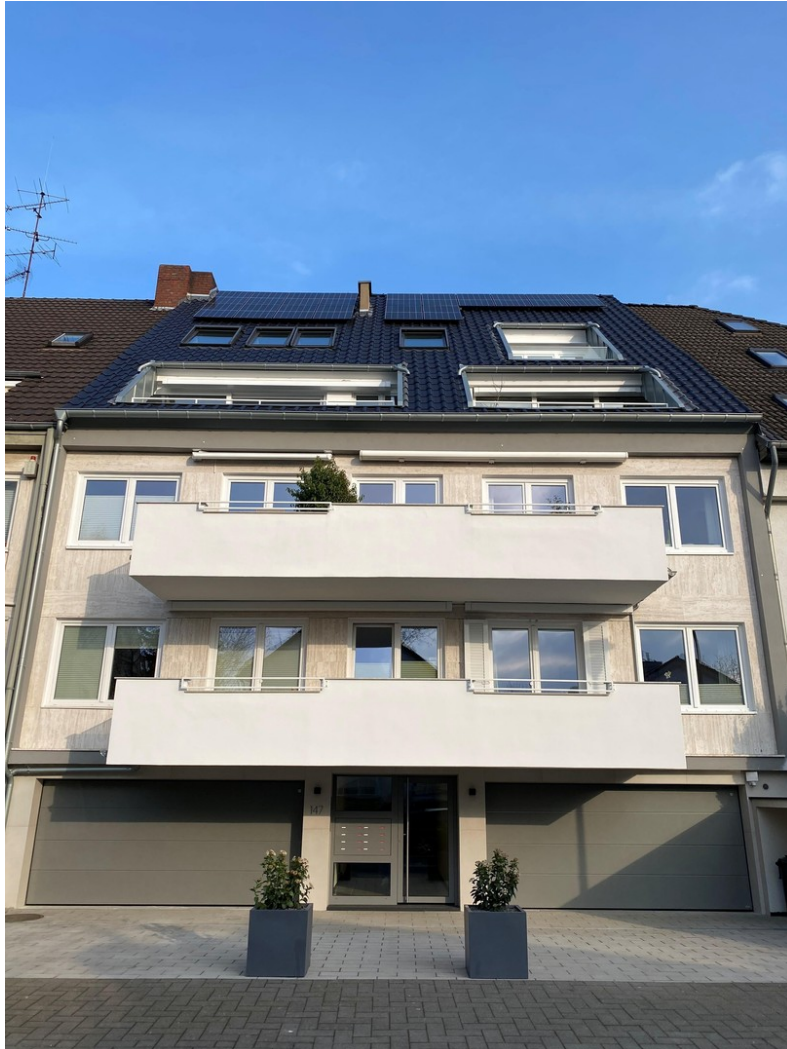
2. Etage links ist die Wohnung