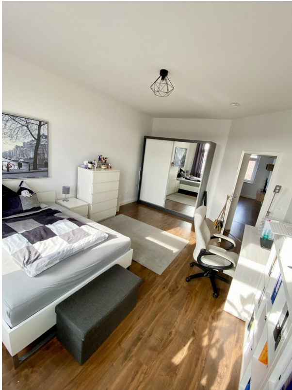
Hier fehlt nichts!