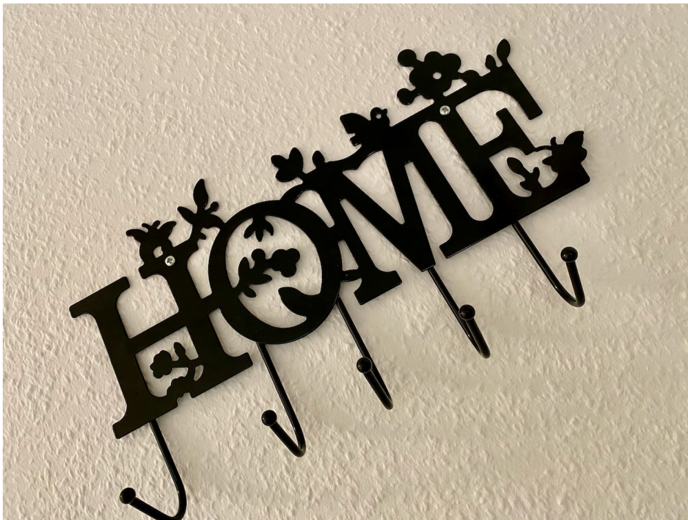
Hier bist du zu Hause!