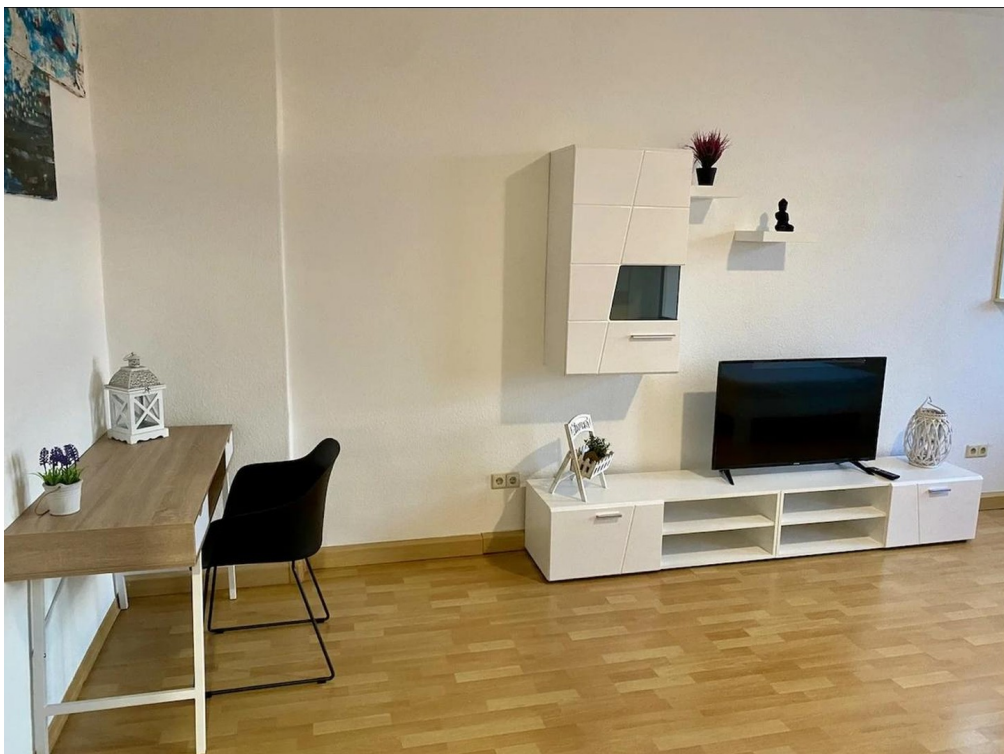
Relaxen und Arbeiten