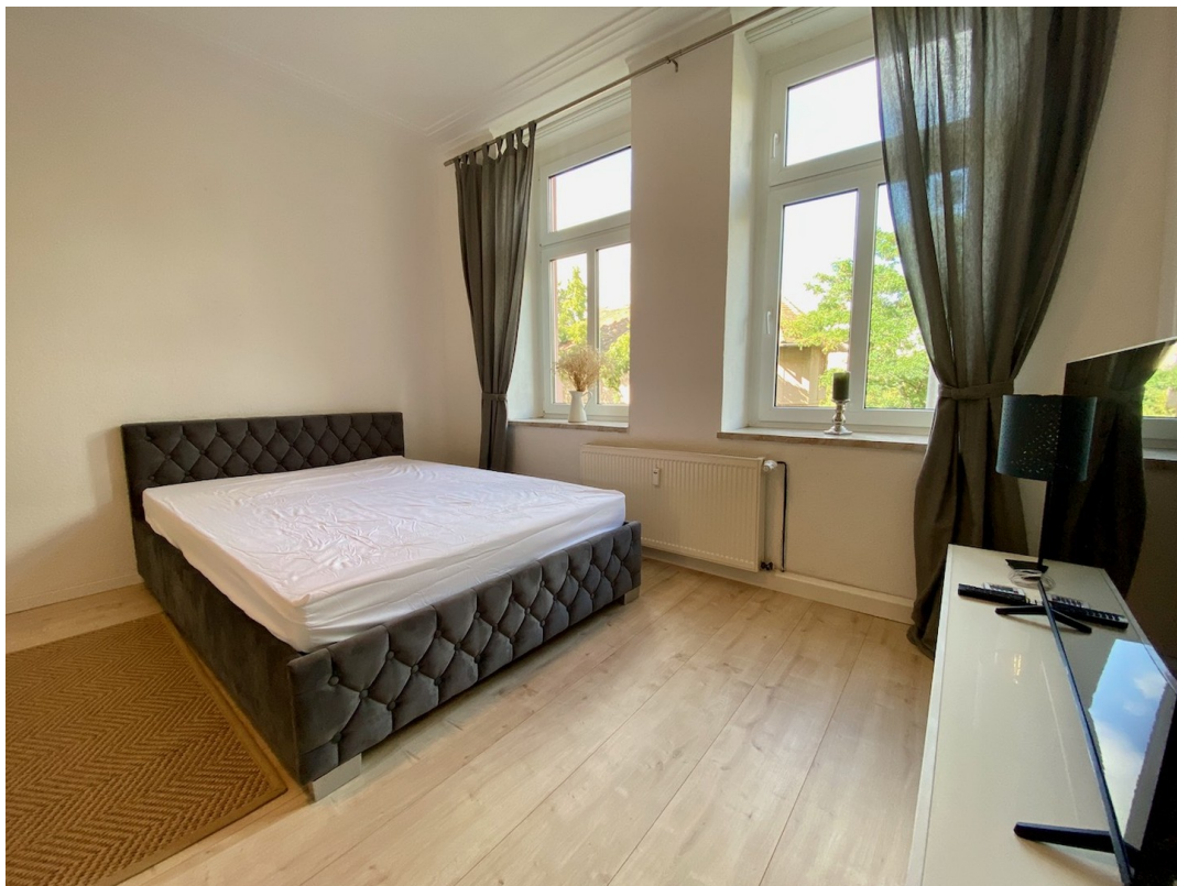
Nagelneuer LED 43 ZollTV