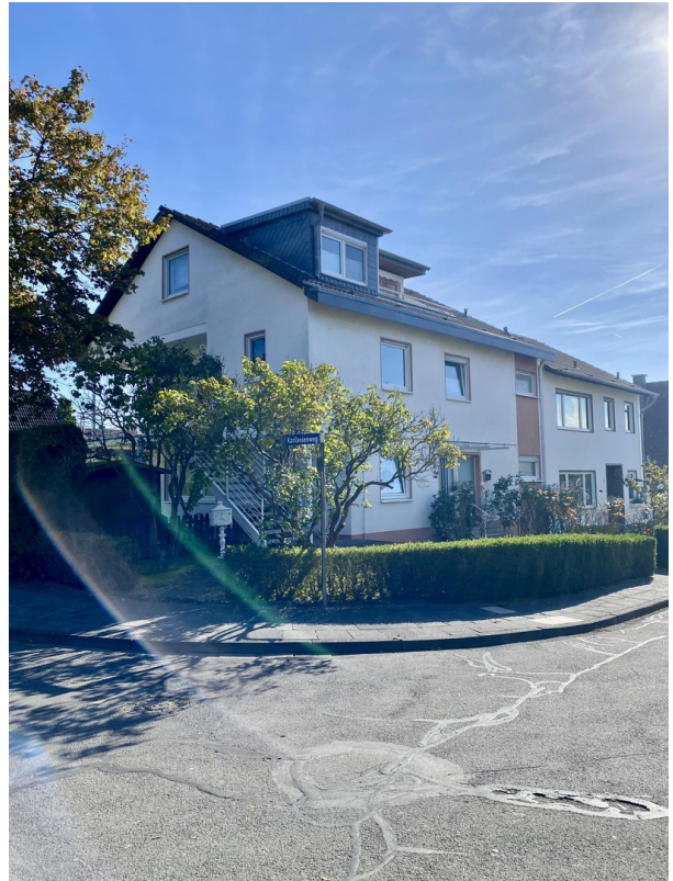
Gemütliches und ruhiges 2 Fam.