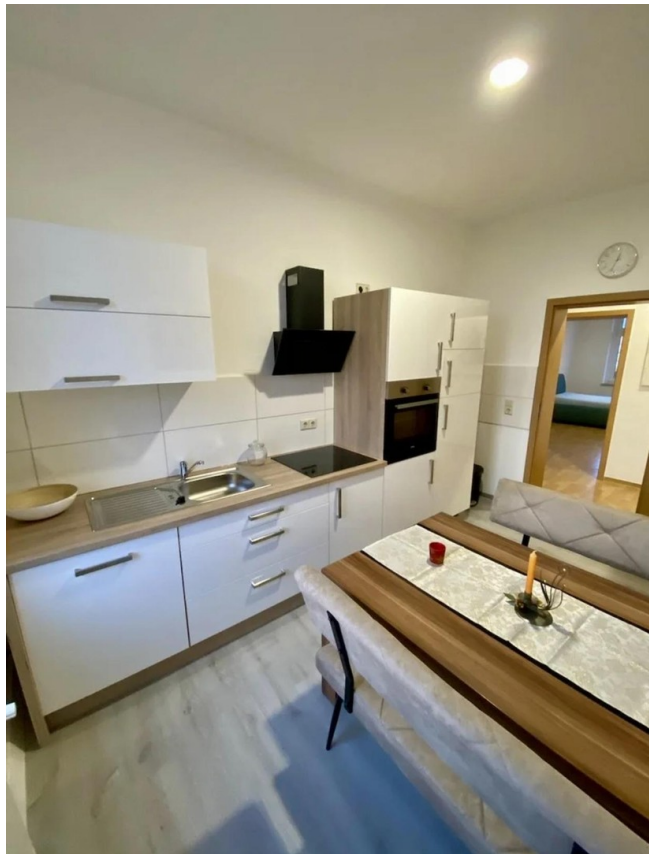
Voll ausgestattete Küche