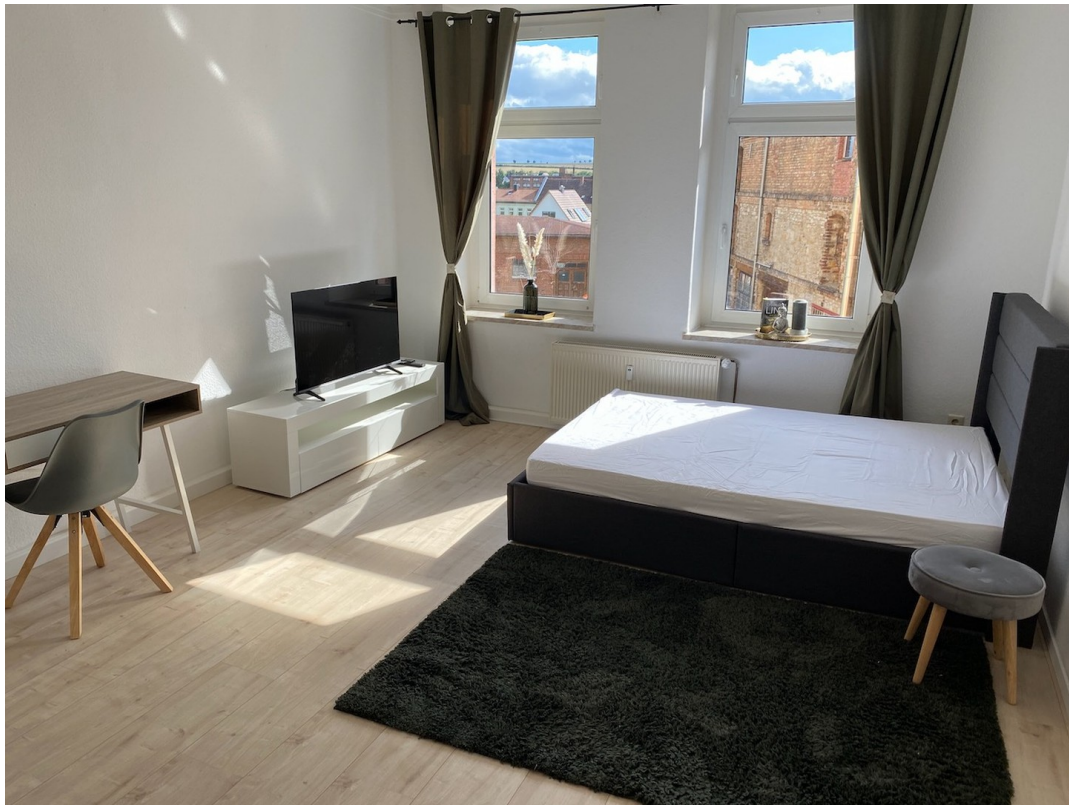
Dein neues Zimmer