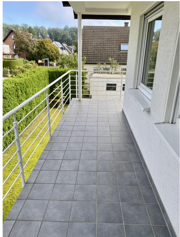
--- und hier № 2!