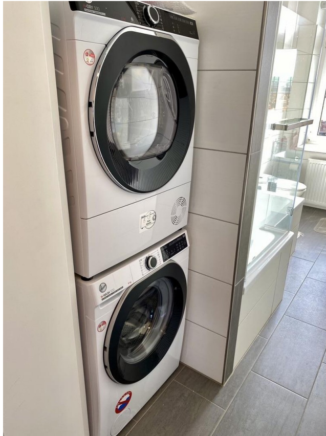
Waschen und Trocknen inklusive