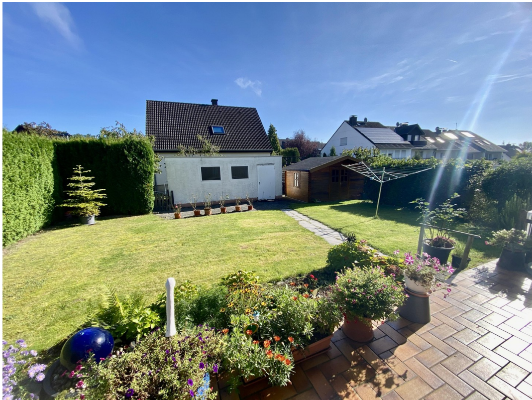
Der Graten zum Relaxen