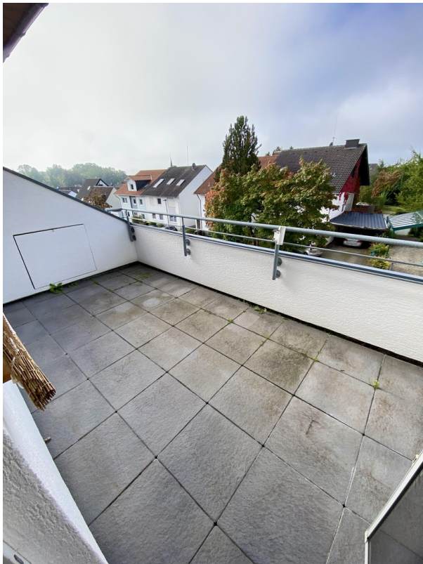
Eine von 2 Terrassen