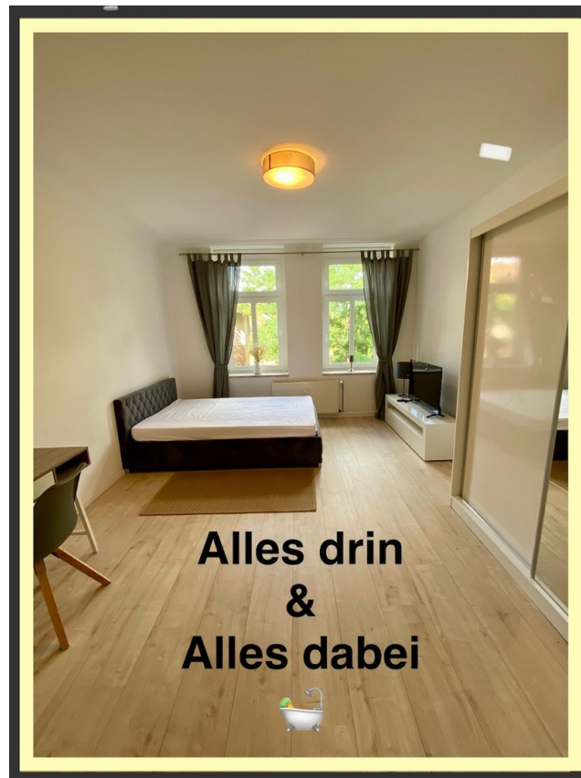
Praktisch: Bett, TV & Arbeit