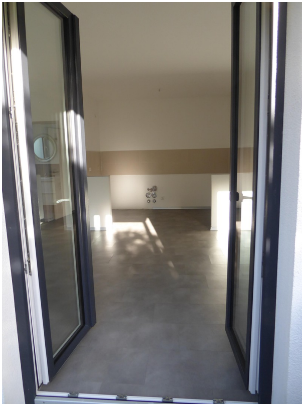
vom Balkon in die Wohnung