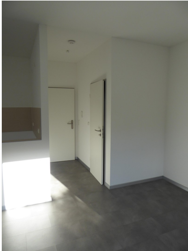
Eingang/Diele + bstellraum