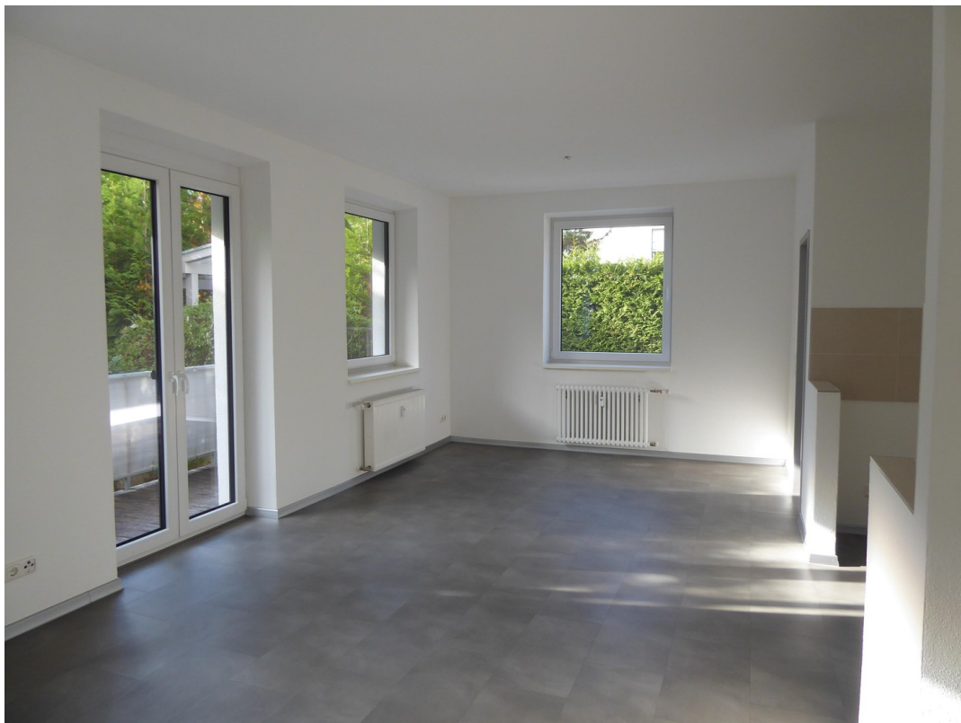
Wohnen, Küche, Essen / Balkon