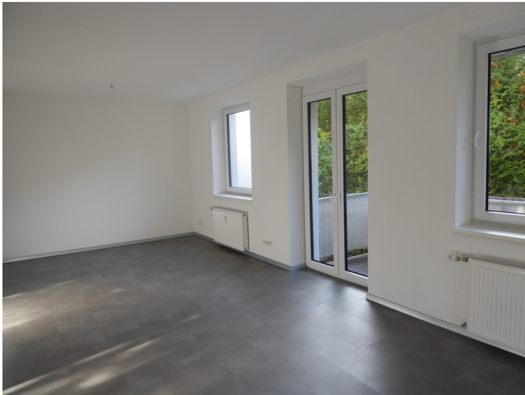
Wohnen, Küche, Essen / Balkon