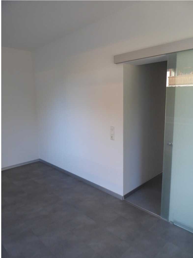
Schlafen/Dusche hinter Glass.