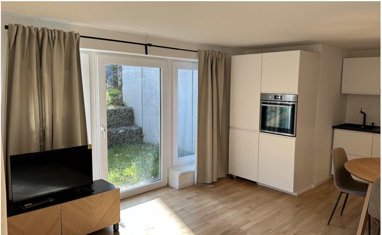
Wohnzimmer / Terrasse