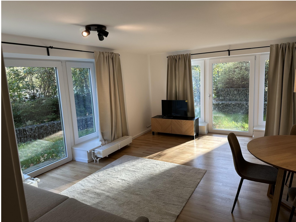
Wohnzimmer / Terrasse