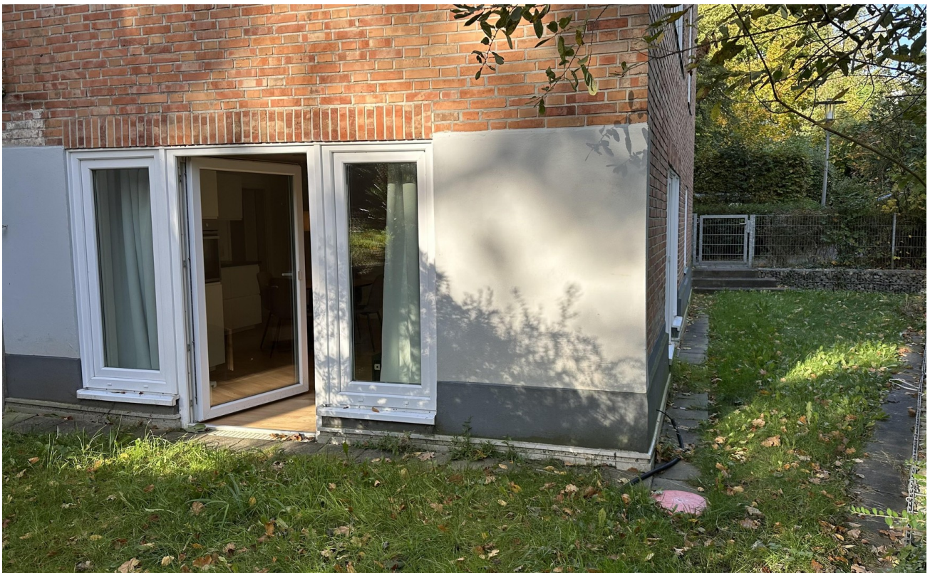
Garten / Terrasse