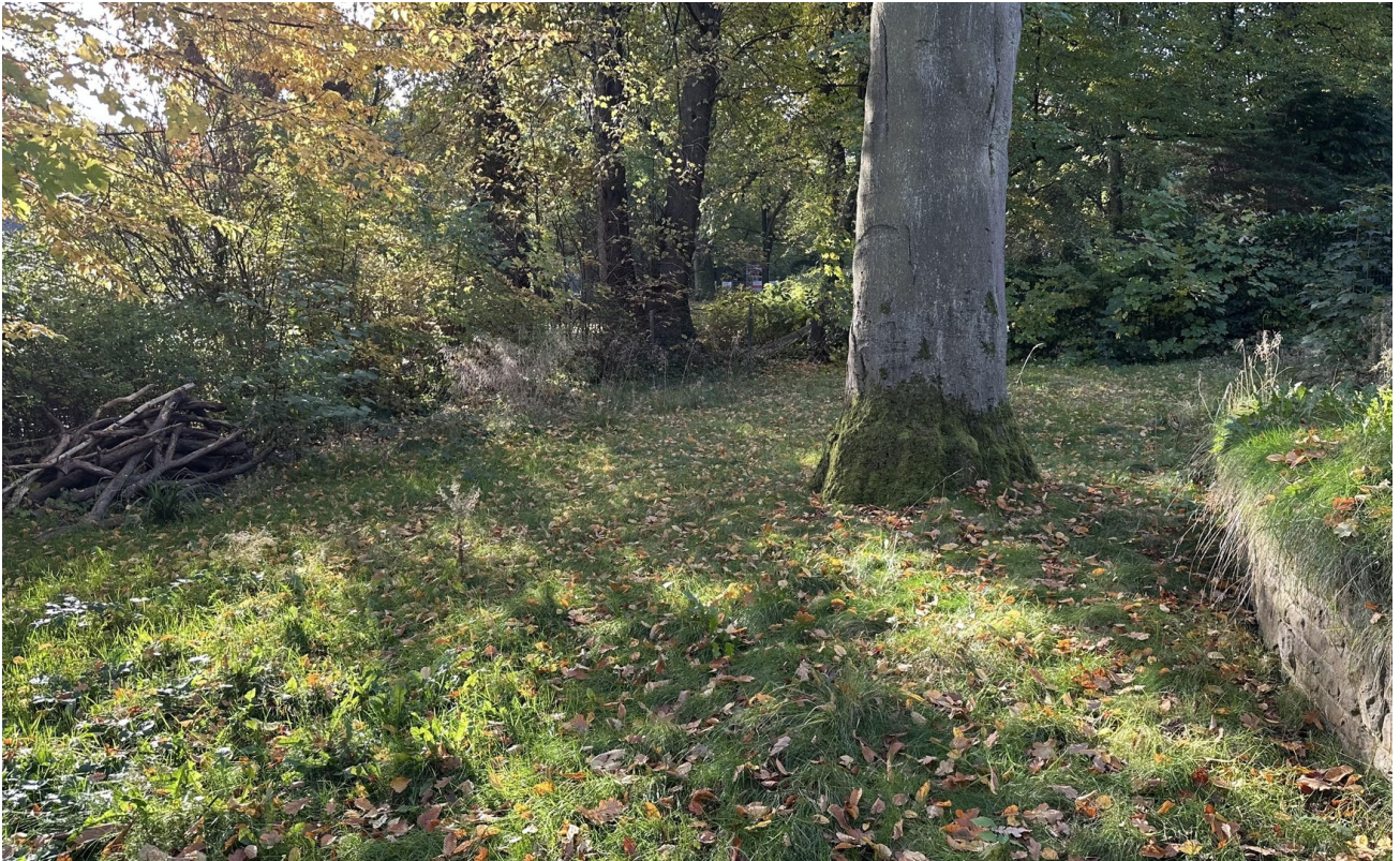
Garten zur Alleinnutzung