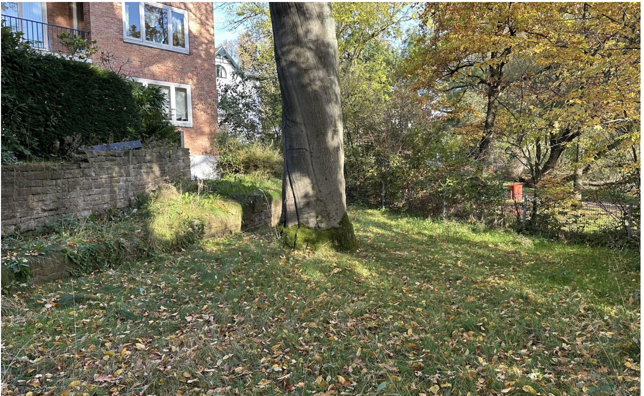
Garten zur Alleinnutzung