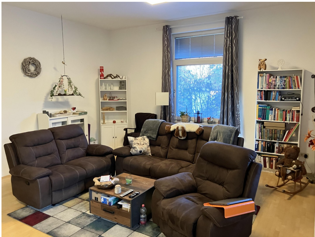
Wohnzimmer m. Terrassenzugang