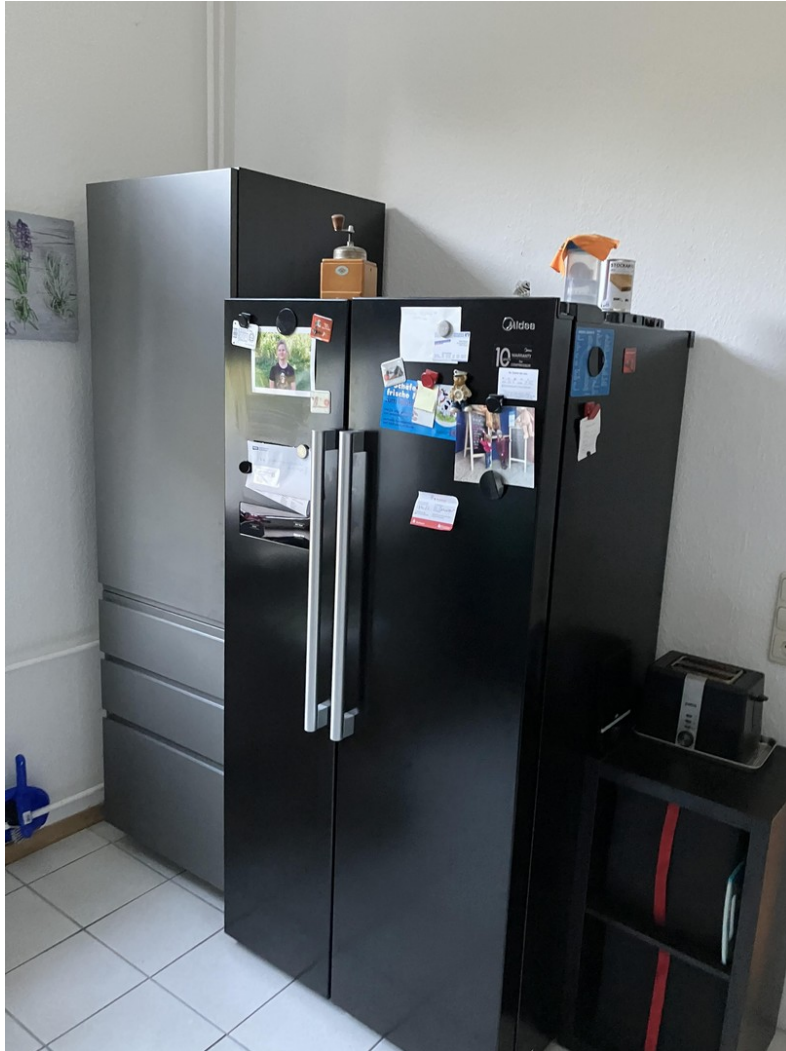
Einbauküche zur Übernahme