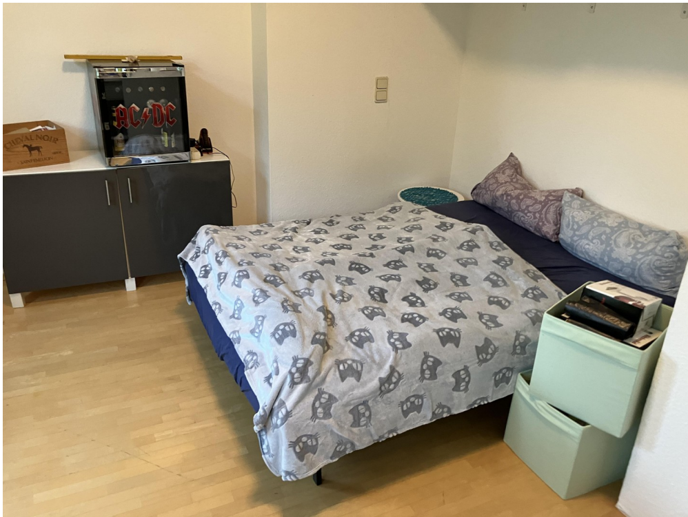
Gäste- o. Arbeitszimmer