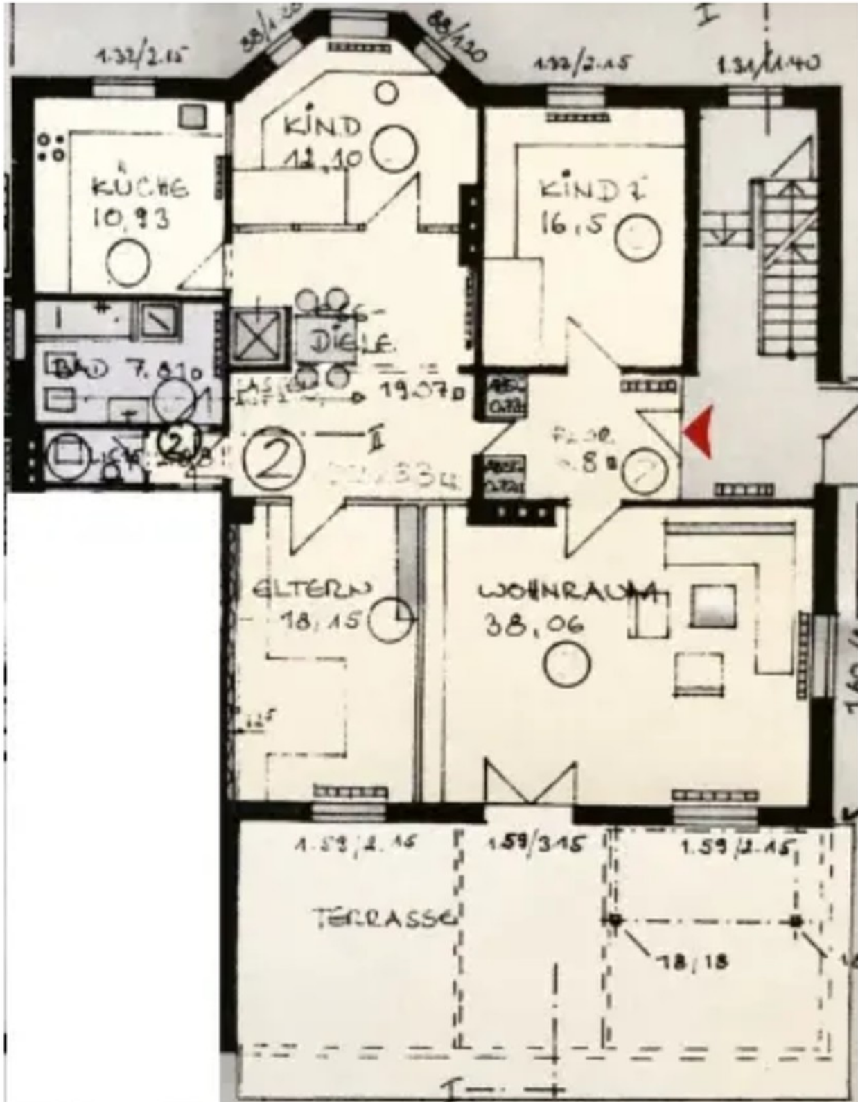
Grundriss bietet viel Platz