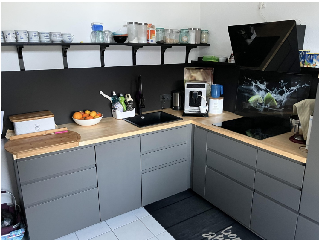
Einbauküche zur Übernahme