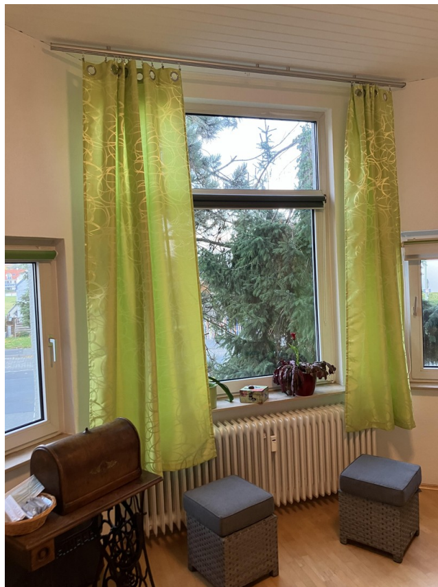
Gäste- o. Arbeitszimmer