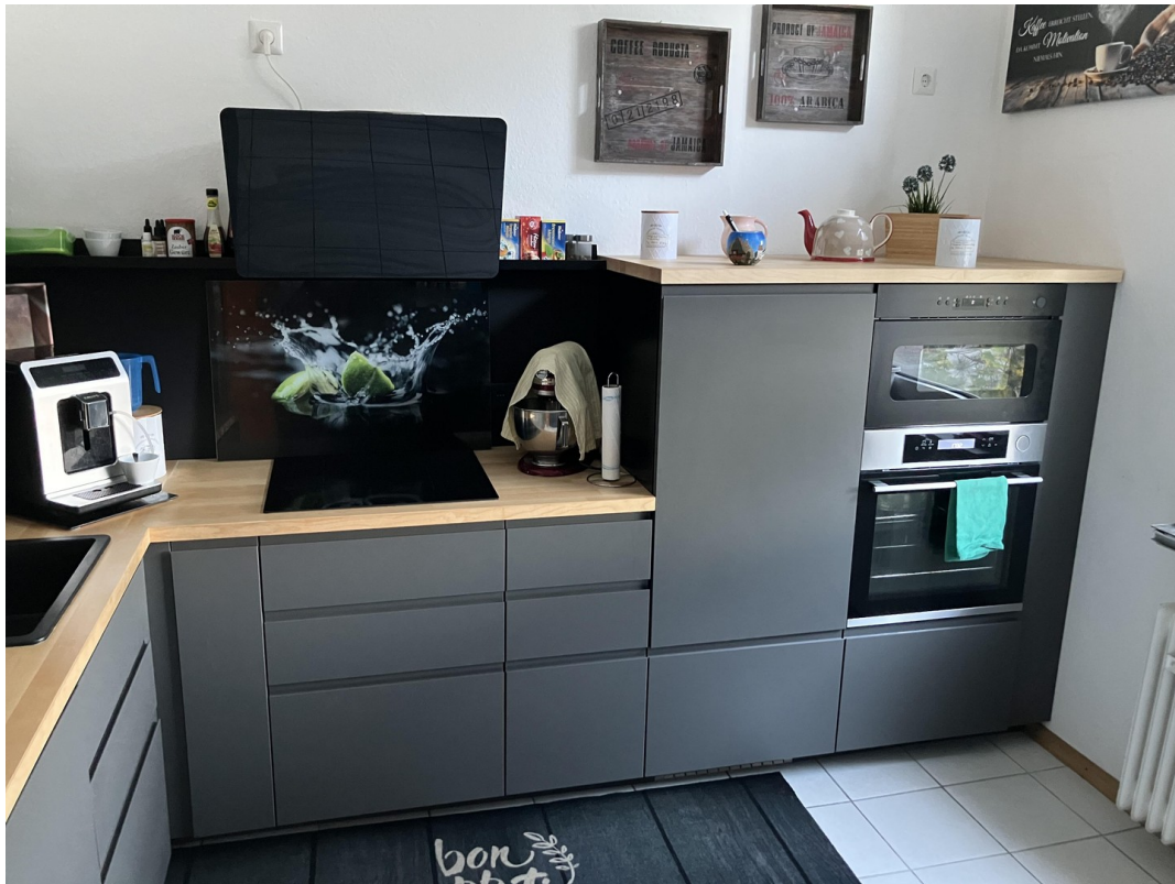
Einbauküche zur Übernahme