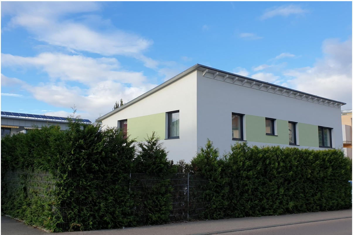
Haus und Garten