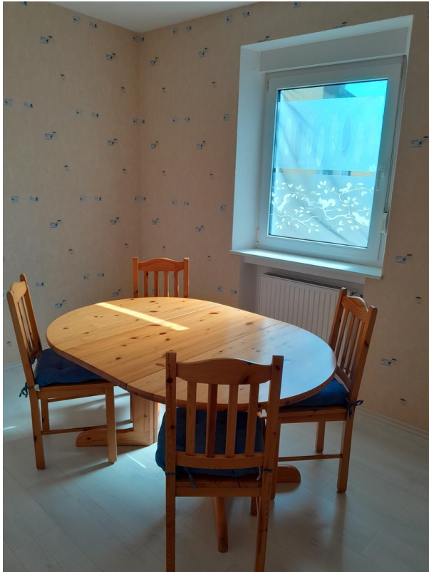
Zimmer 1 OG