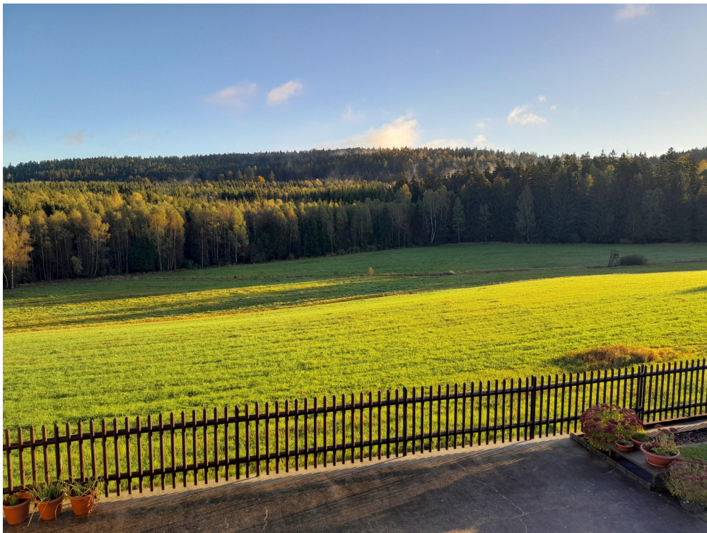
Blick zum Schellenberg