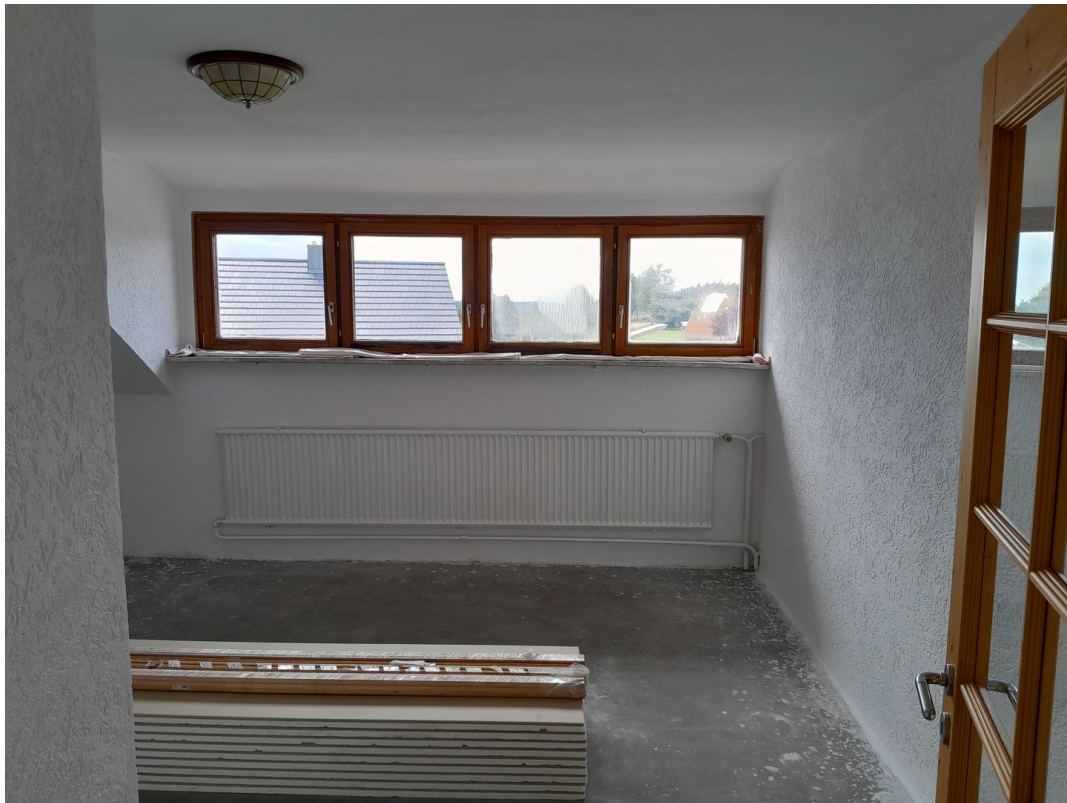
Zimmer 2 OG