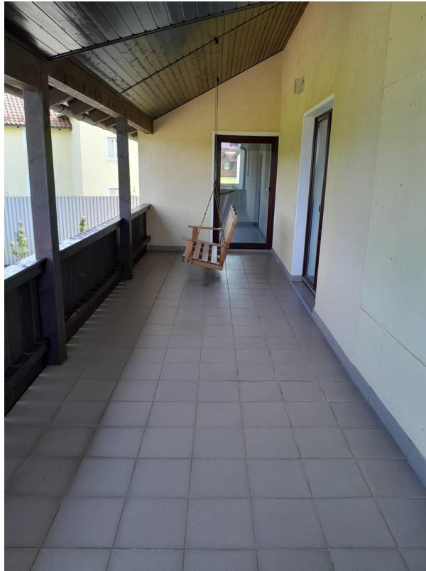
Terrasse 1 OG Nord/Ost