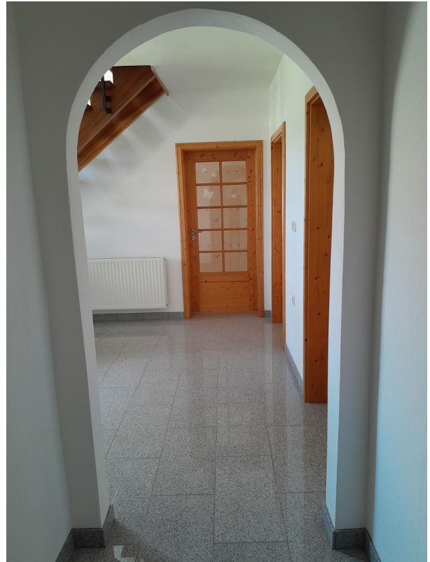
Diele 1 OG