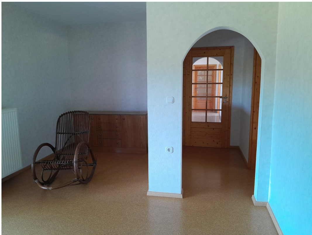
Zimmer 1 OG