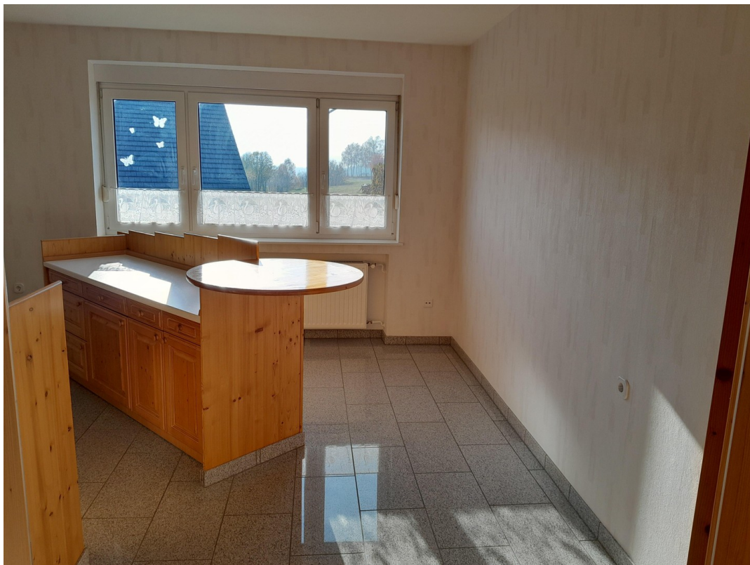
Küche 1 OG