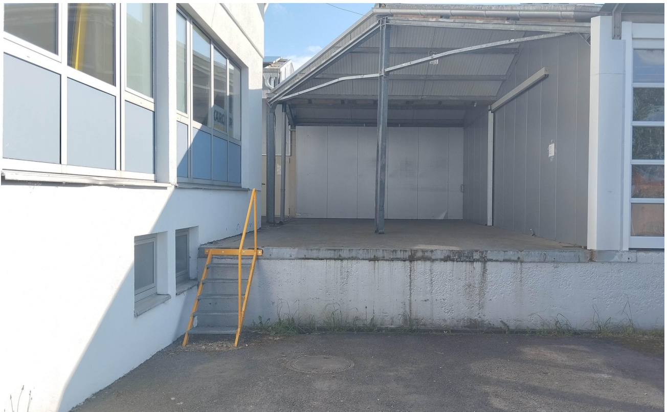
Halle 2 - Außenrampe