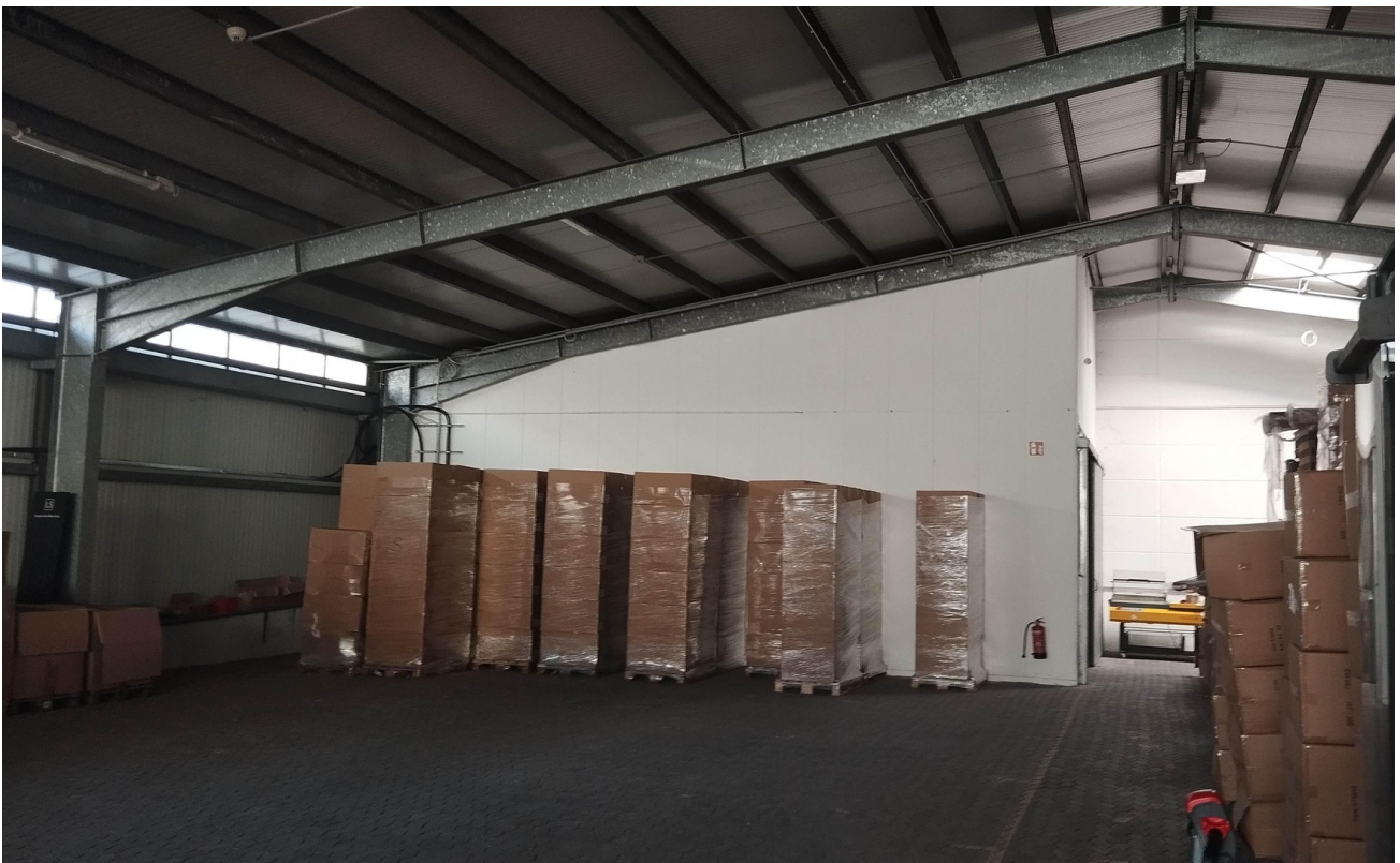
Halle 2 - Innen