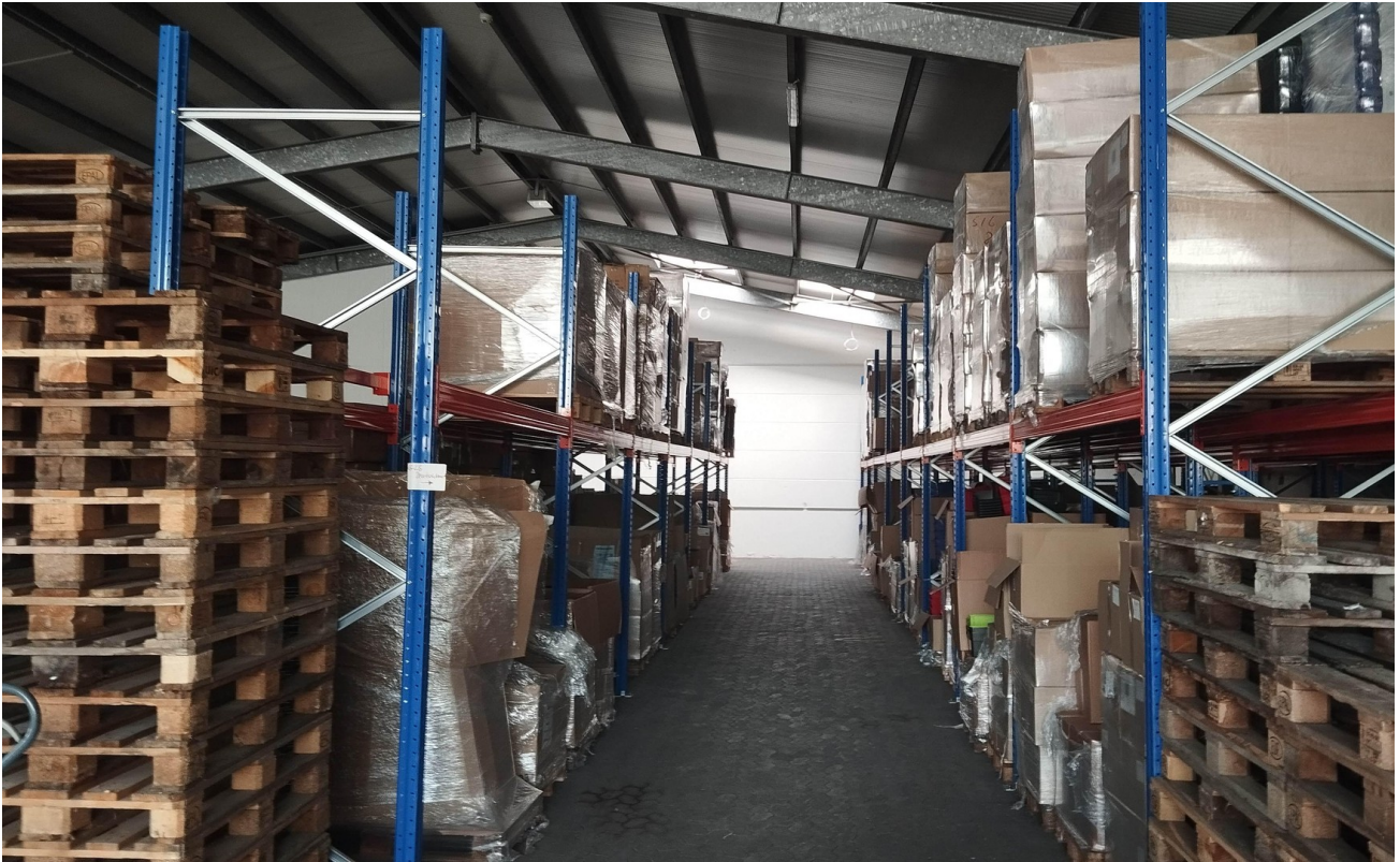
Halle 2 - Innen