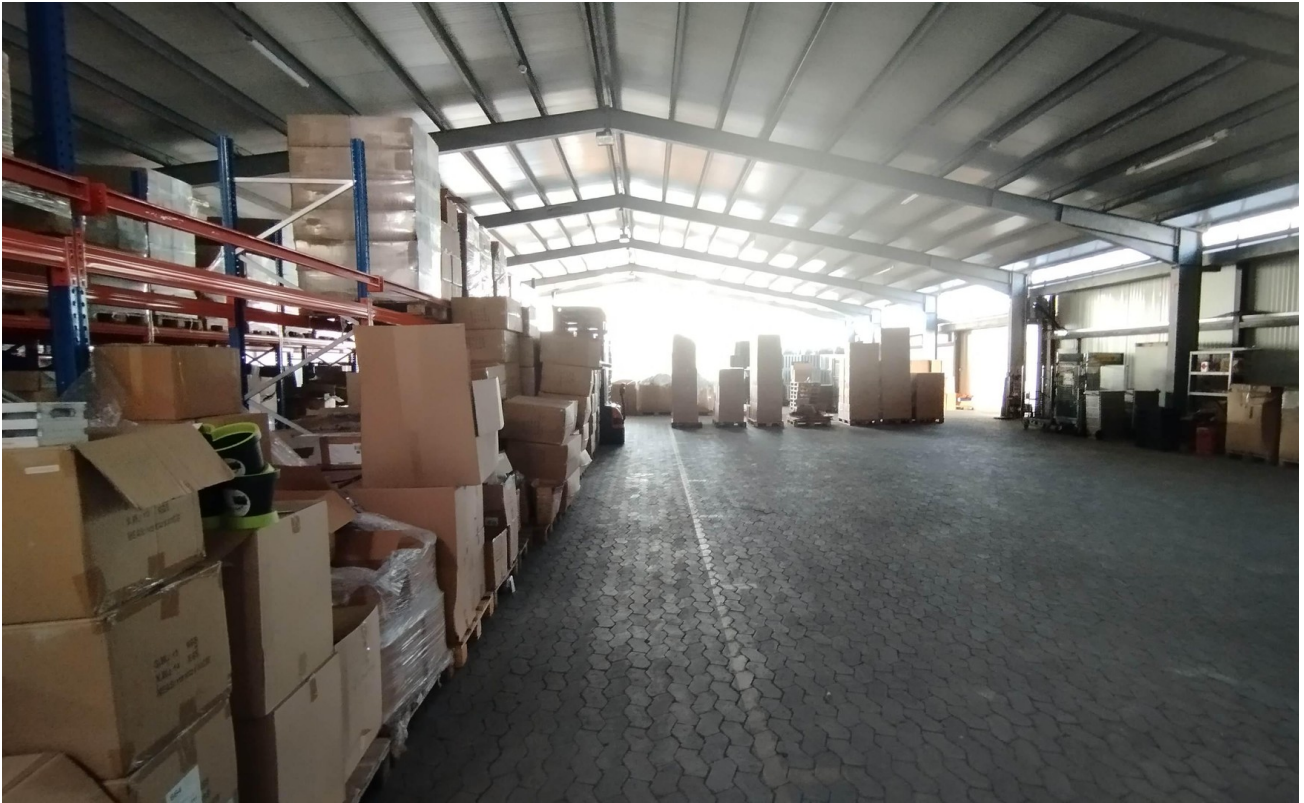
Halle 2 - Innen