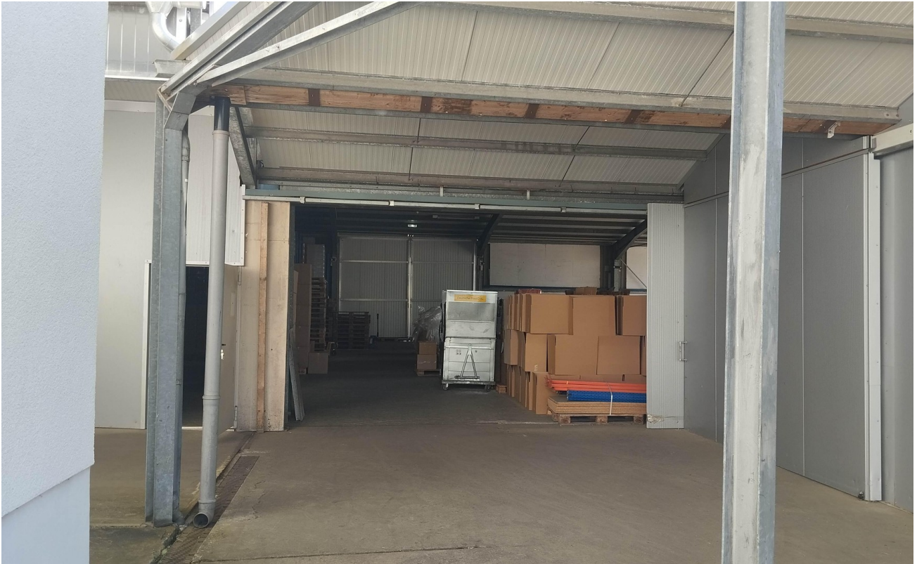
Halle 2 - Außenrampe