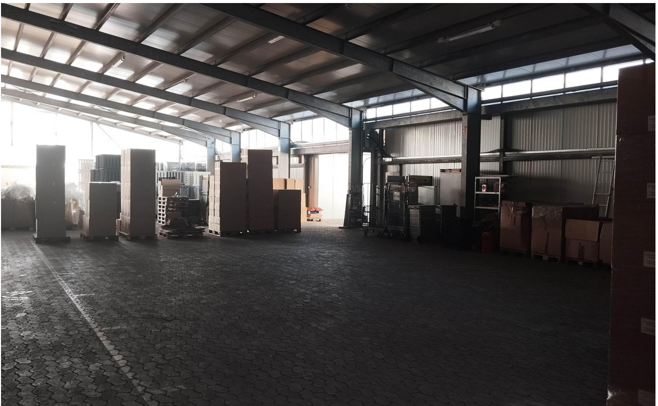
Halle 2 - Innen