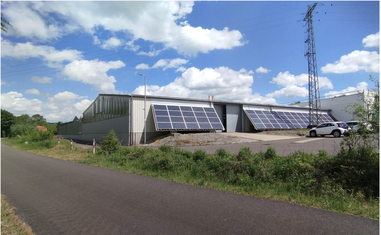
Halle 2 - Außen