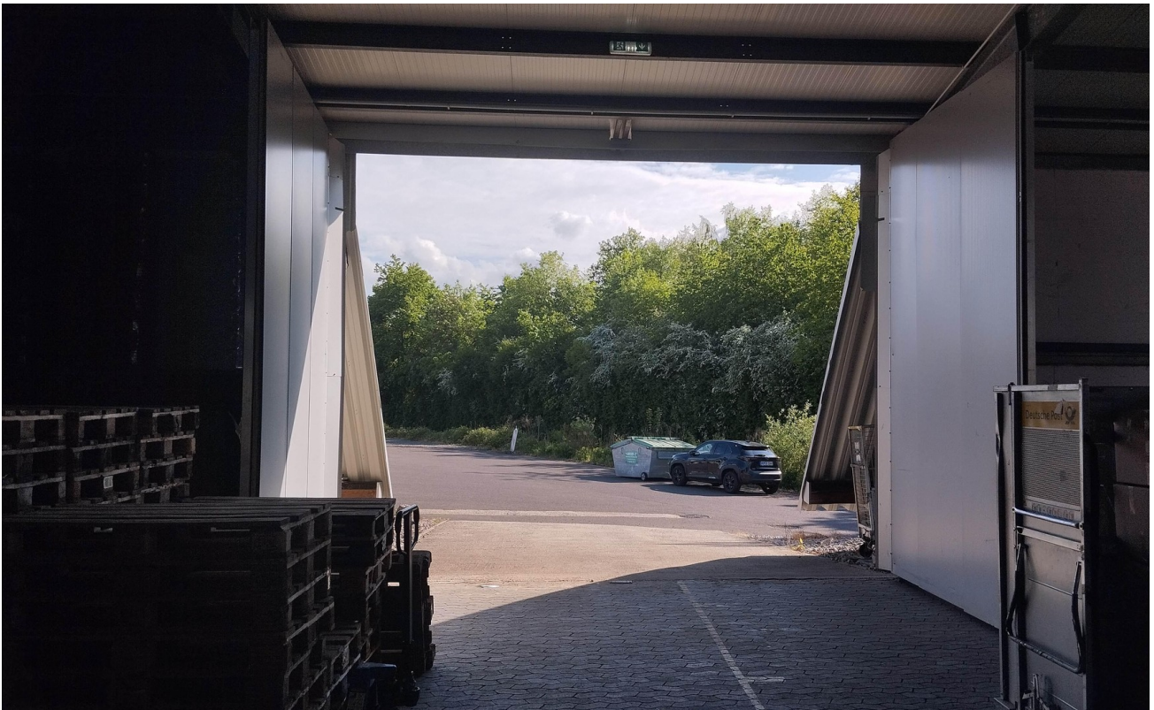
Torbereich - LKW befahrbar