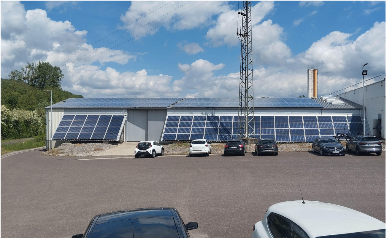
Halle 2 - Außenansicht