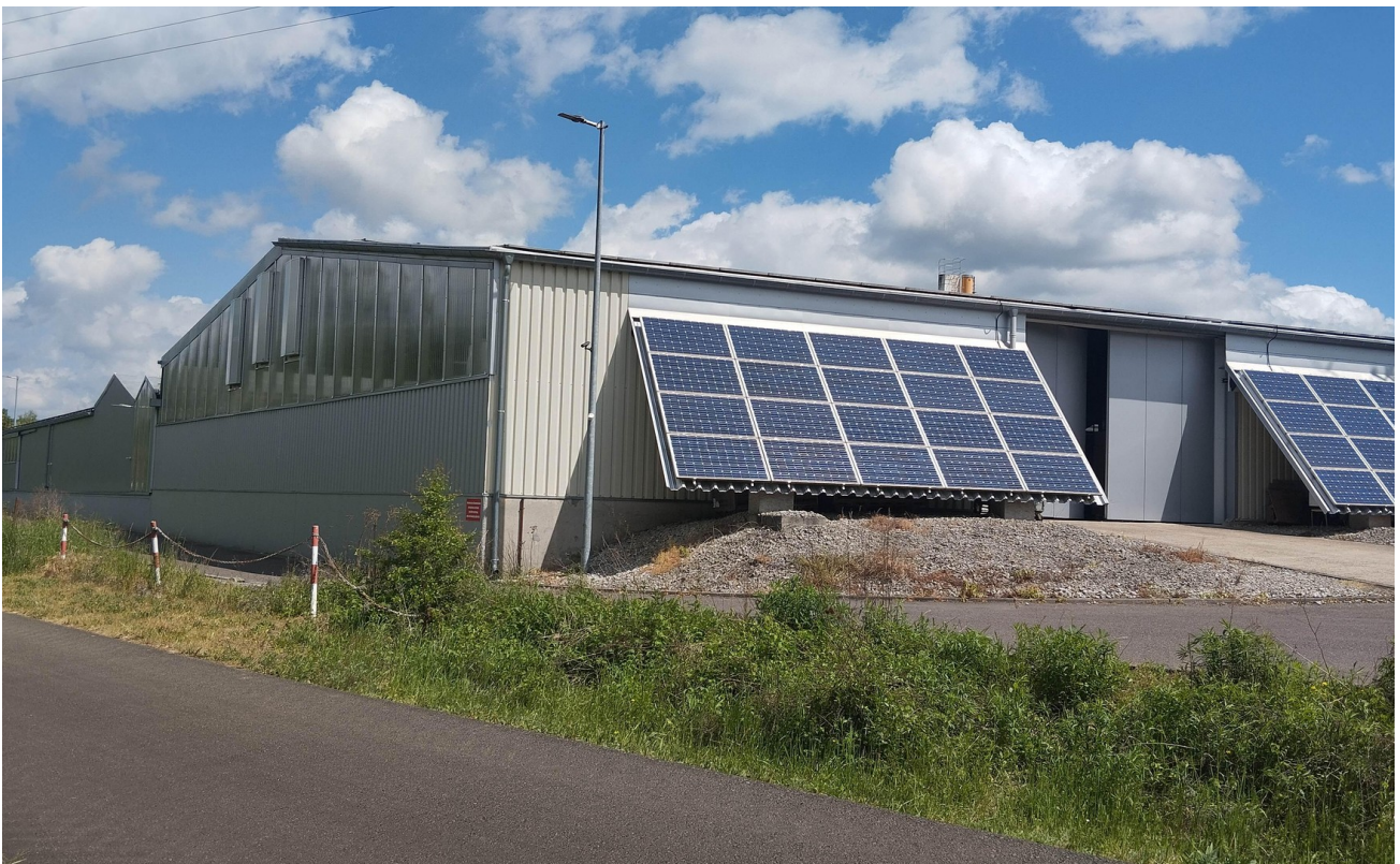
Halle 2 - Außen