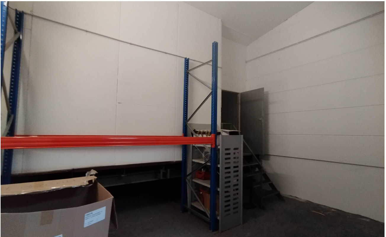
Halle 2 - Abstellraum