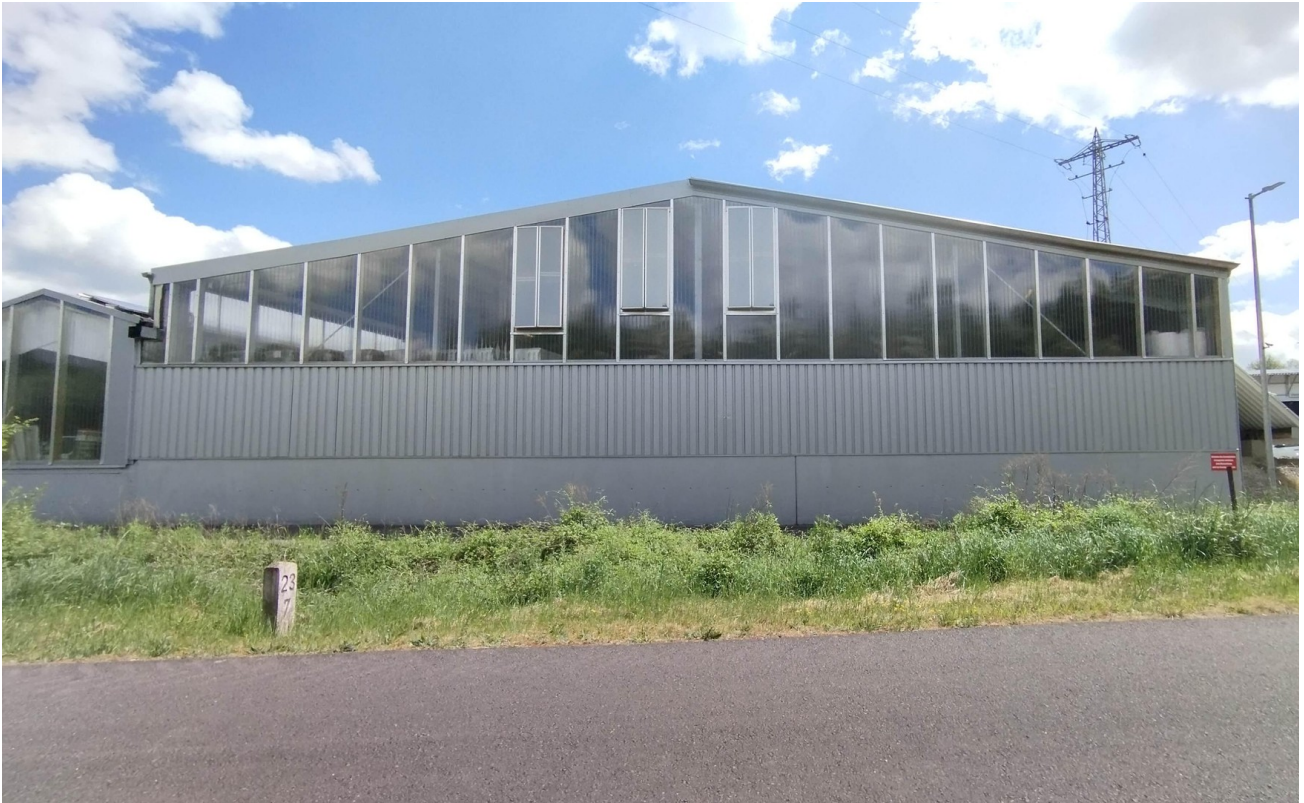
Halle 2 - Seitenansicht