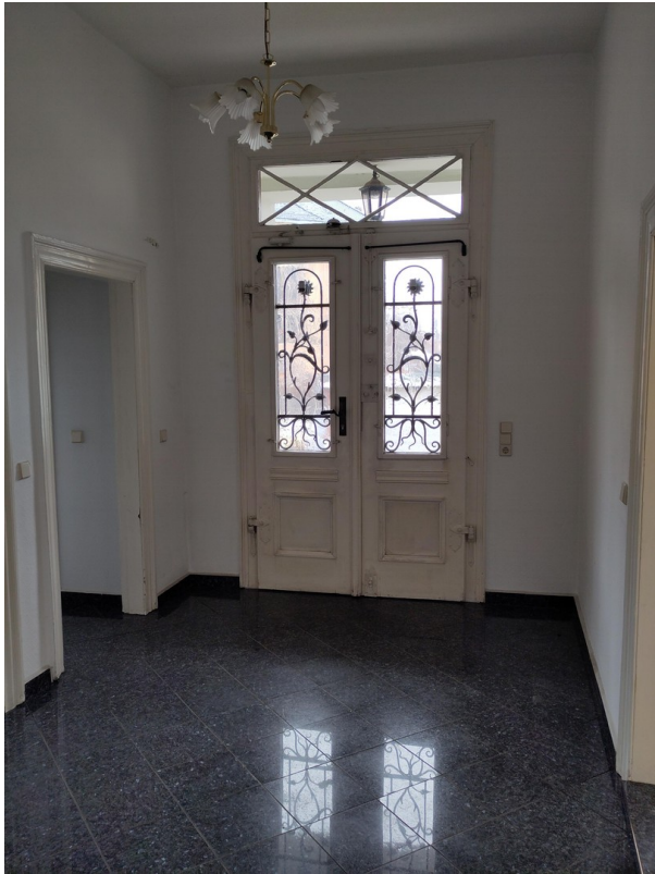
Haustür - wird noch gestrichen