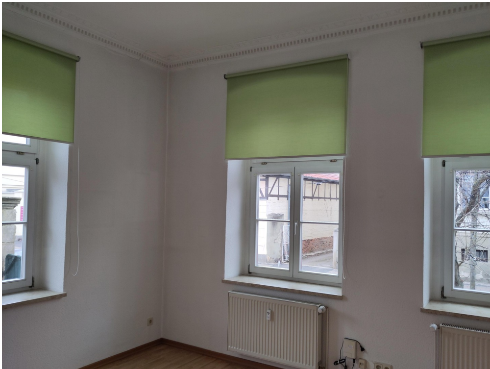
Arbeits- Esszimmer mit Stuck