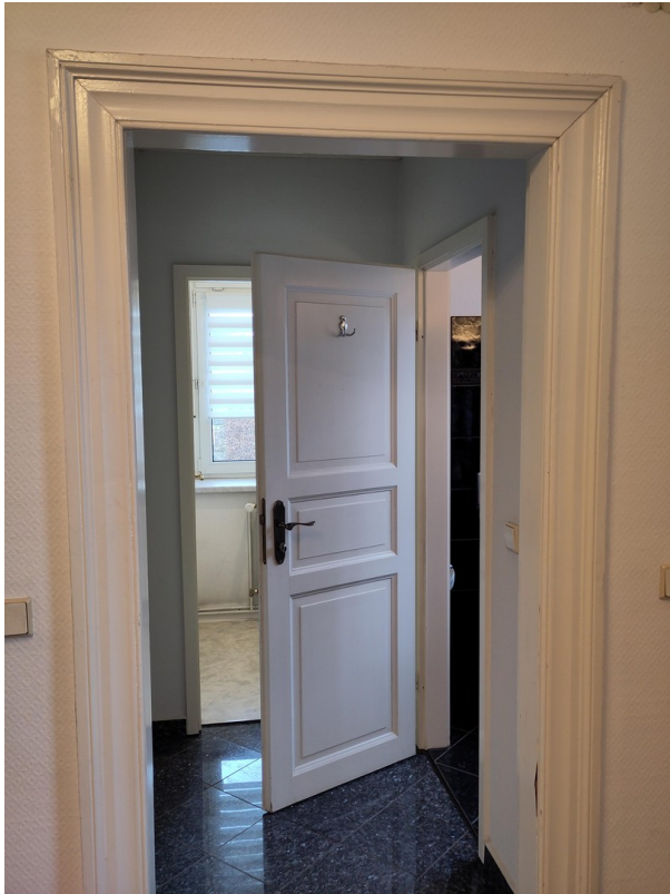
Flur Gäste WC