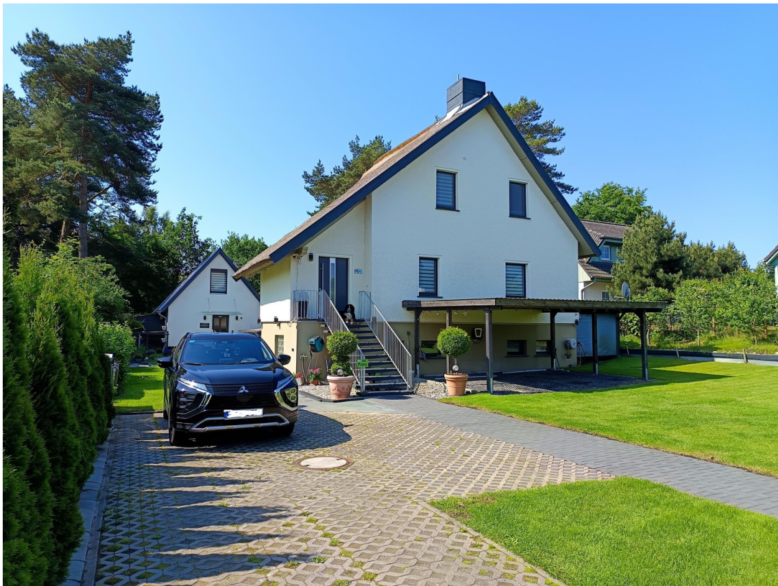
Haus mit Nebengebäude