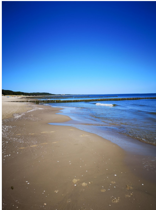
Feiner breiter Sandstrand