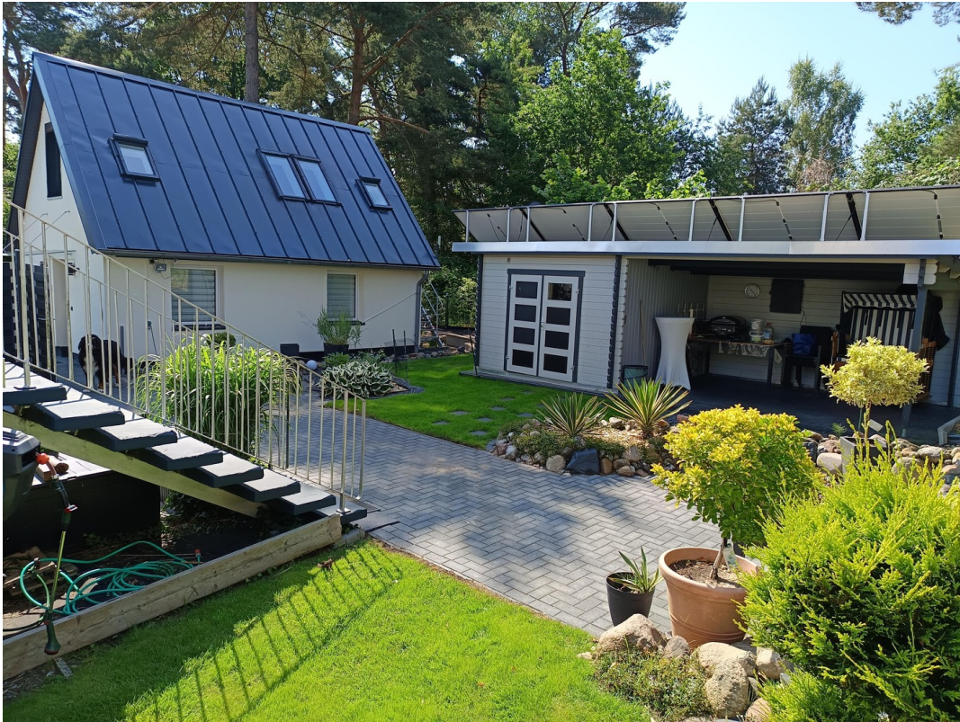
Praxis und Fitness