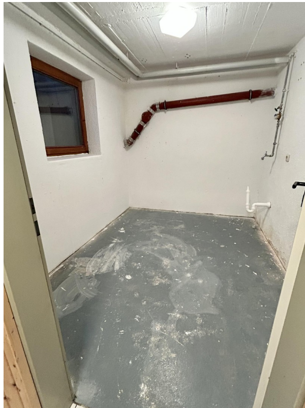
1. Keller mit Tageslicht