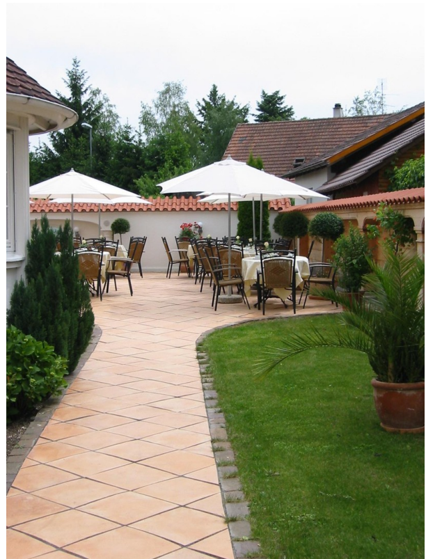
Weg zur Terrasse