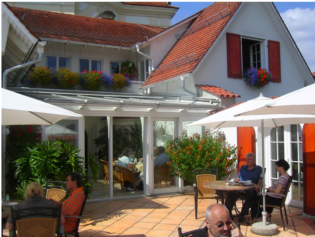
Blick auf Wintergarten