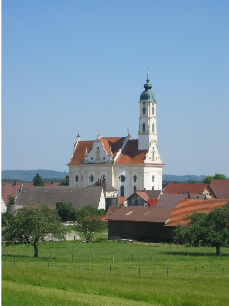
schönste Dorfkirche der Welt