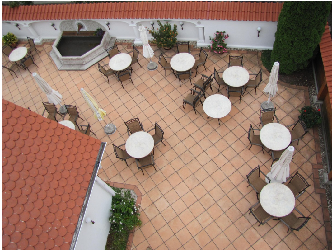
Terrasse von oben