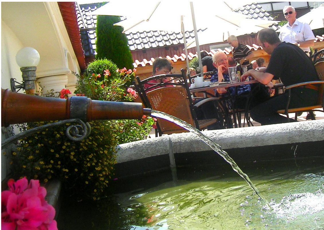
Wasserspiel auf der Terrasse