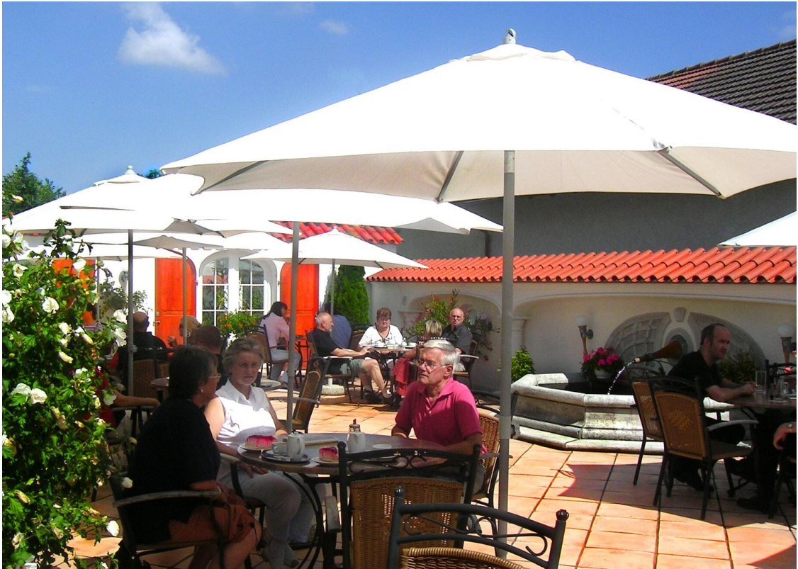
Terrasse mit Blick auf Brunnen