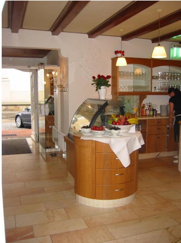
Eingangsbereich m. Kuchentheke