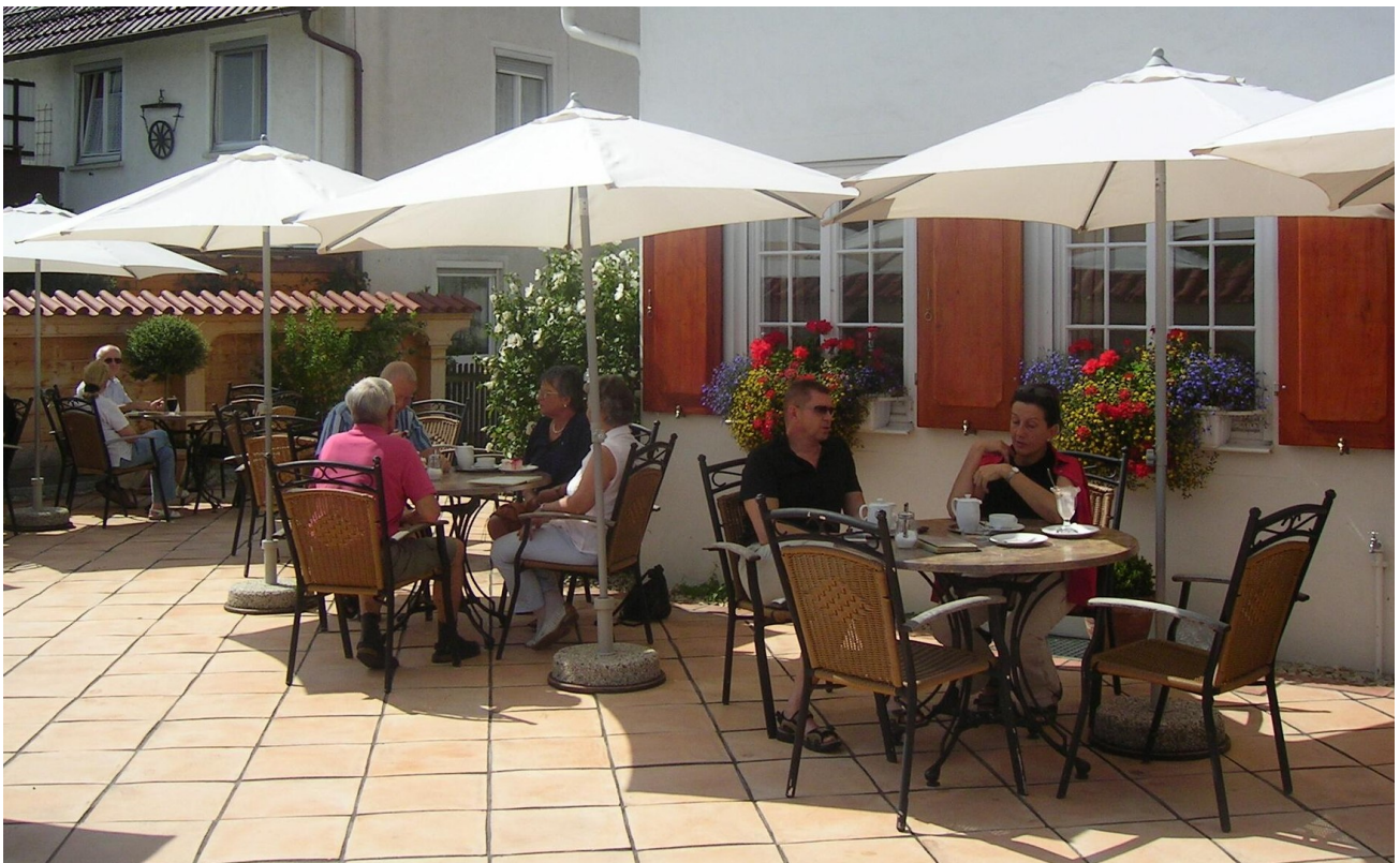
Terrasse mit Blick auf Haus