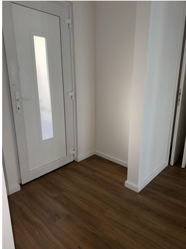
Platz für Garderobe