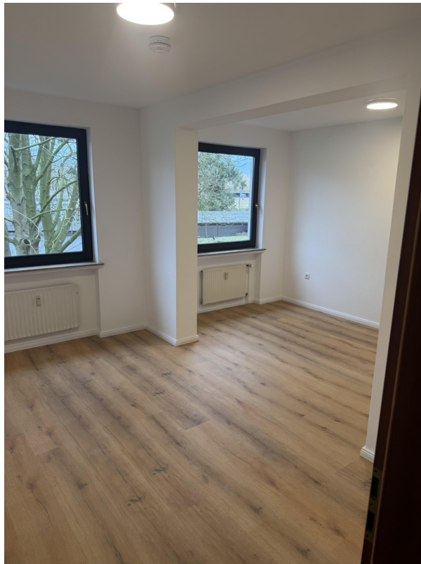
Schlafzimmer 2 = 17,28 m 2