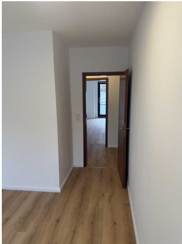
Wohnzimmer Blick in Küche