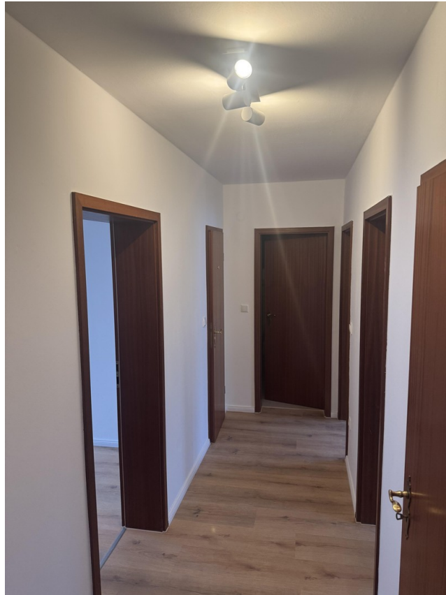
Blik in den Flur = 6,80 m 2