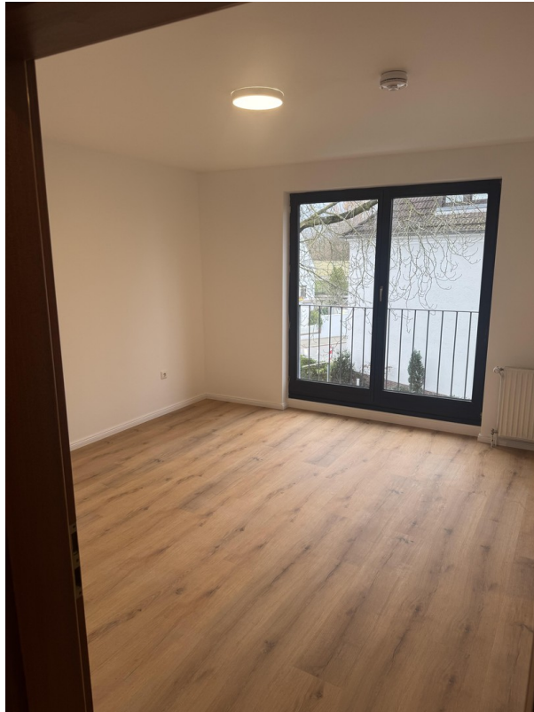
Schlafzimmer 1 = 17,16 m 2