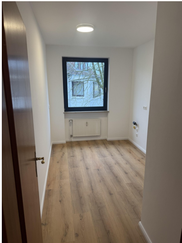
Küche = 7,92 m2