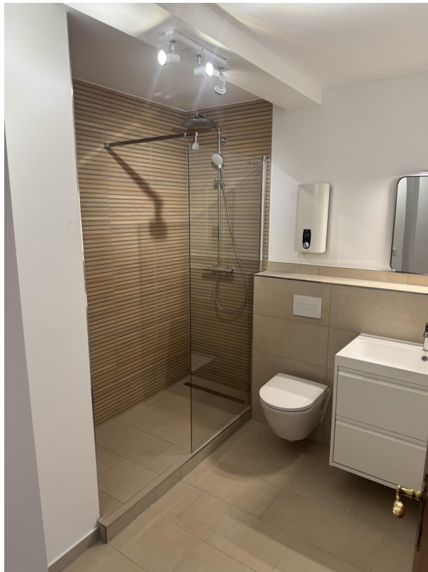
Bad mit Dusche = 5,86 m 2