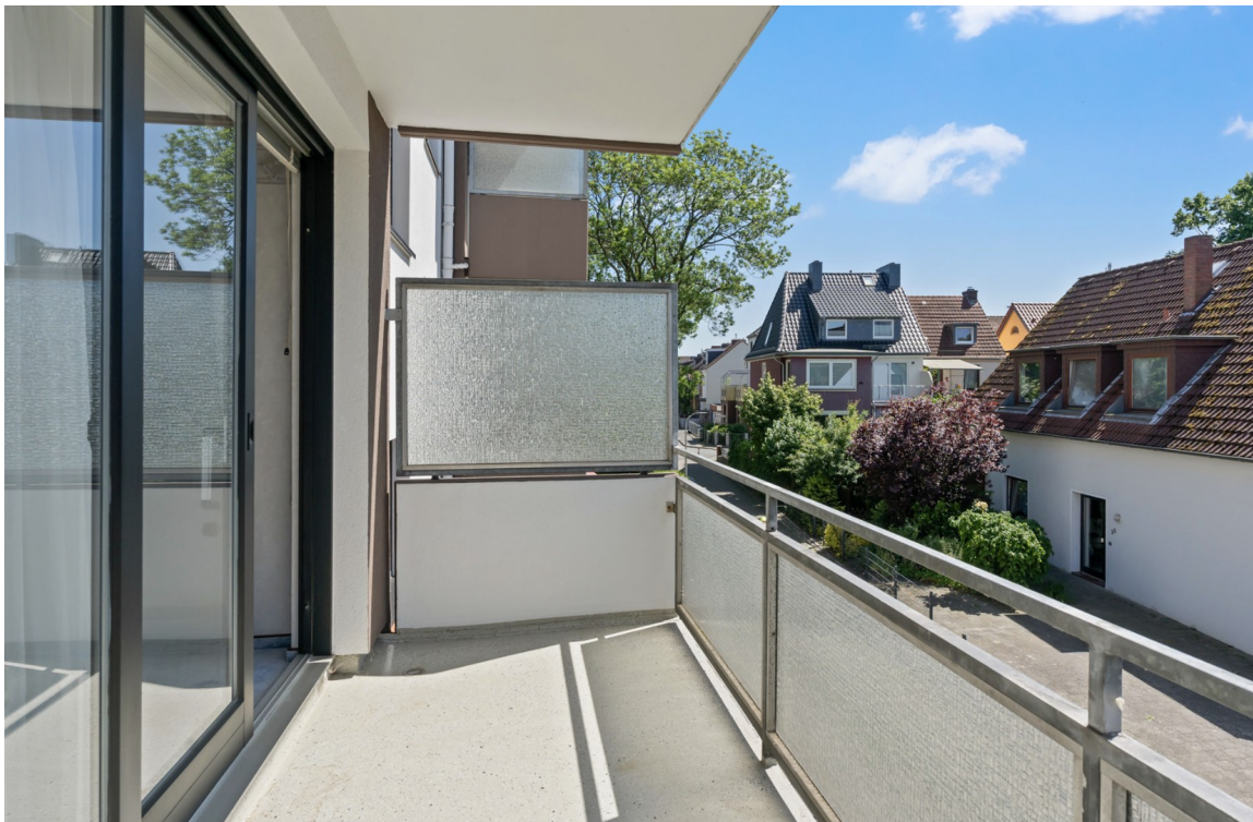
Der Balkon = 6,24 m 2