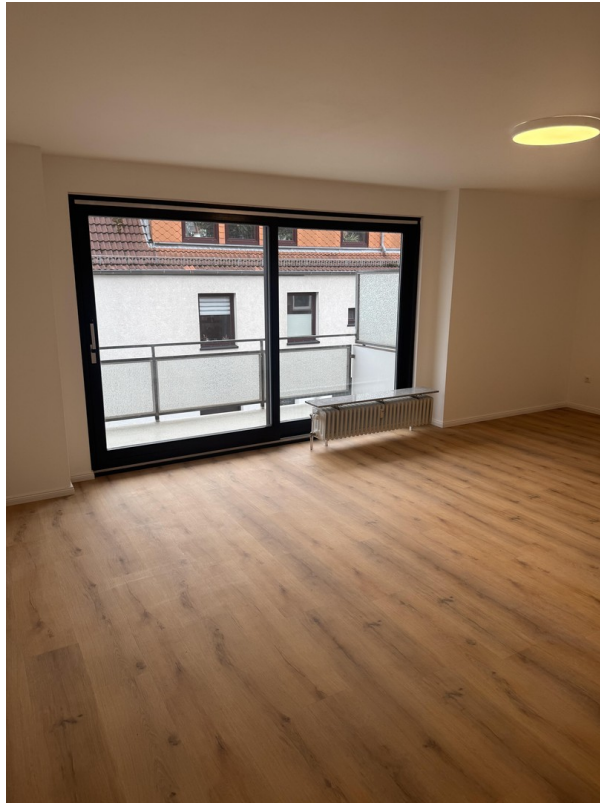
Blick ins Wohnzimmer =29,95 m2