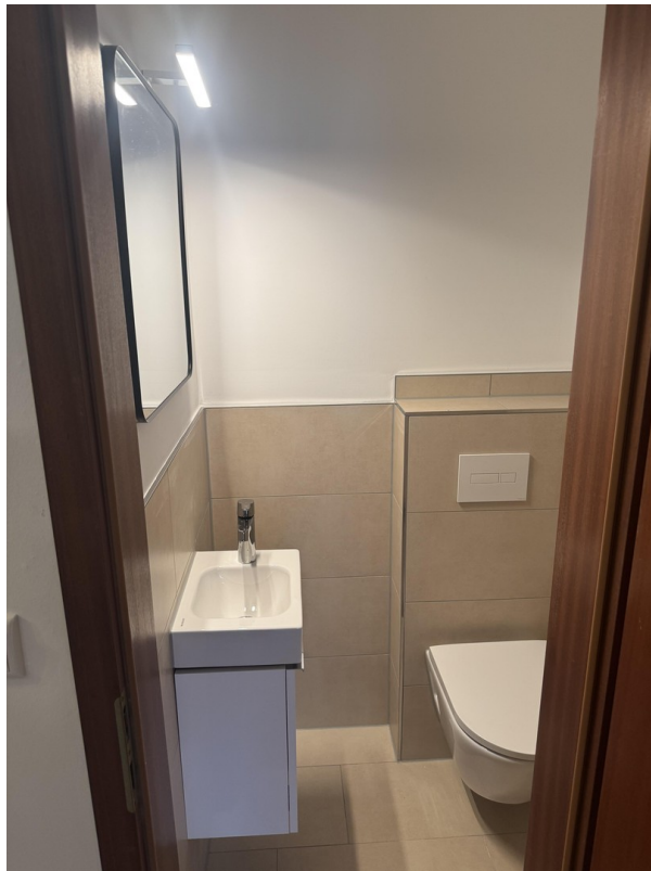
Gäste WC = 1,35 m2