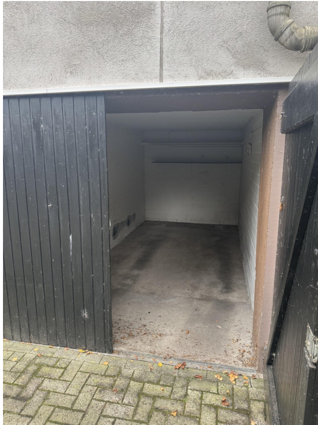
Platz für's Auto