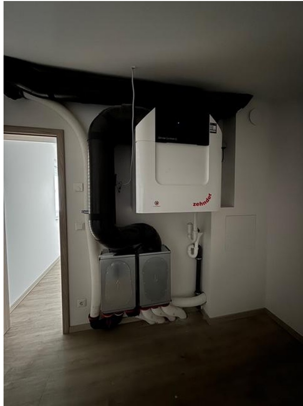
Technikraum innerhalb der Whg