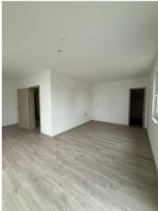
Wohnen + Küche