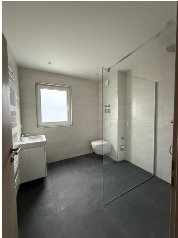
Badezimmer mit Dusche+Fenster