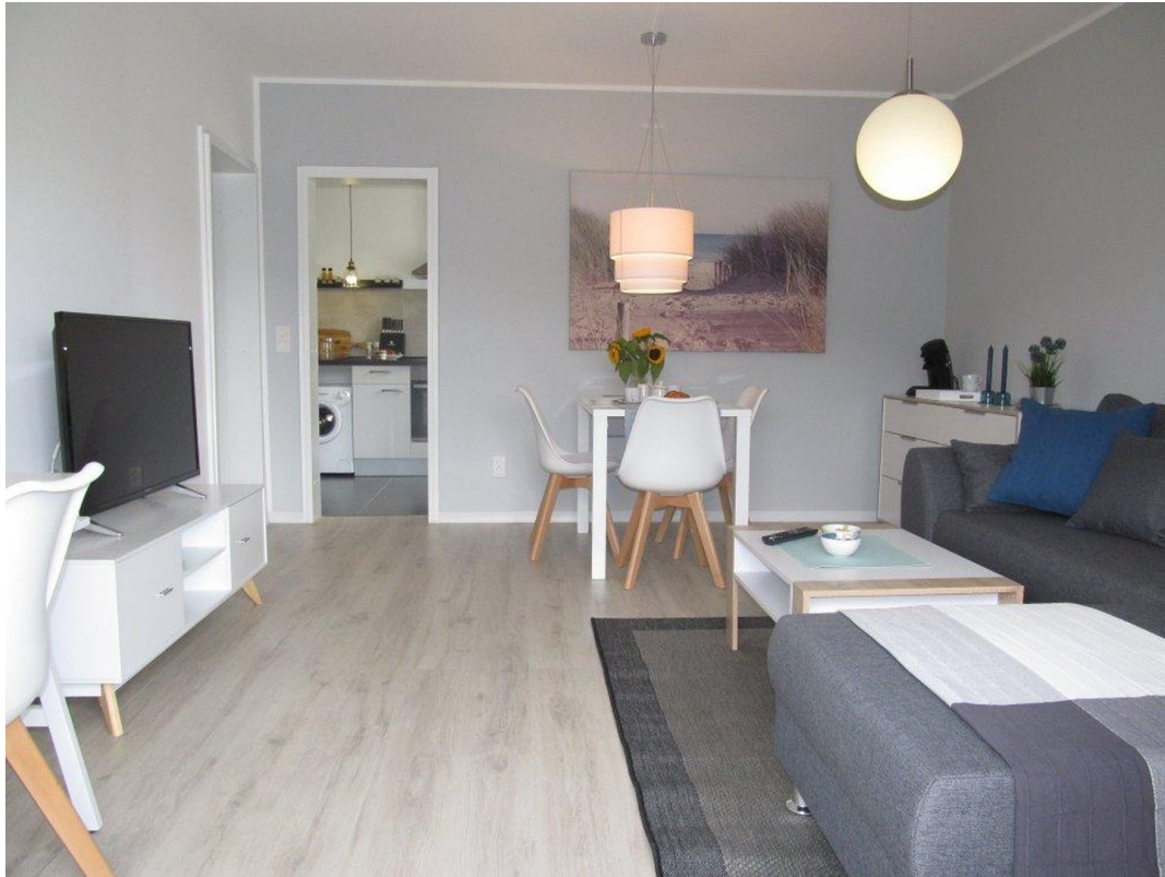
Wohnen + Essen