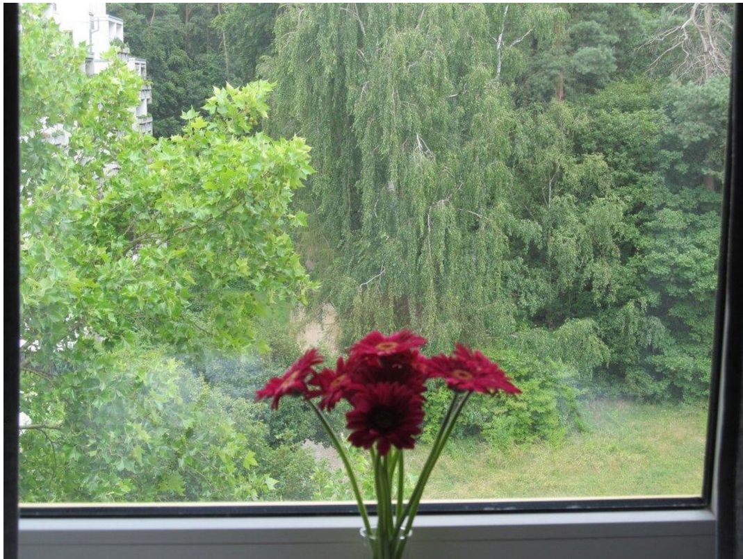
Blick aus dem Schlafzimmer