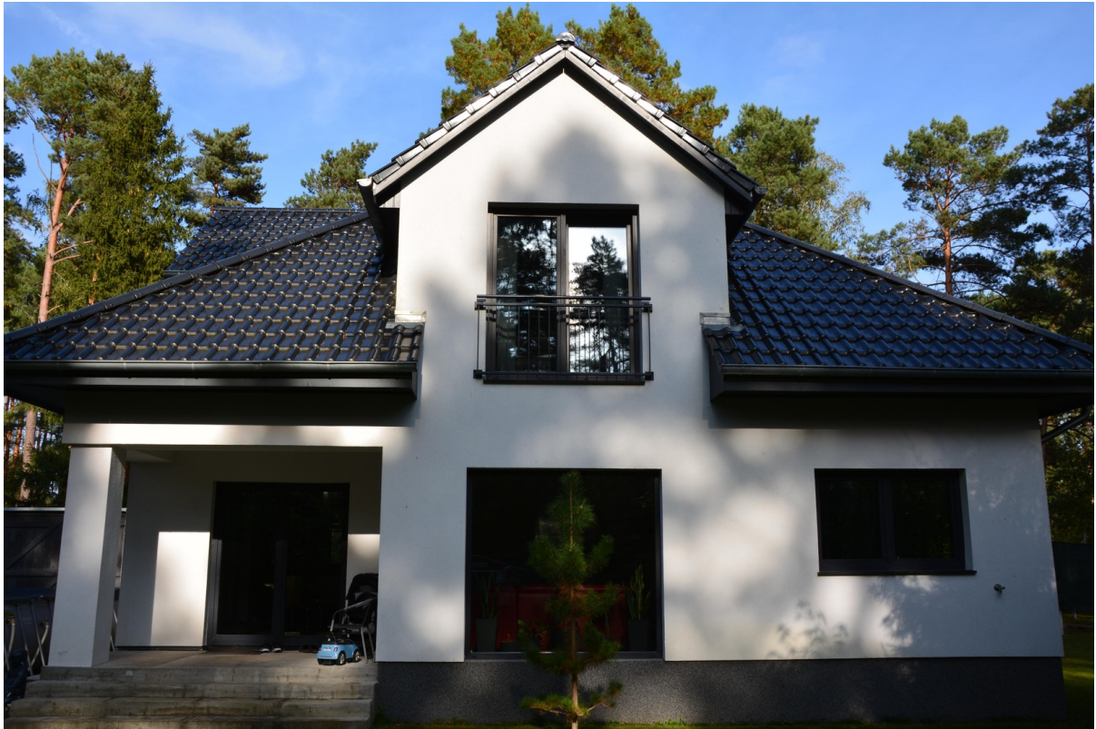
Haus links hinten