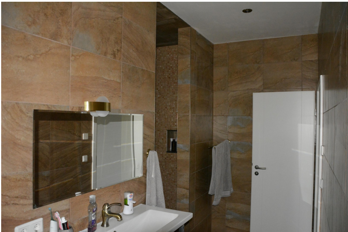
Haus rechts Gästebad