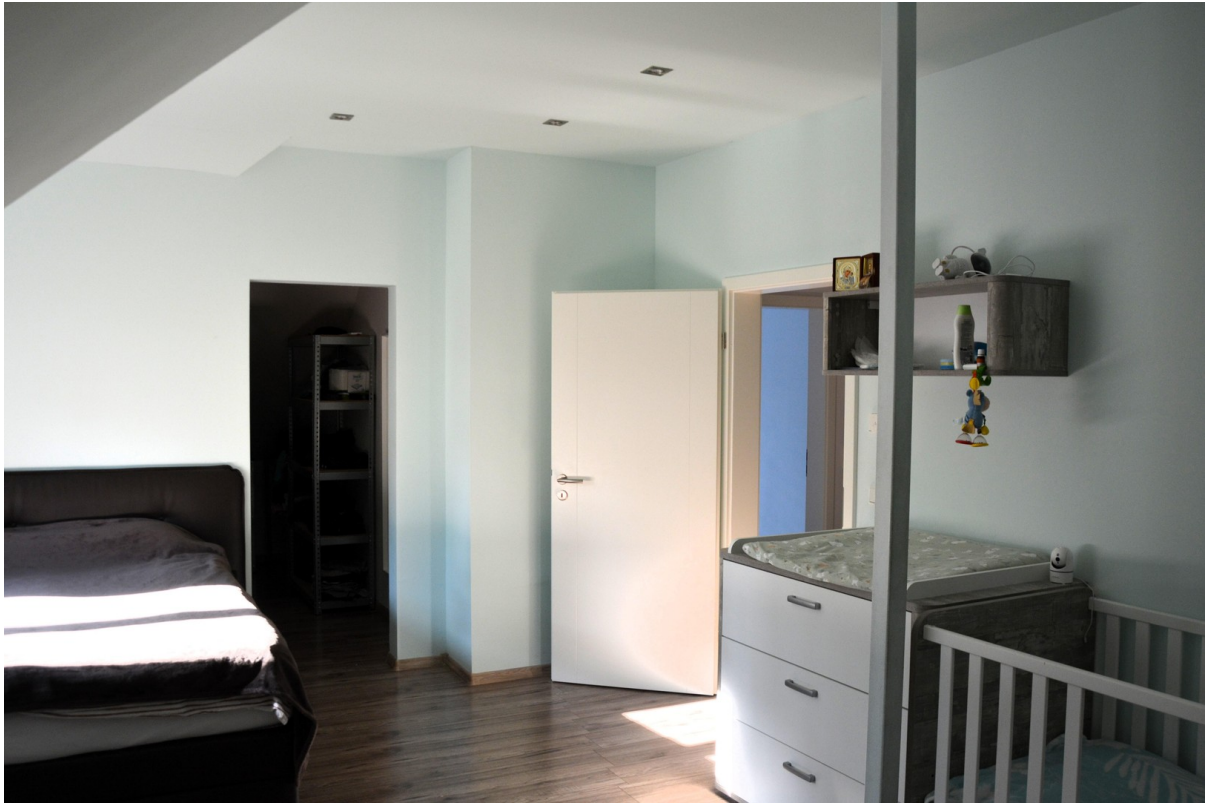
Haus links OG