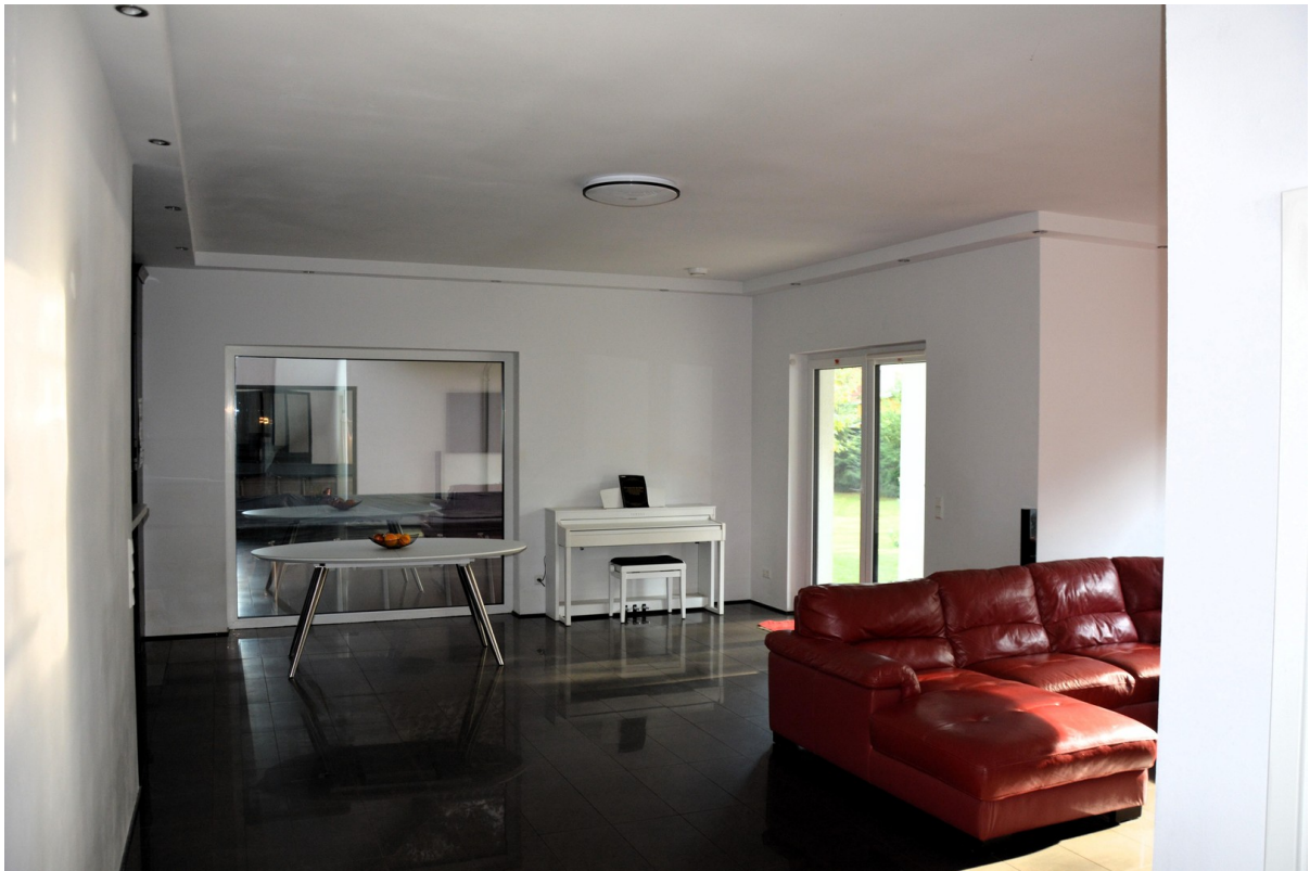
Haus rechts Wohnzimmer