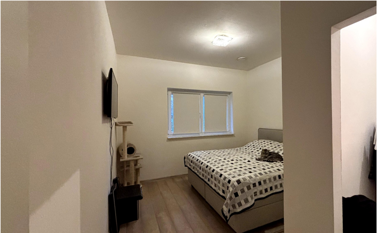
Haus rechts EG