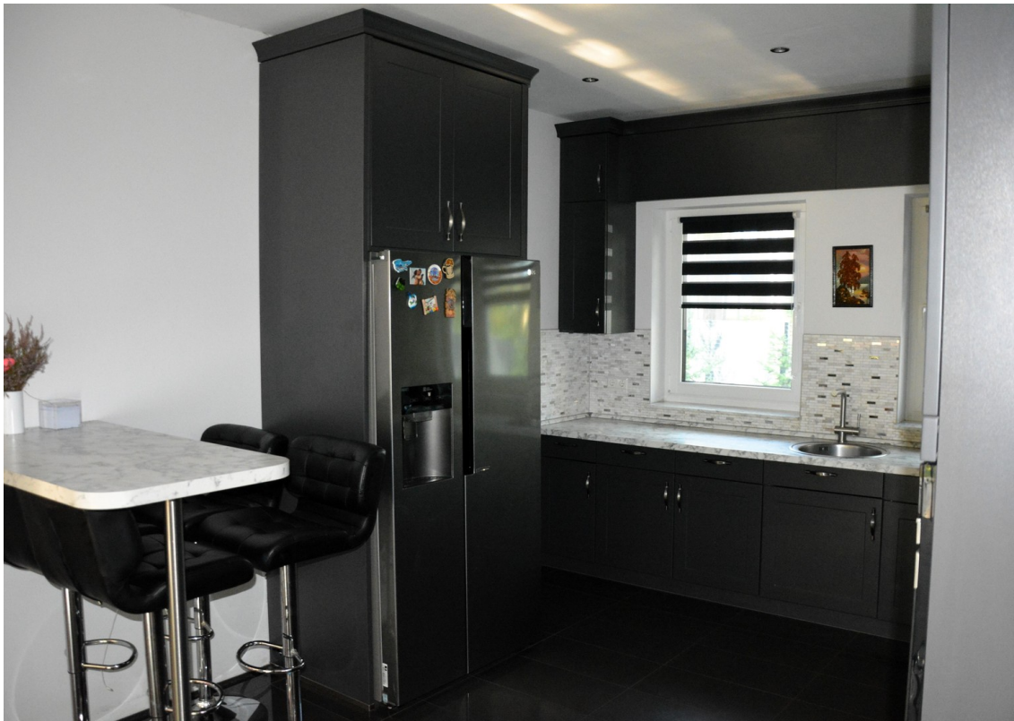
Haus rechts Küche