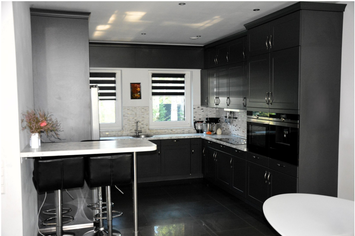
Haus rechts Küche