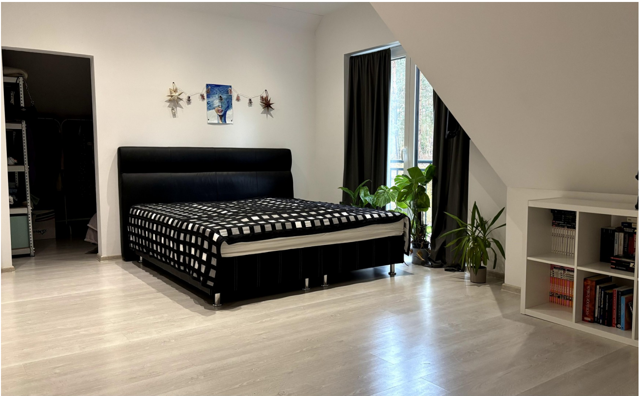
Haus rechts OG