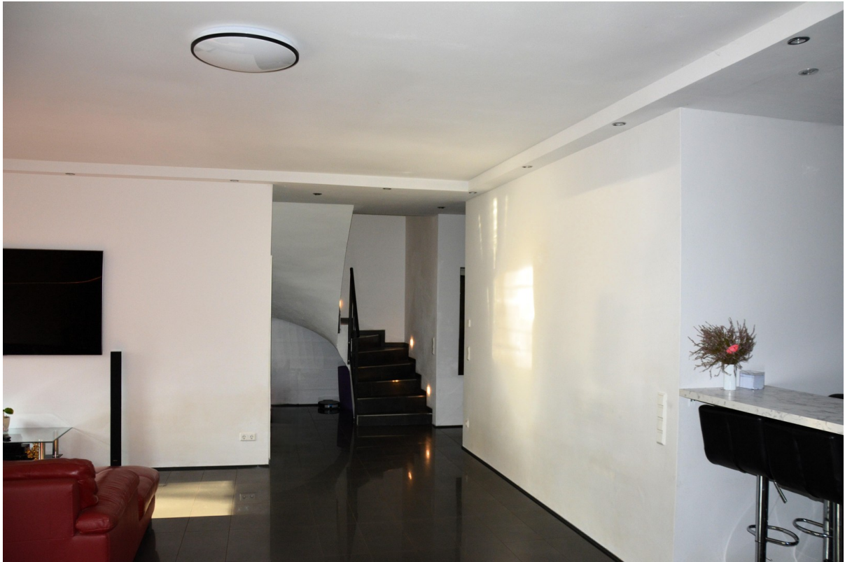
Haus rechts Wohnzimmer