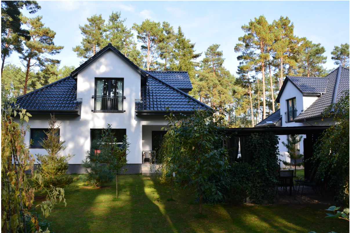
Haus rechts hinten