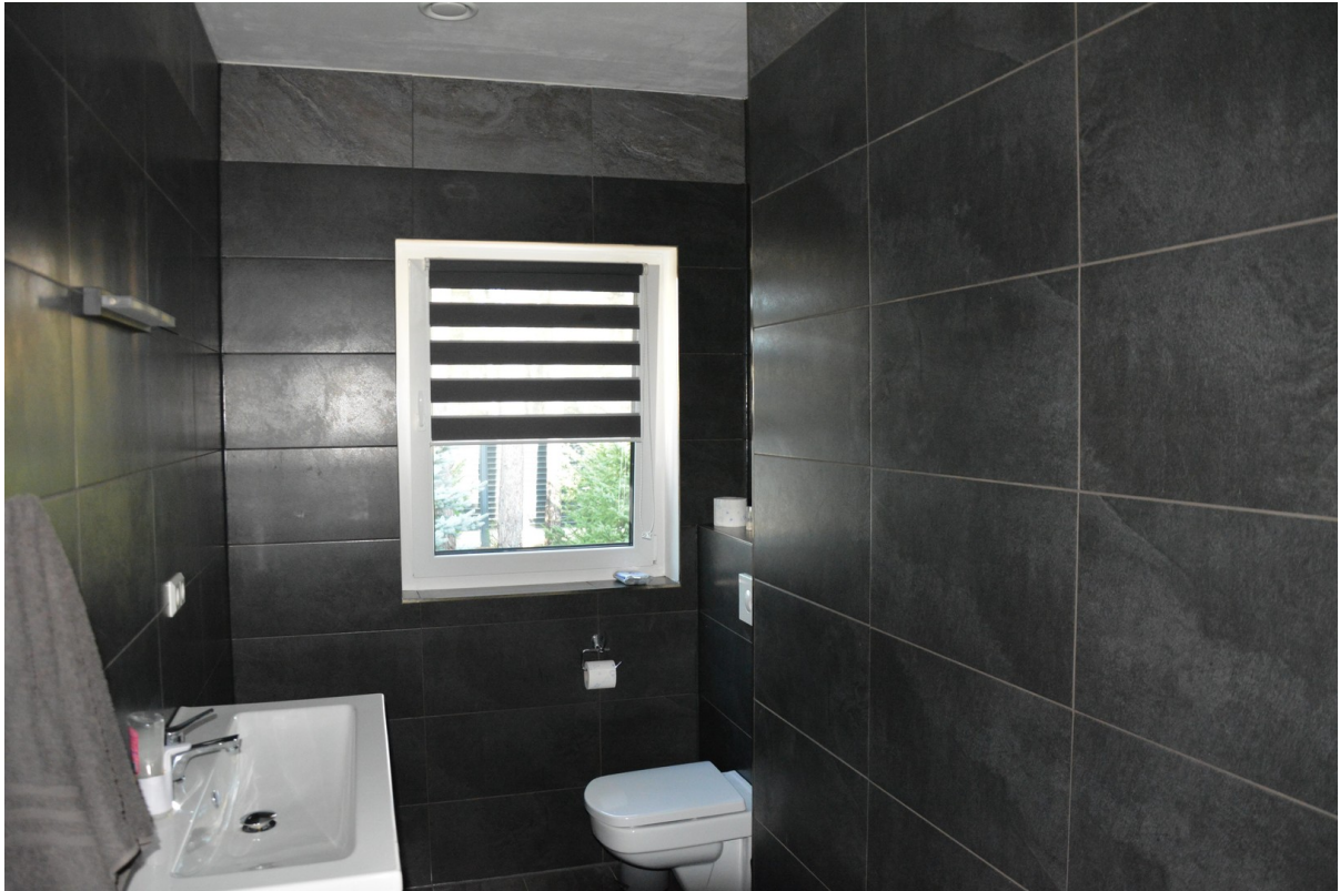
Haus links Gästebad