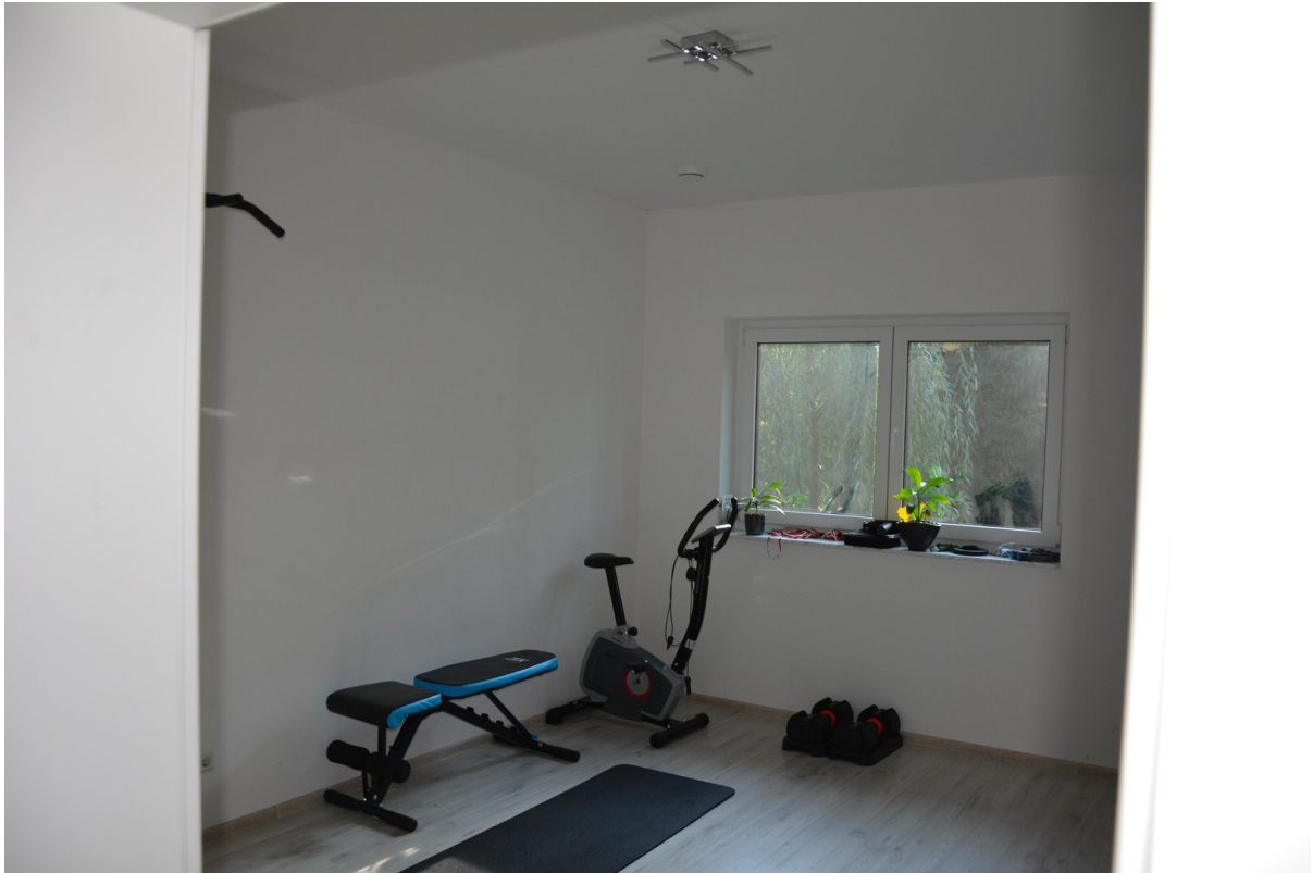
Haus links EG