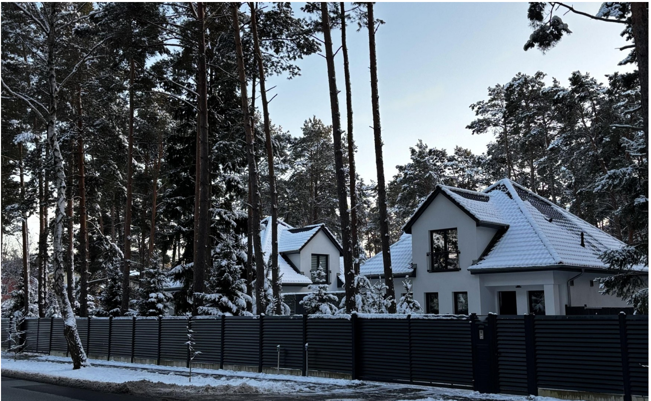
Blick auf beide Häuser