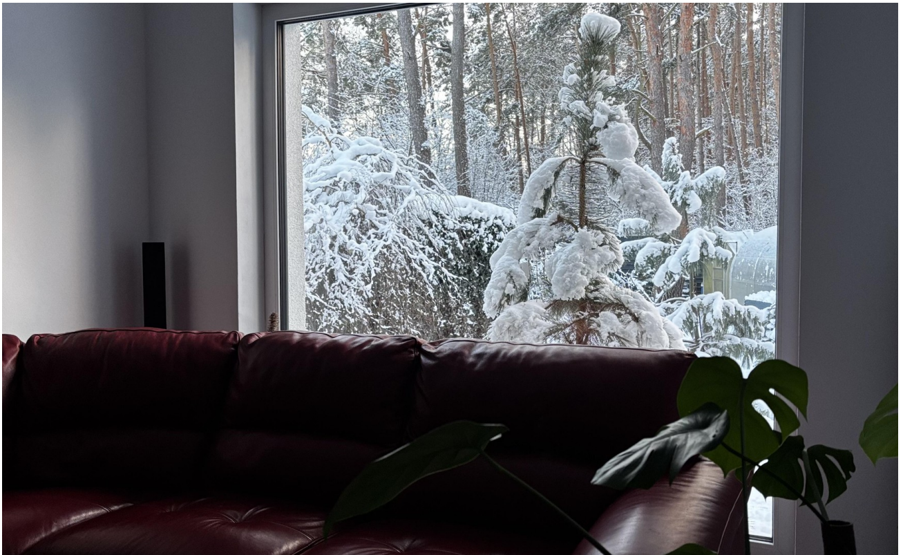
Haus rechts Wohnzimmer