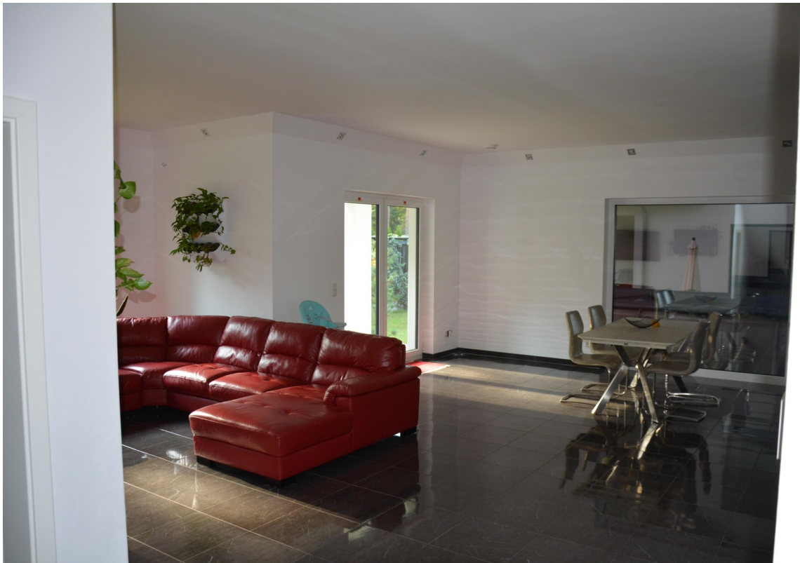
Haus links Wohnzimmer