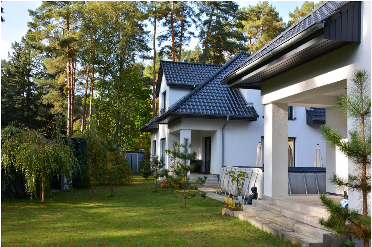
Blick von Haus links zu rechts