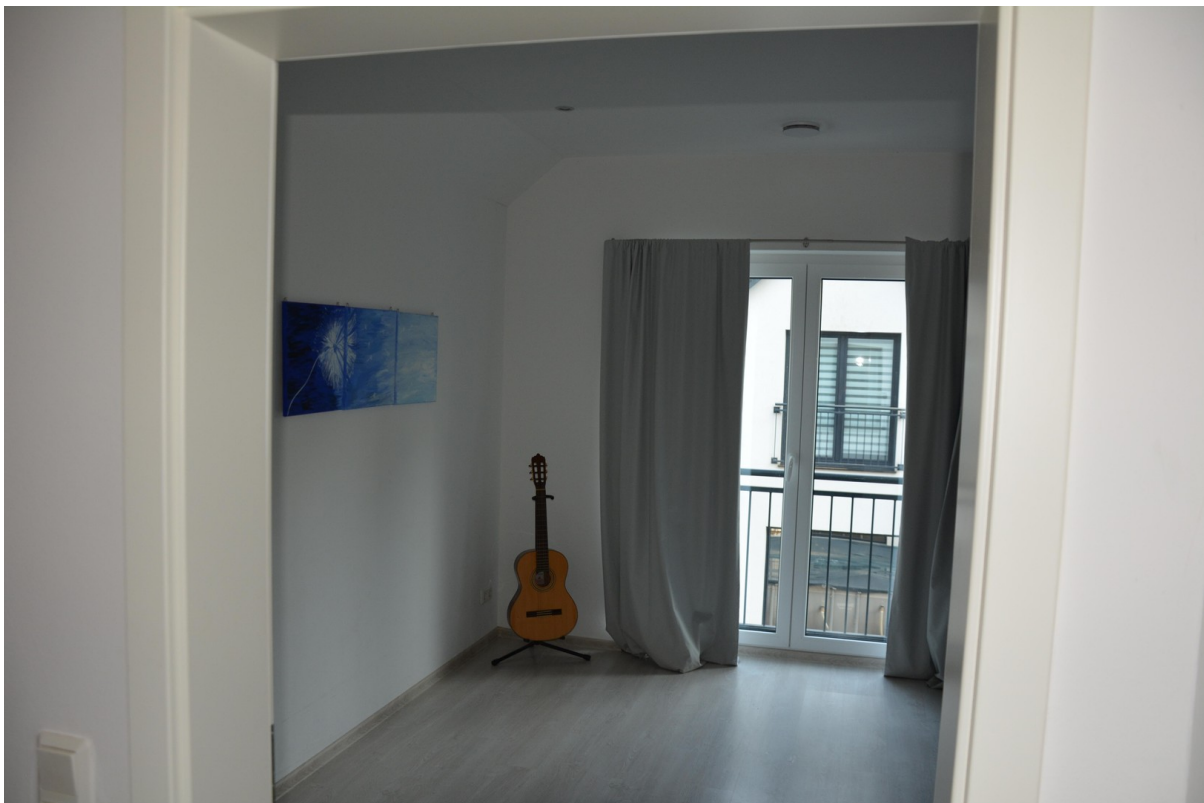
Haus rechts OG