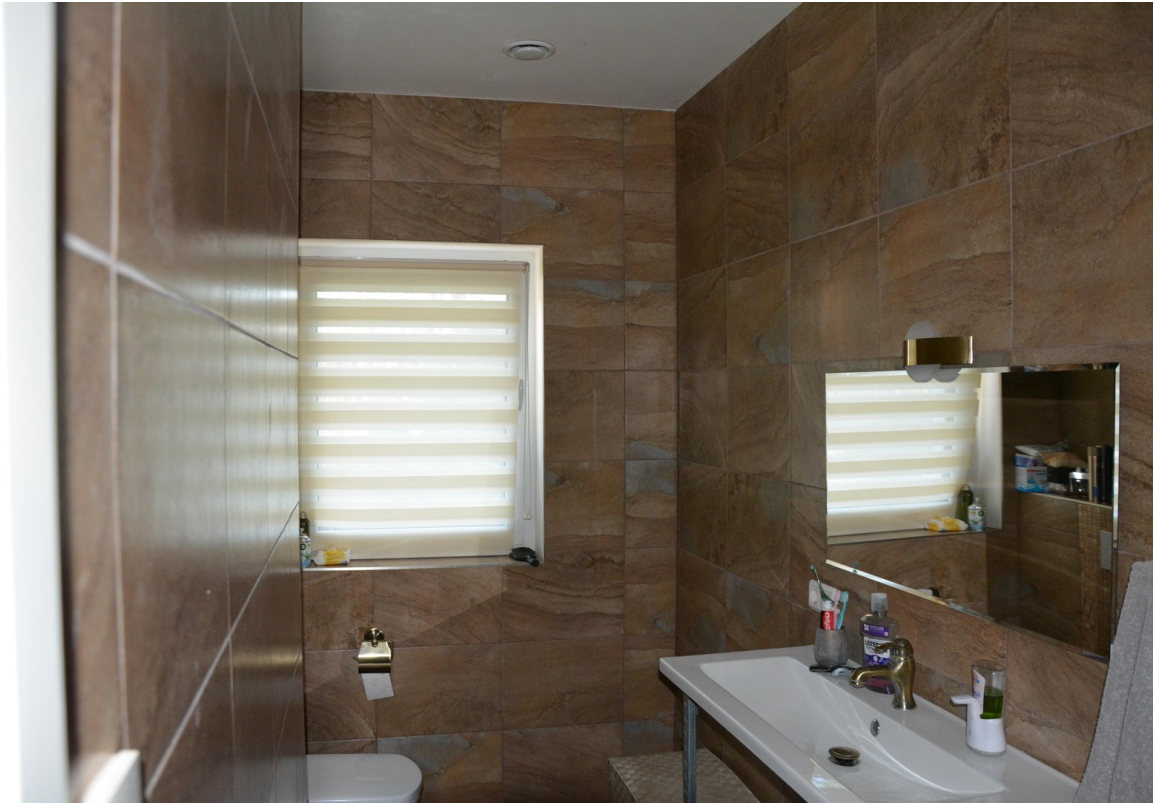
Haus rechts Gästebad