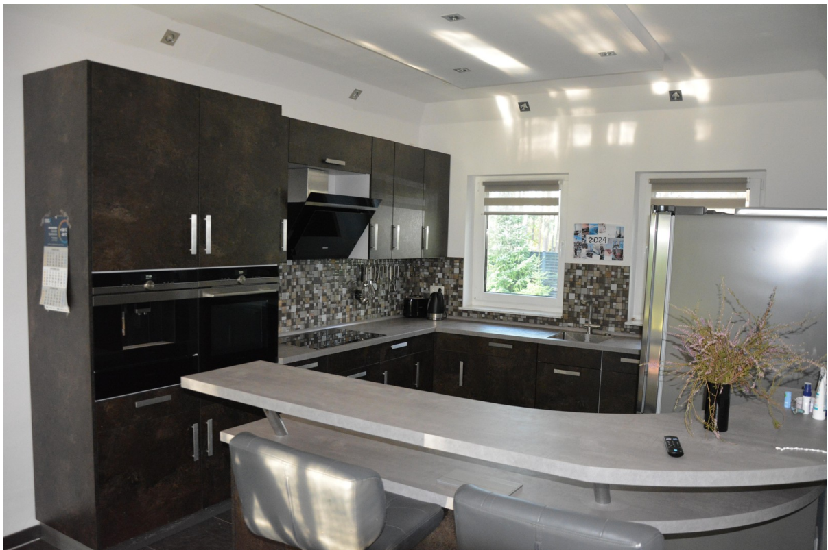
Haus links Küche