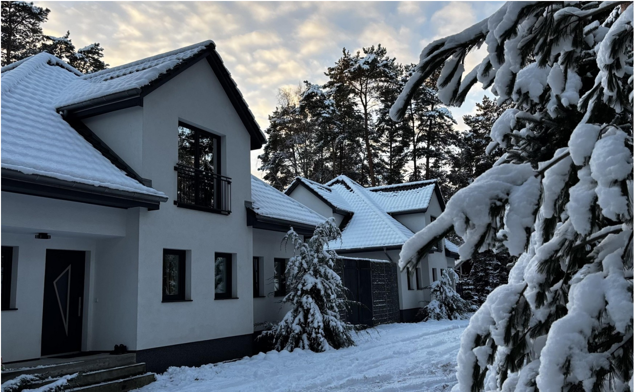
Blick Haus links zu rechts