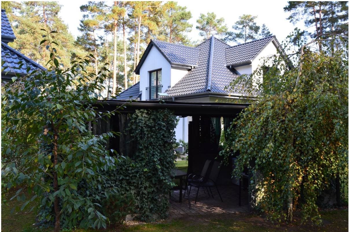
Haus links hinten