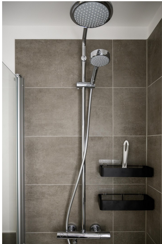
Badezimmer - #3