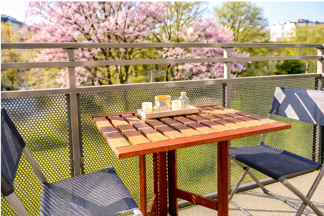
Balkon - #1