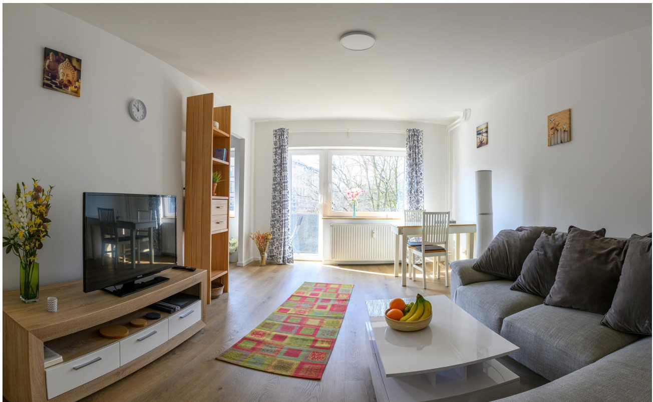
Wohnzimmer - #2