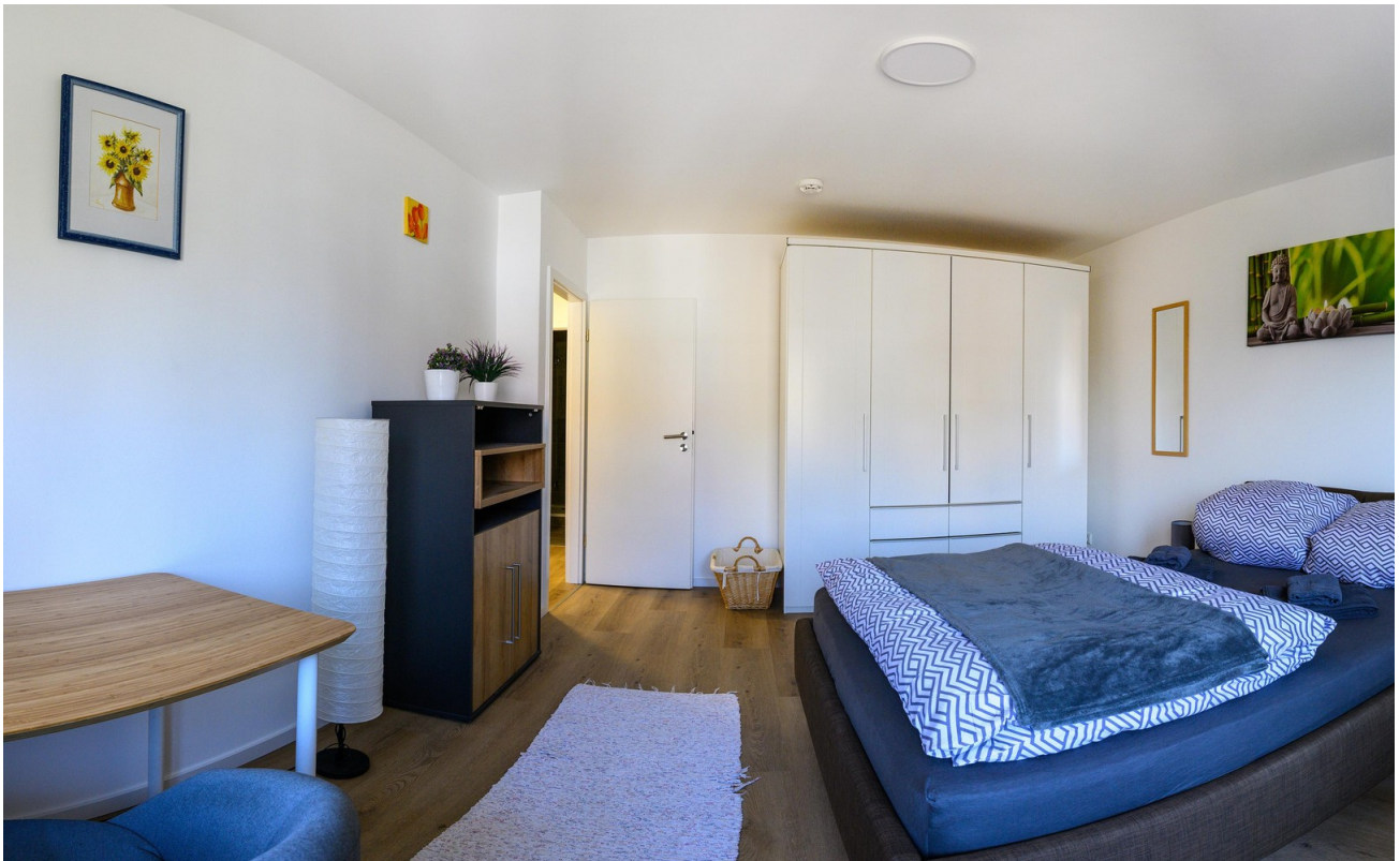
Schlafzimmer - #2