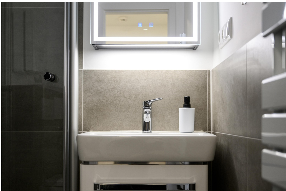
Badezimmer - #2