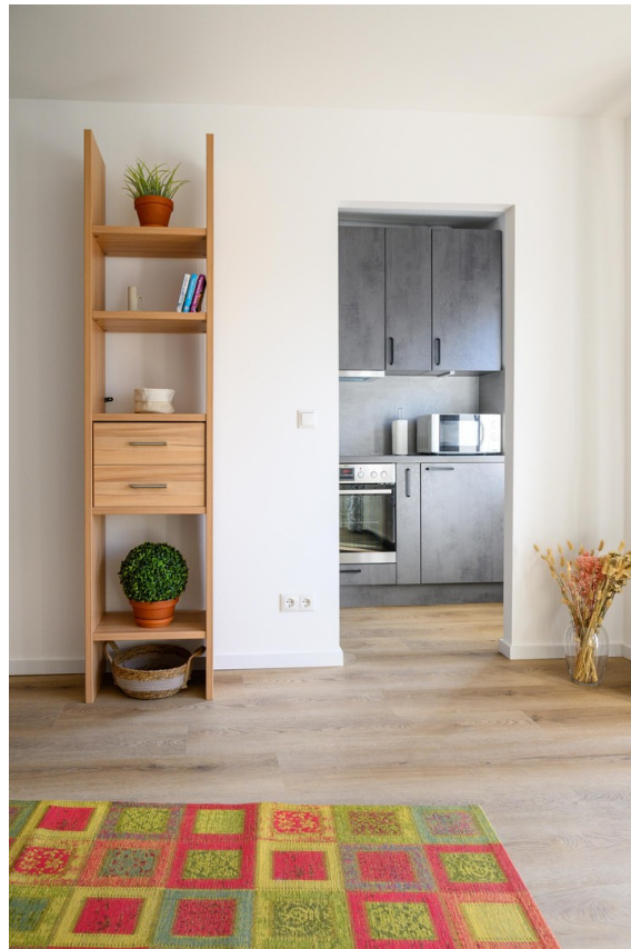
Wohnzimmer - #5