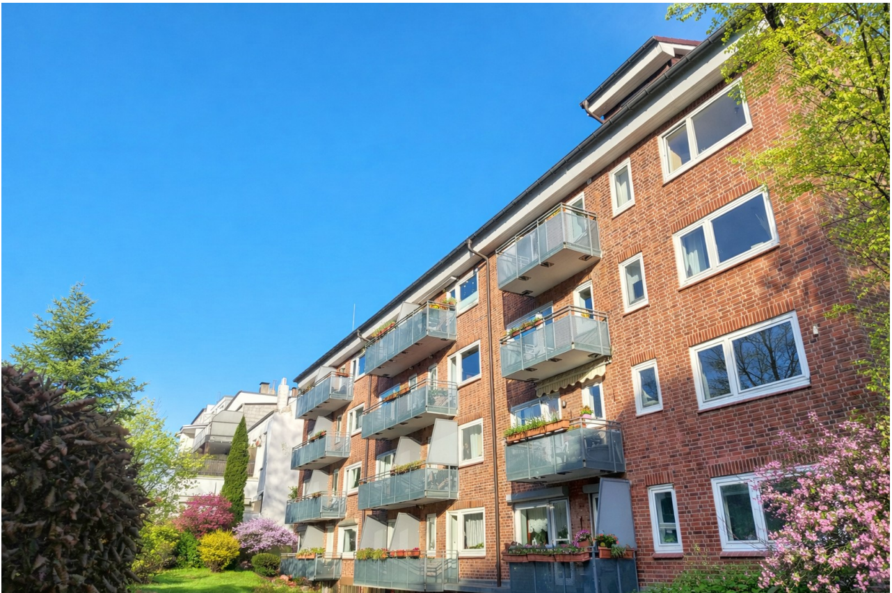
Außenansicht - #2