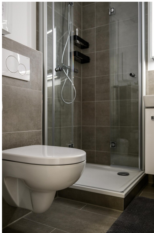
Badezimmer - #4