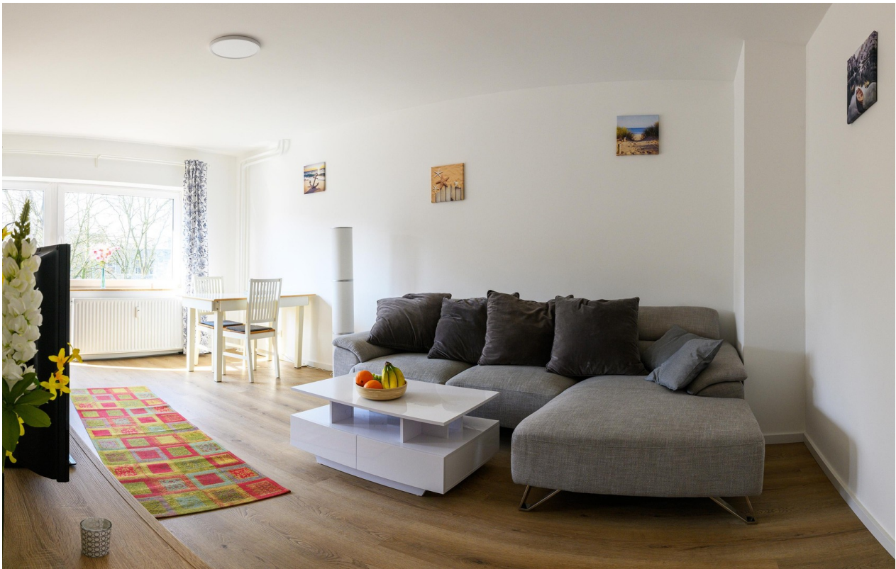
Wohnzimmer - #1