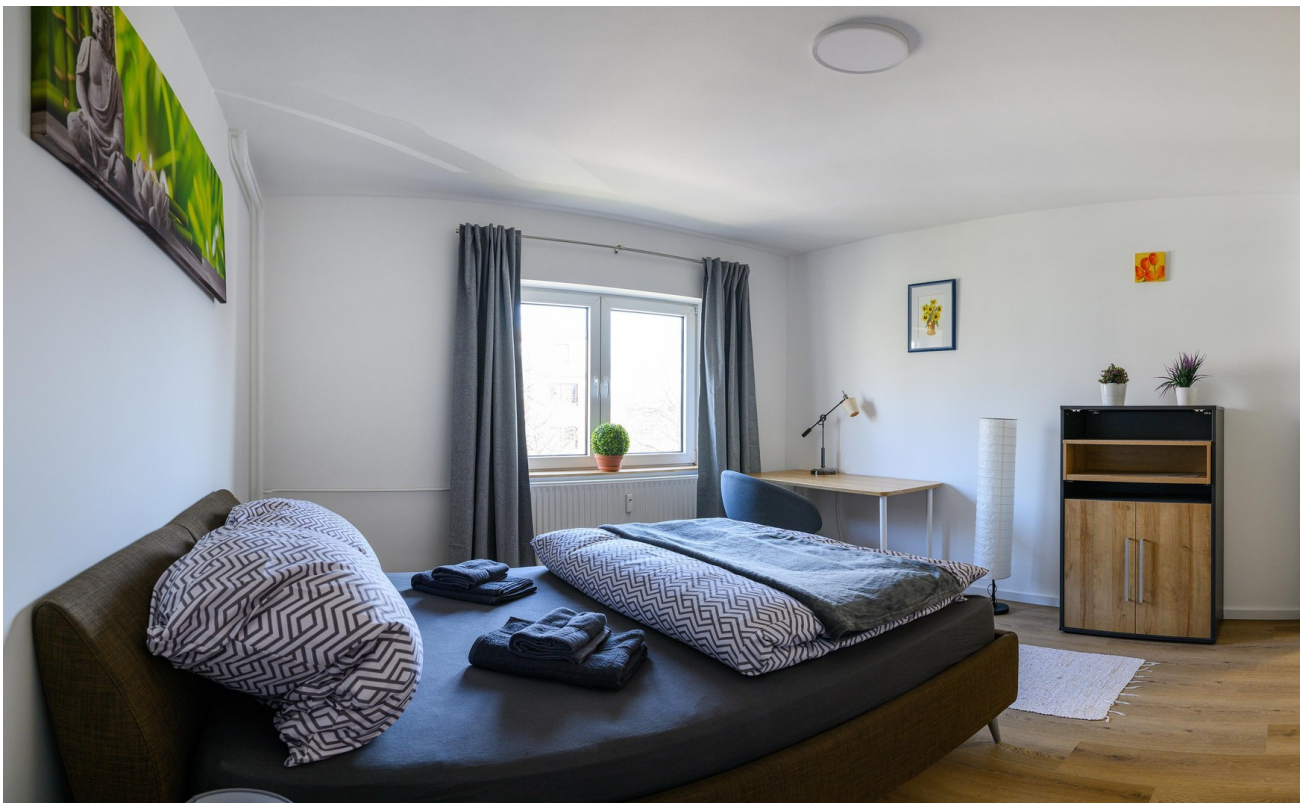
Schlafzimmer - #3