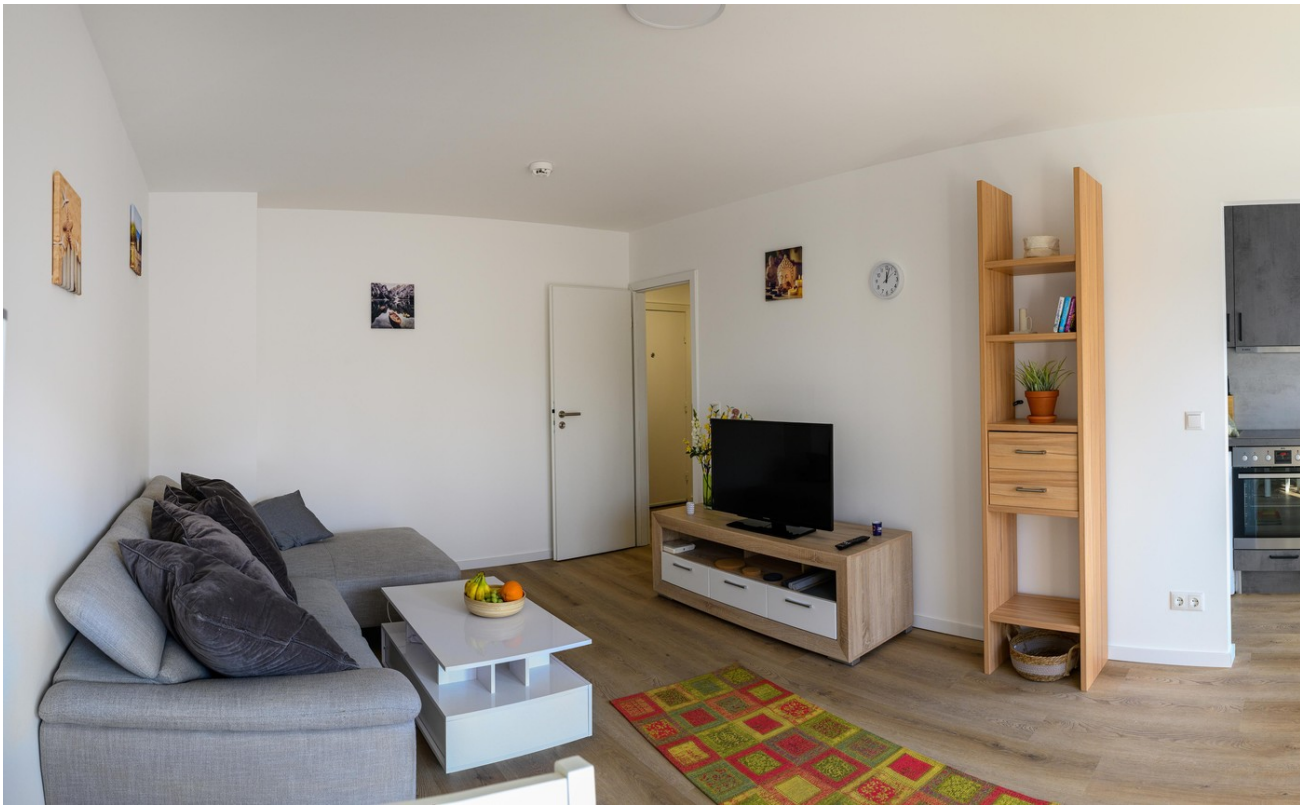
Wohnzimmer - #3