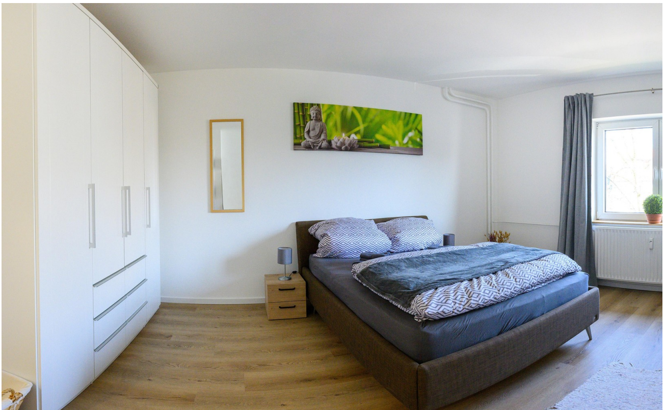
Schlafzimmer - #1