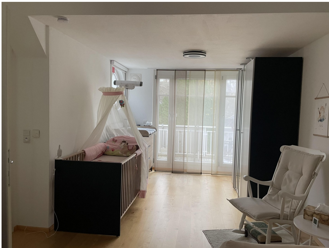
Zimmer im 1. OG