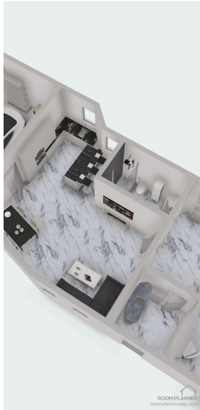
Wohn und Essbereich