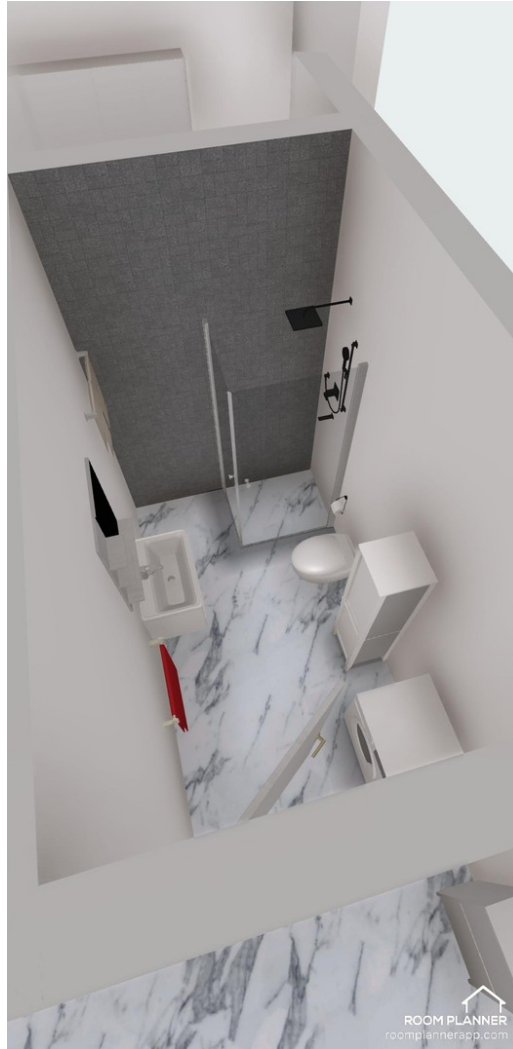
WC mit begehrbarer Dusche