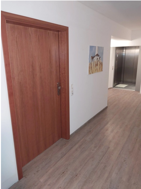
Flur mit Aufzug