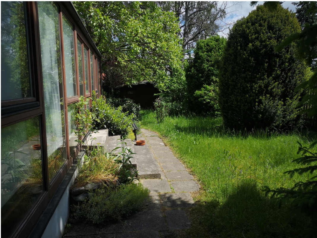
Garten im Süden