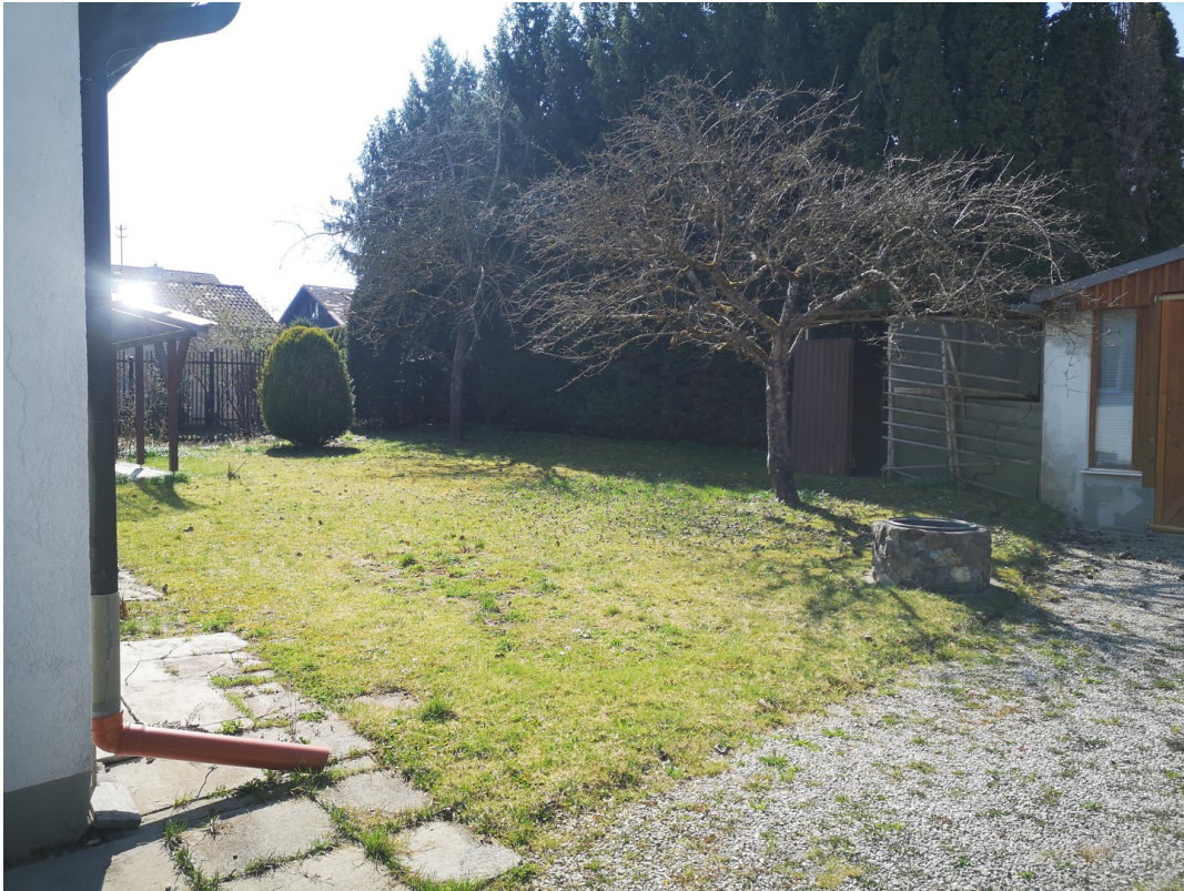
Garten im Westen