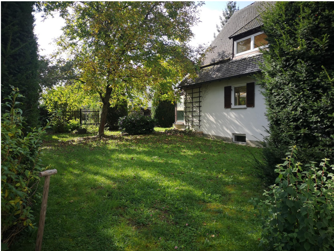
Garten im Osten