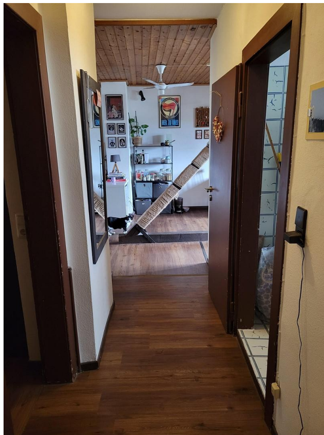
Flur Blickrichtung Wohnküche