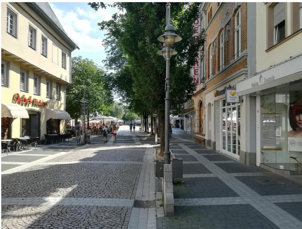
Blick zur Innenstadt