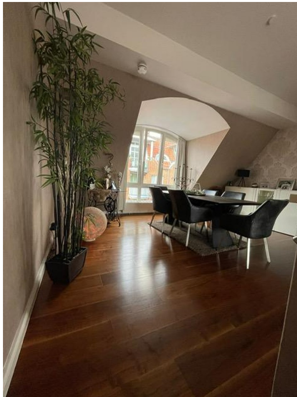
Wohnzimmer - Nordseite