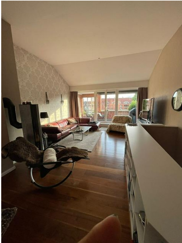
Wohnzimmer - Südseite