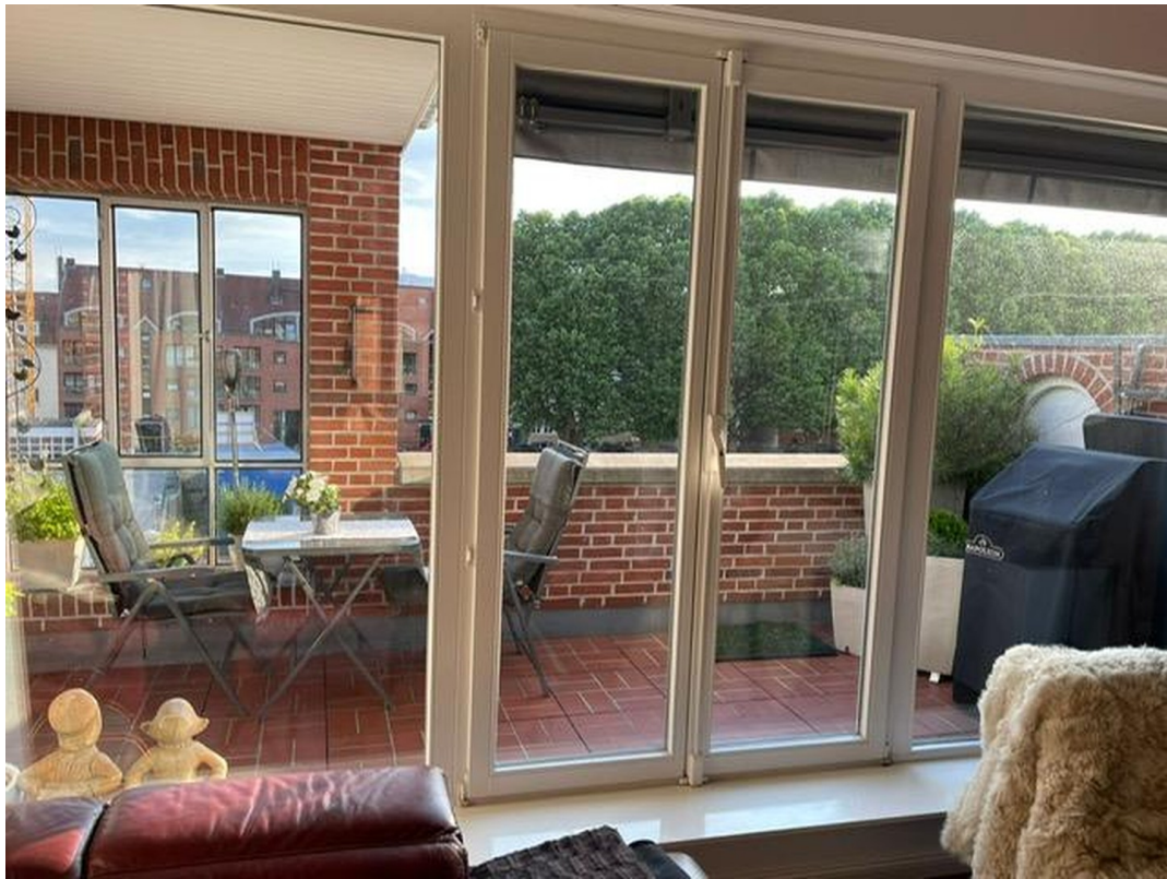
Balkon - teilüberdacht