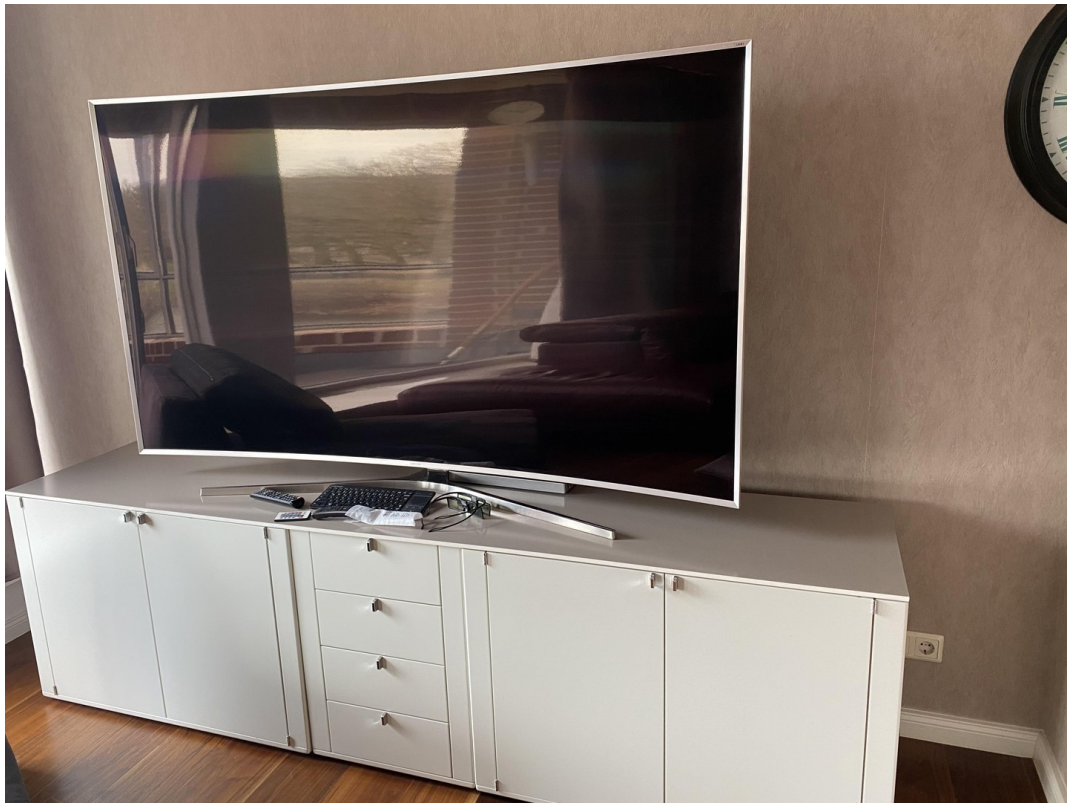
3D Curved TV