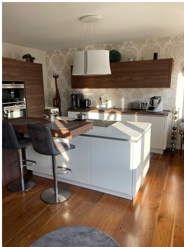
Küche - Insel