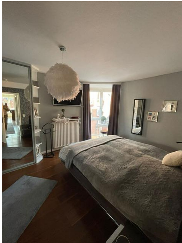
Schlafzimmer - Nord