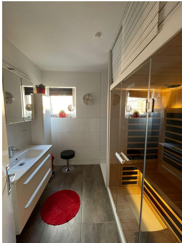
Bad mit Sauna