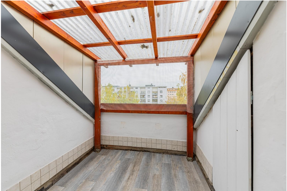
Balkon / Loggia