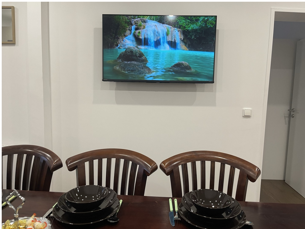
Essbereich mit Smart TV