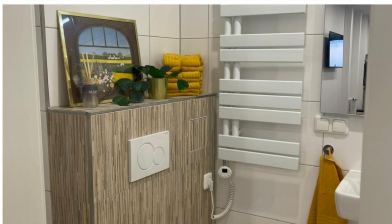
2. Duschbad, Handtuchheizkörper