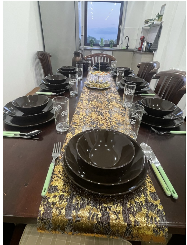
großer Esstisch, Geschirr