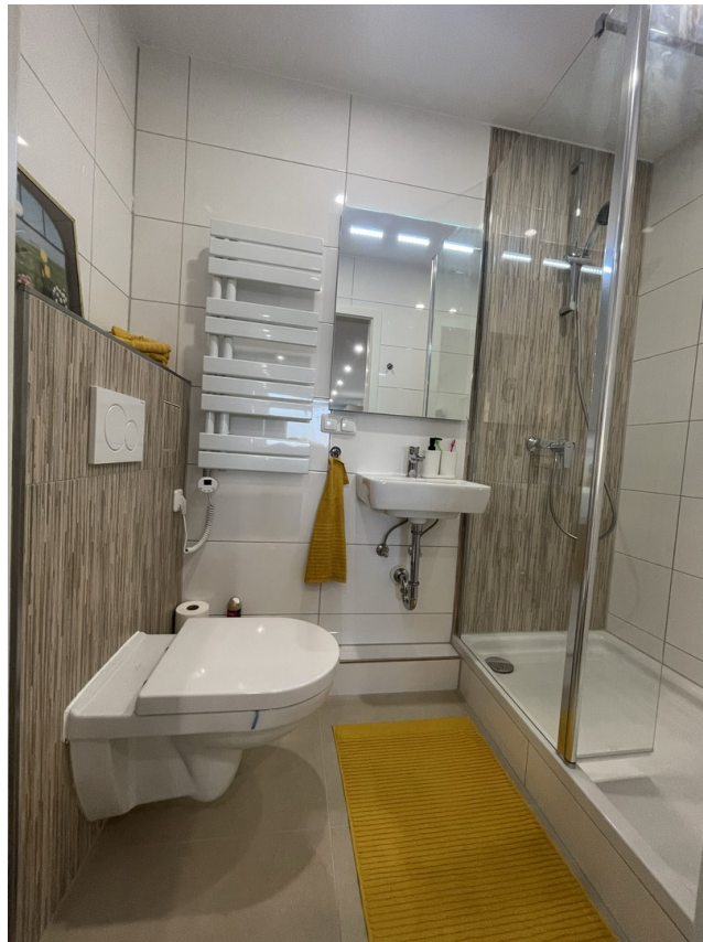
2. Duschbad, Handtuchheizkörper