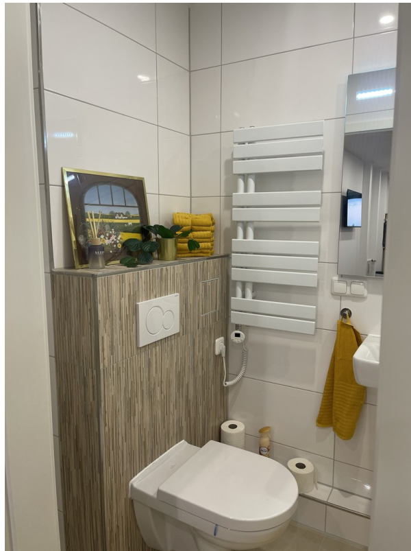
2. Duschbad, Handtuchheizkörper