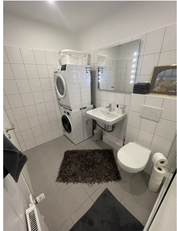
Bad mit Waschmaschine, Trockner