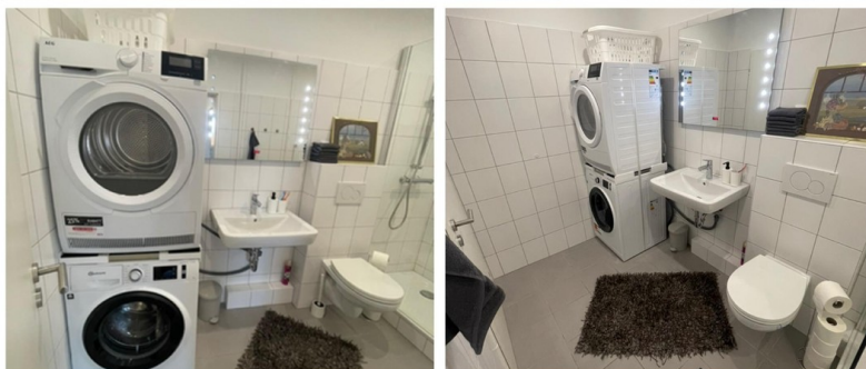
1. großes Duschbad