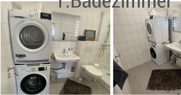
1. großes Duschbad