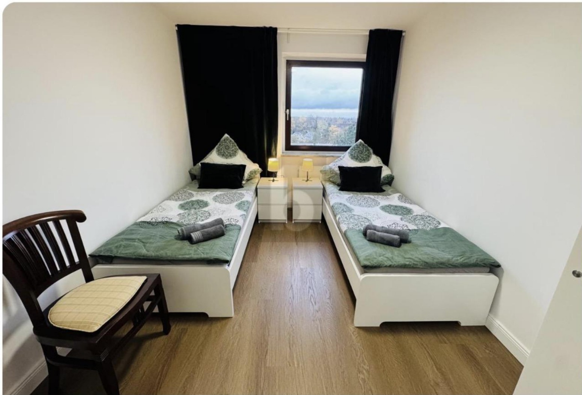
Traumhaft und kernsaniert!