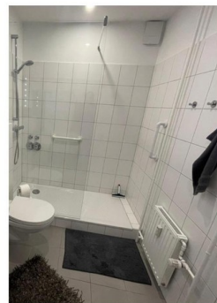
1. großes Duschbad