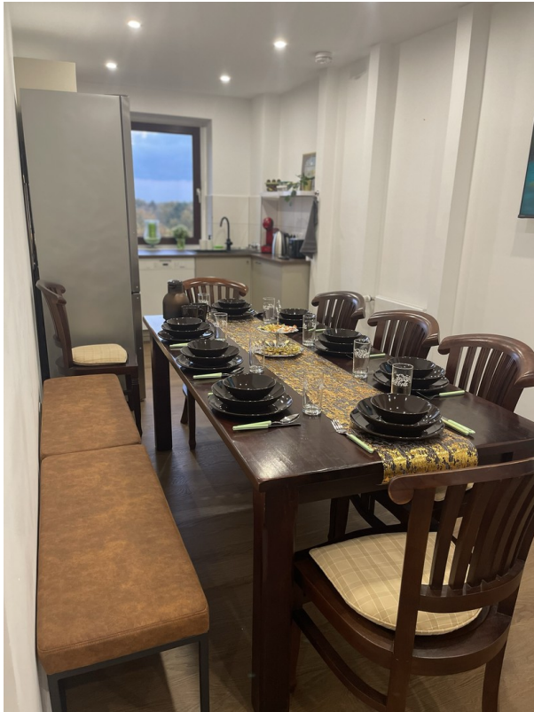
Großer Esstisch mit Sitzecke