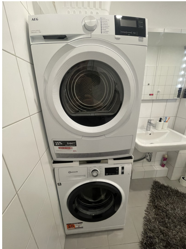
Waschmaschine und Trockner