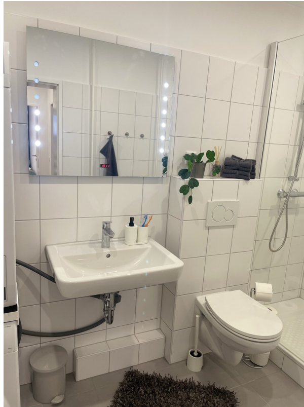
1. großes Duschbad