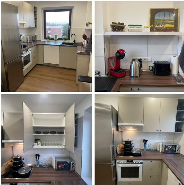
Kochutensilien und Geschirr