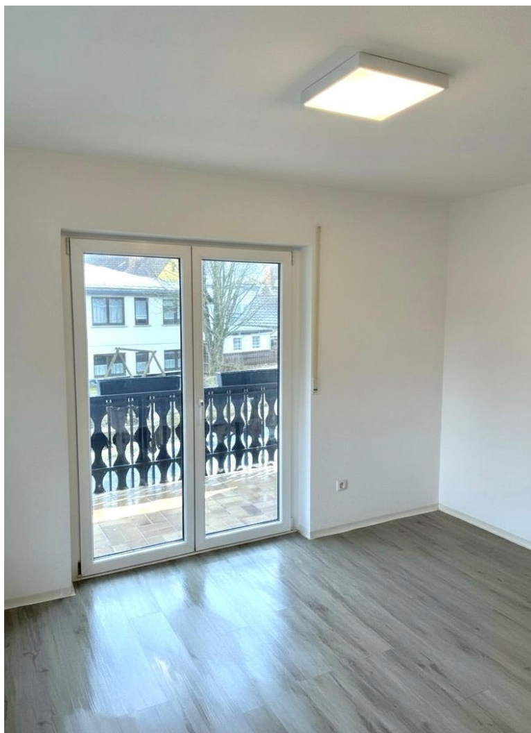
Zimmer mit Balkon