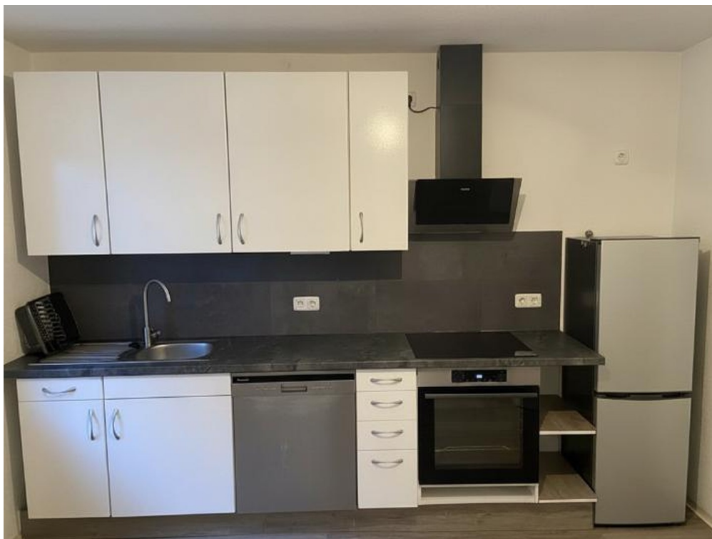
Küchenzeile mit Elektrogeräten