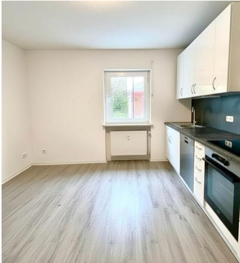
Wohnküche mit Küchenzeile