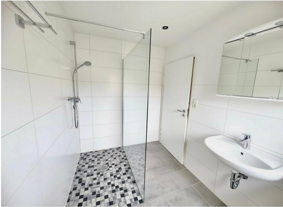
Modernes Bad mit Dusche