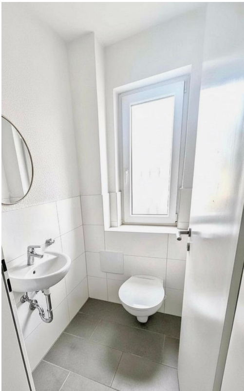
Separates WC mit Waschtisch