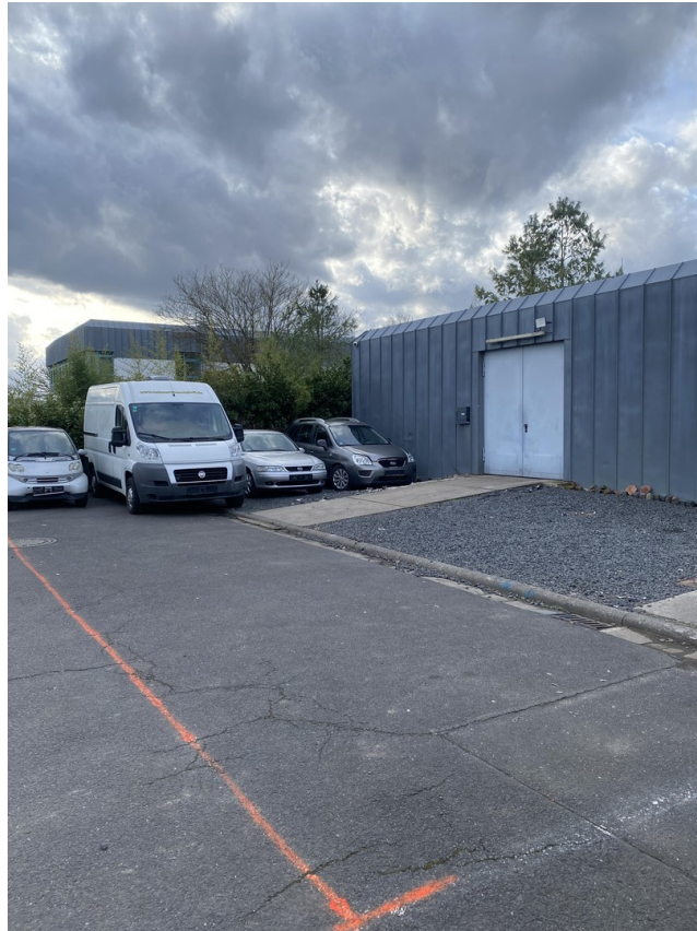
Ein Teil der Abstellplätze