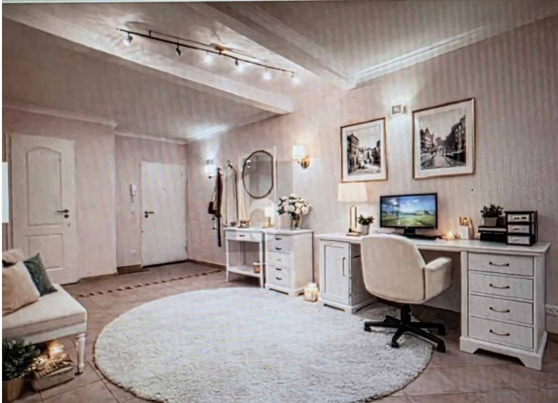
Büro - Eingangsdiele