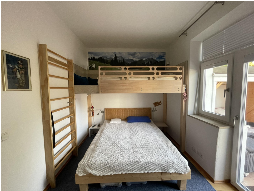
Gäste mit Podest