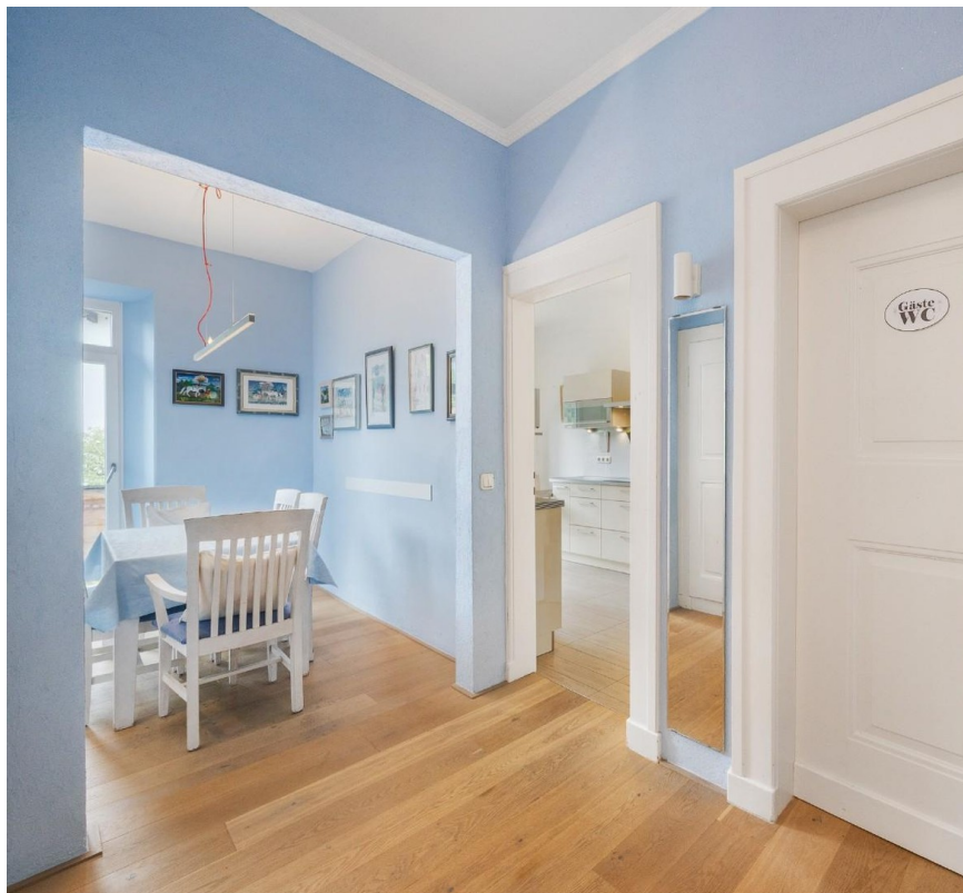
Flur zum Esszimmer - Küche