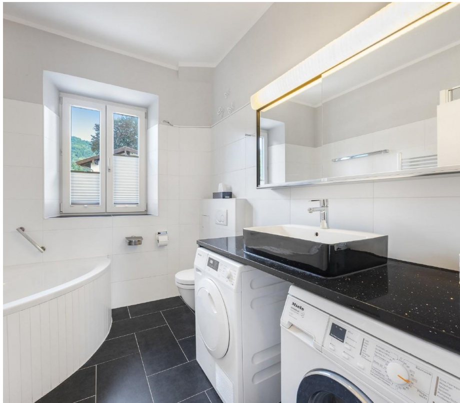
Bad Schlafen 2