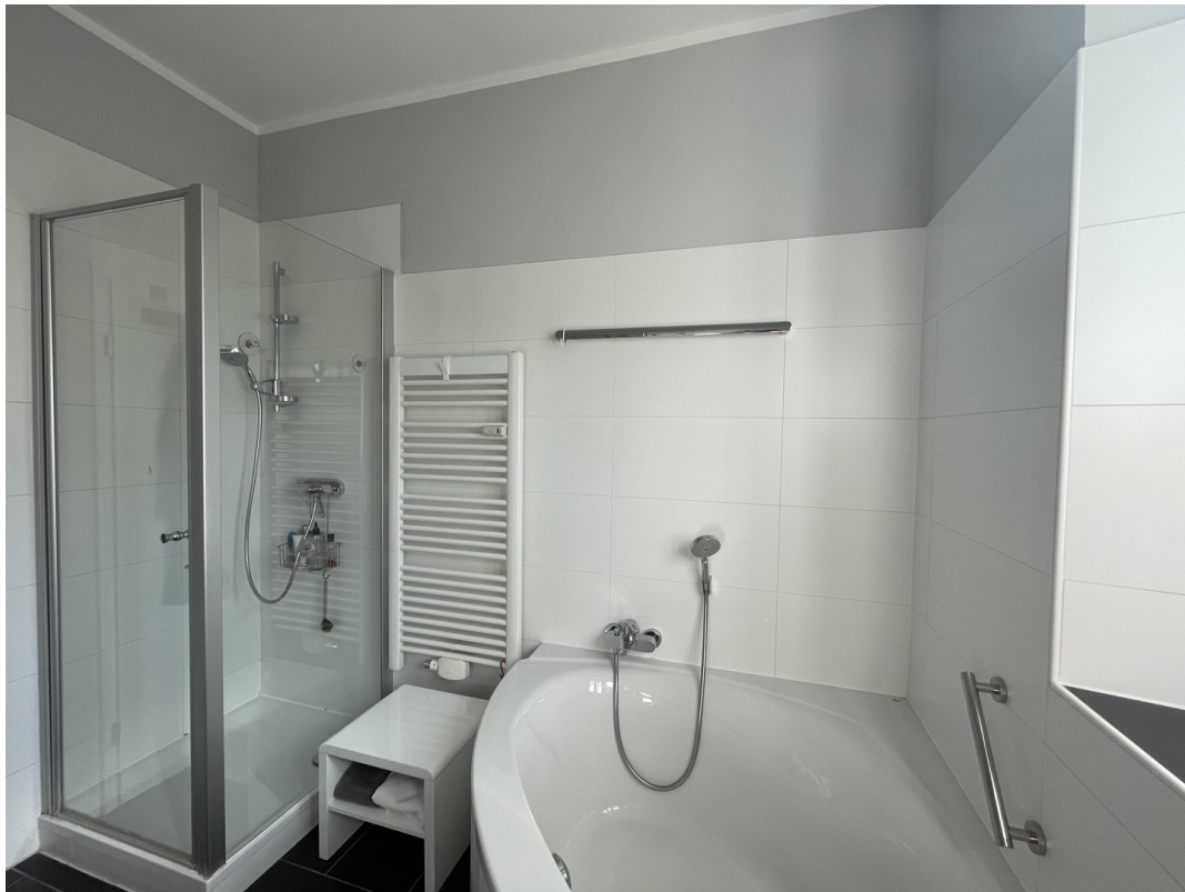
Bad mit Dusche