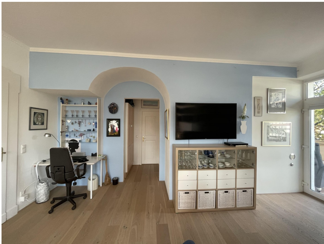
WZ Zugang Kind - Gästebad