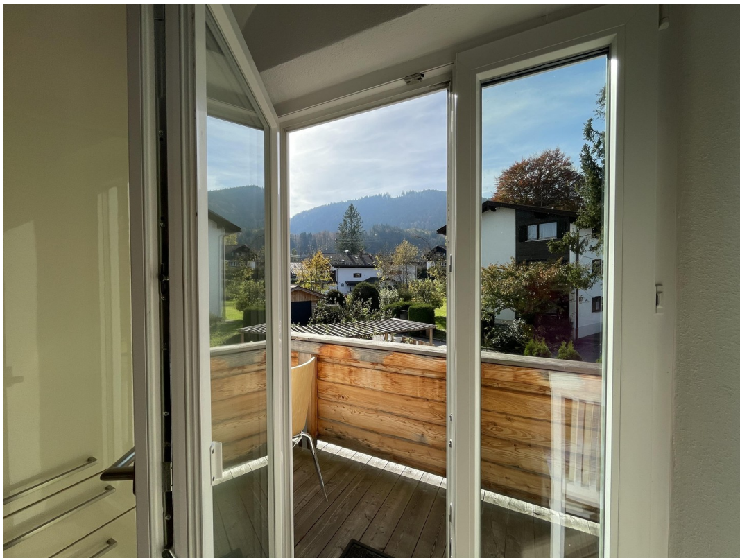
Bergblick Schlafen 2