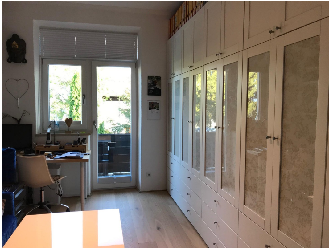
Büro - Schlafen 1