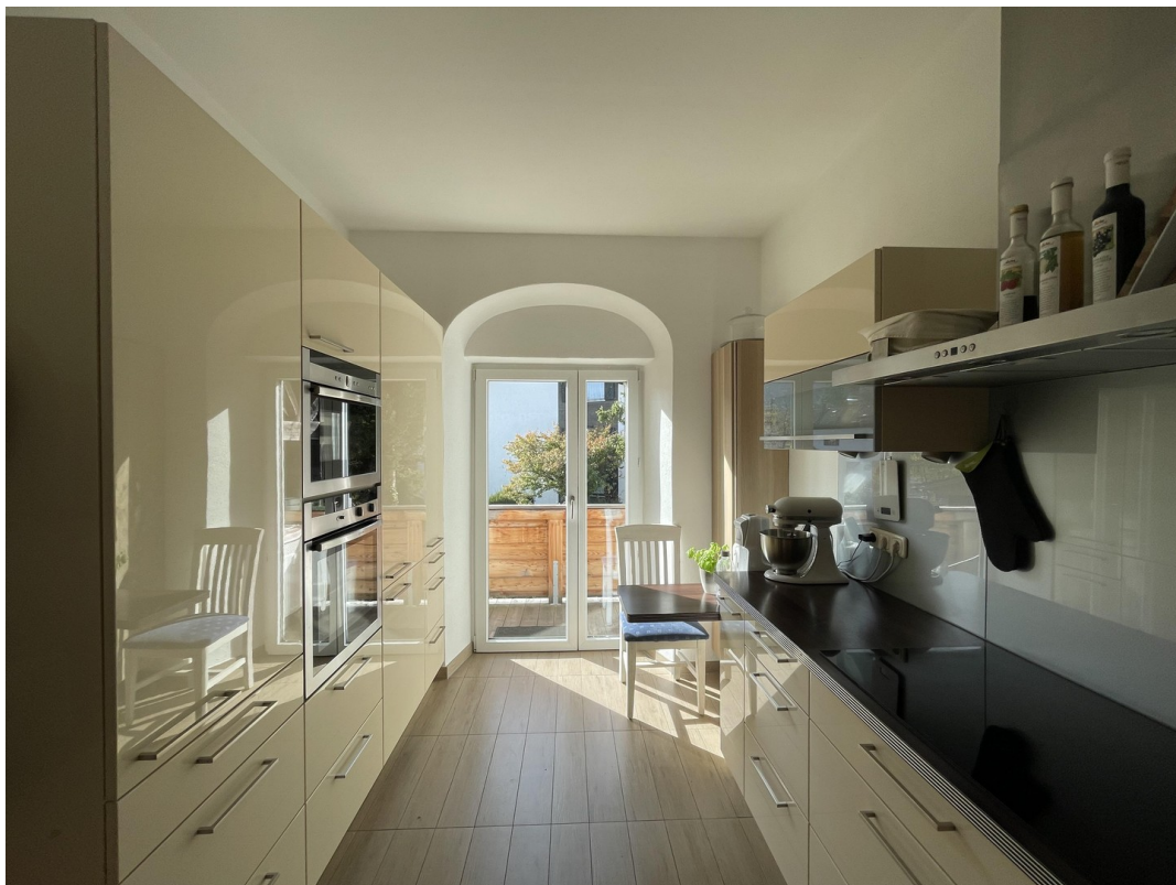
Küche mit Westbalkon