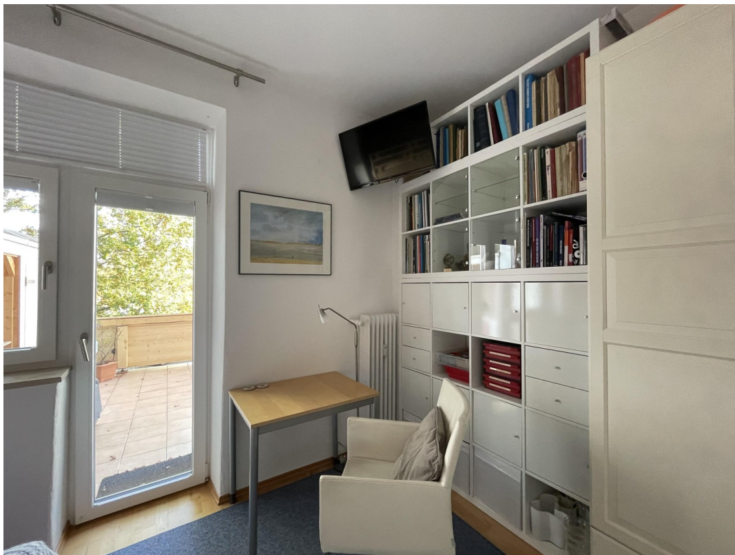
Gäste - Terrasse