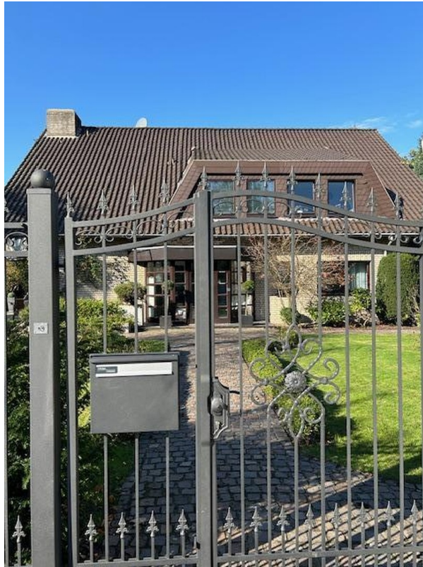
Gesamtansicht mit Haupteingang