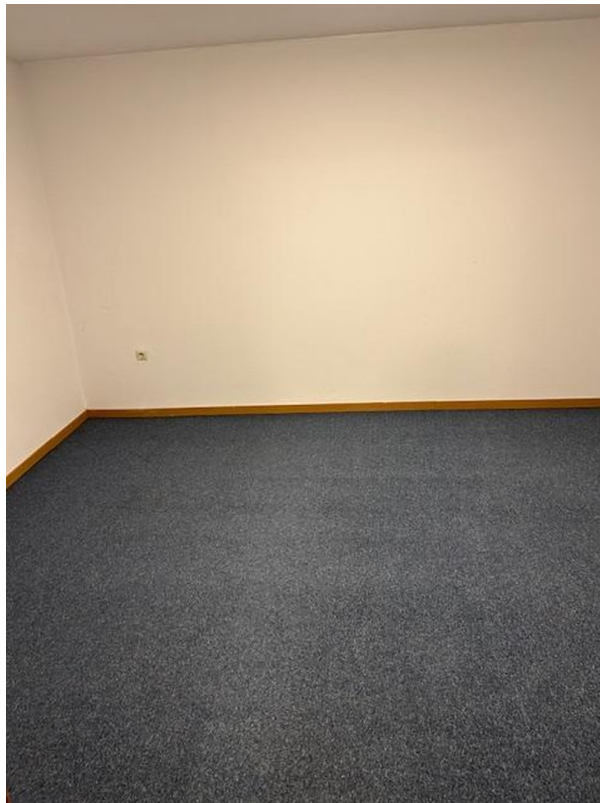
2 große trockene Kellerräume