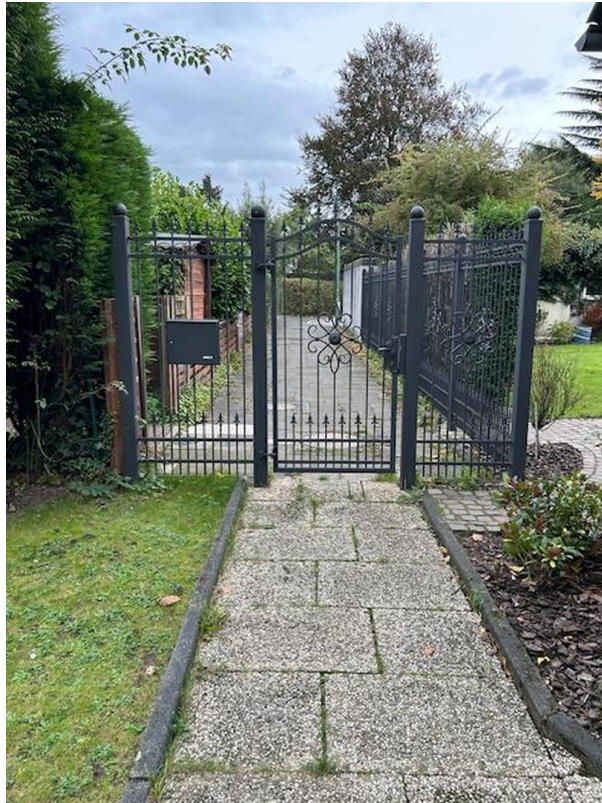
Extrazugang zur Einliegerwohng