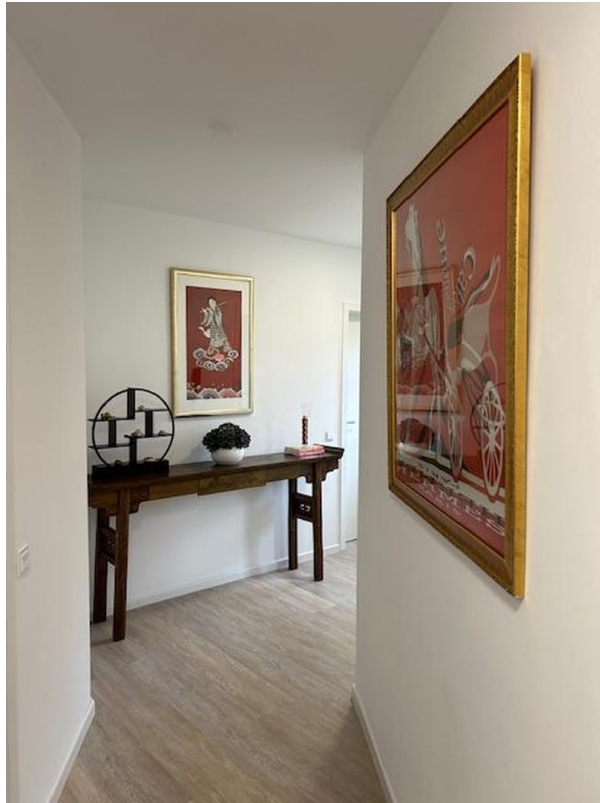
Diele 1. Etage