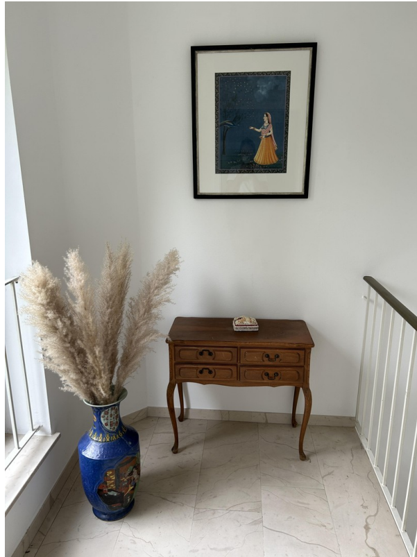
Podest nach Treppenaufgang