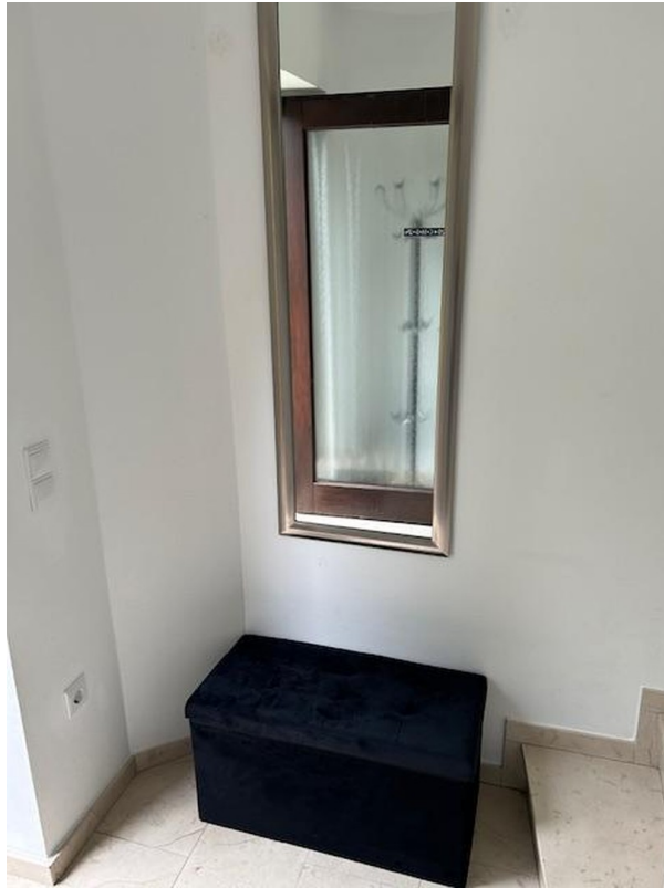
Sicht Eingangsbereich links