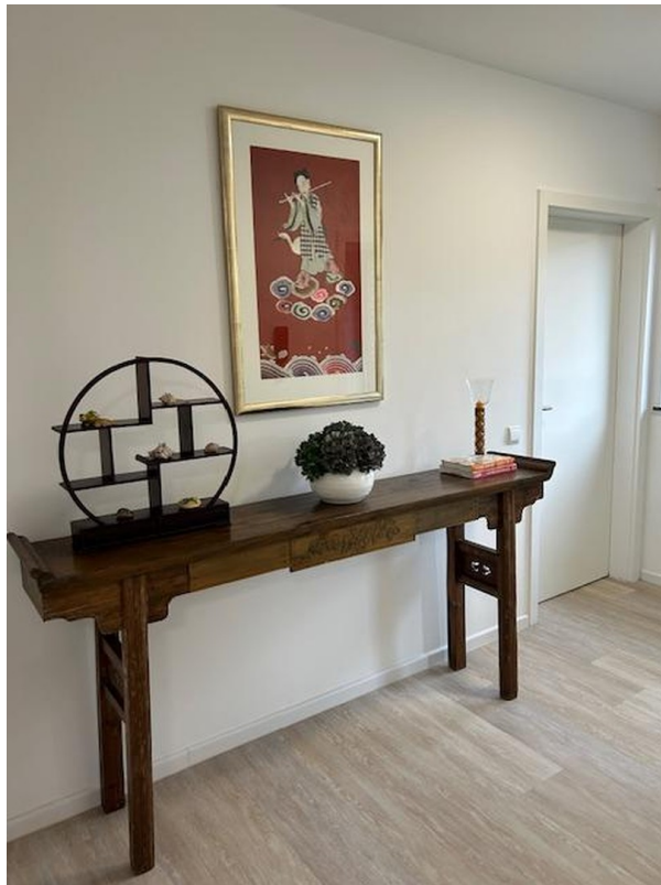
Diele 1. Etage