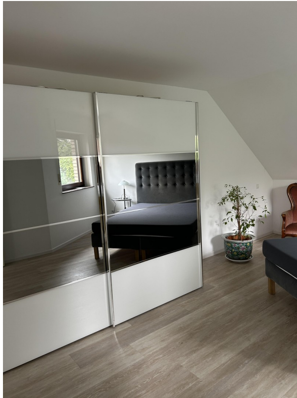
Schlafzimmer Ansicht 2