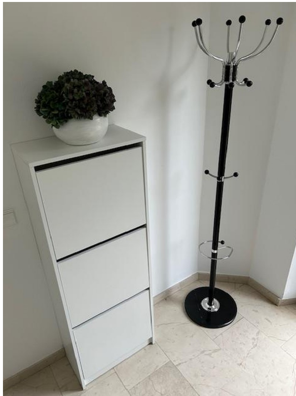
Sicht Eingangsbereich rechts