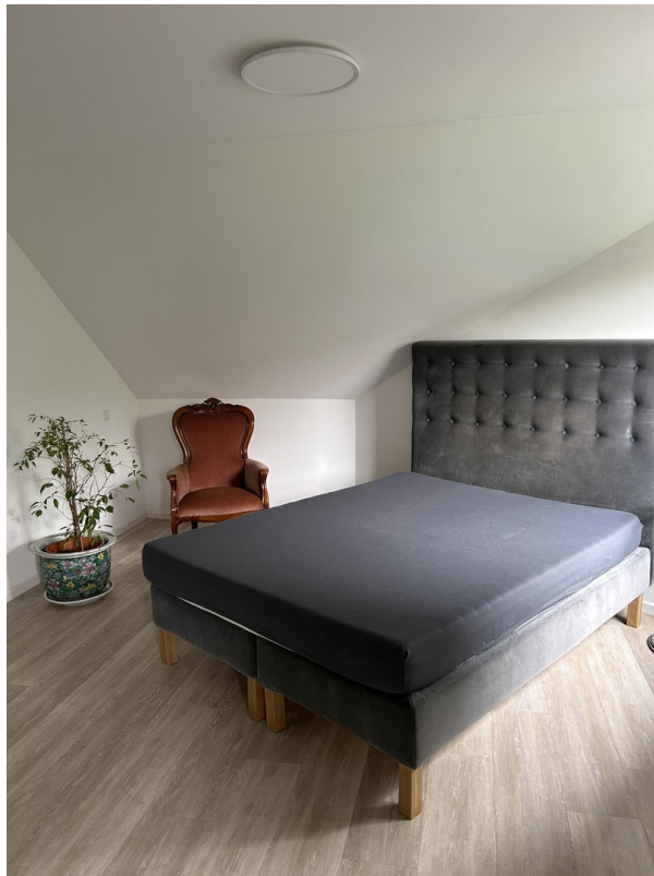
Schlafzimmer Ansicht 1