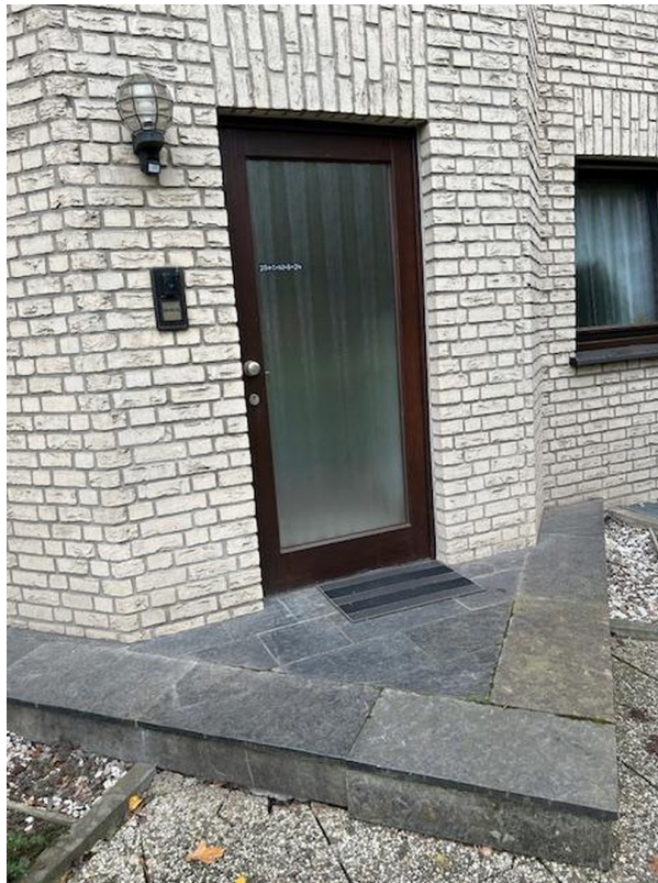
separater Eingang ins Haus