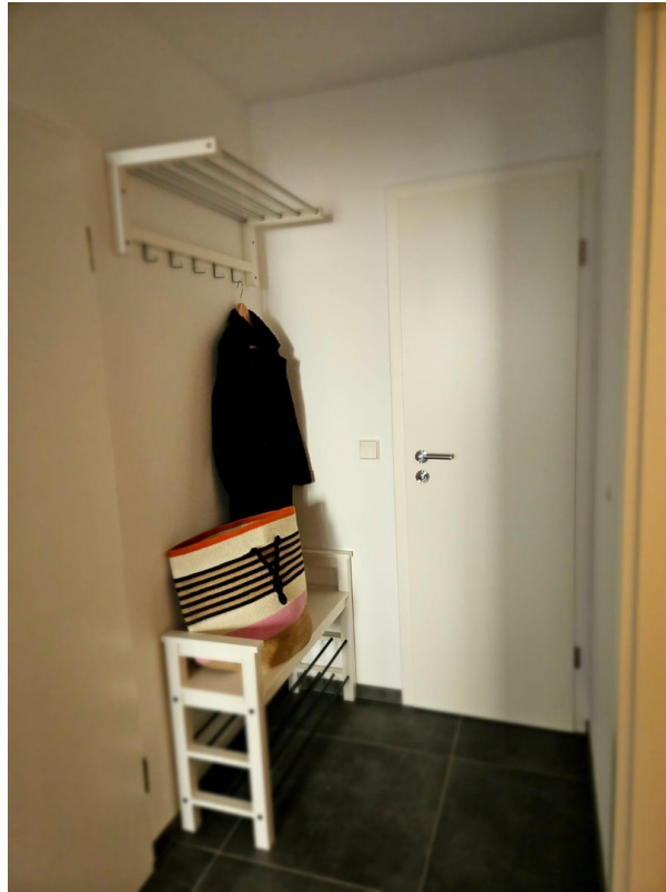
Garderobe / Flur