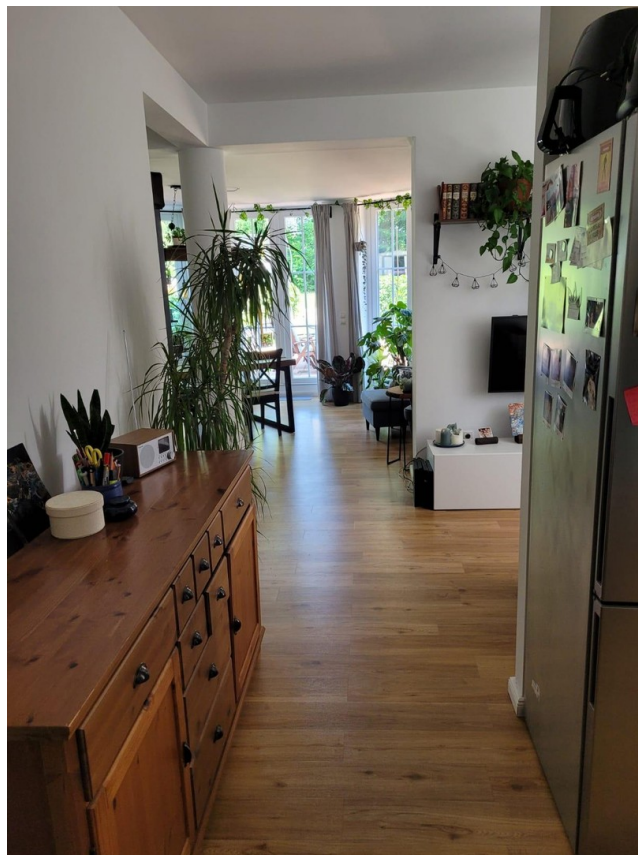
Blick - Küche und Wohnzimmer