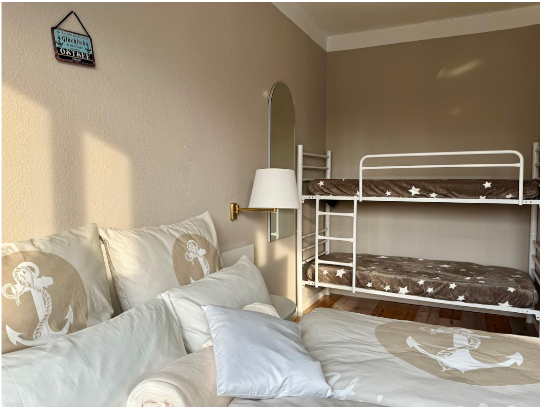
Etagenbett in 7 Zimmern