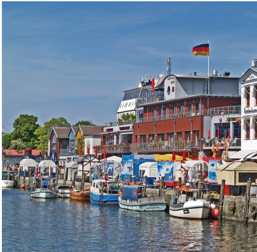
Warnemünde 20 Autominuten