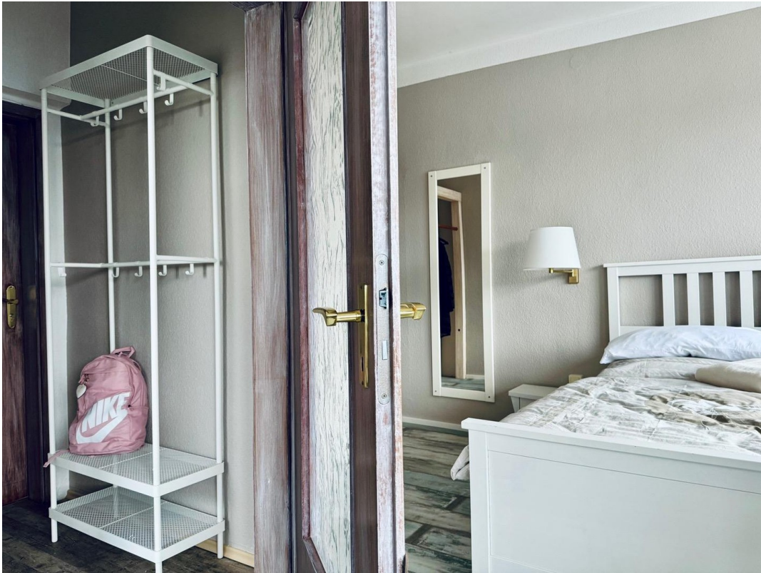
Zimmer mit Flur & Garderobe