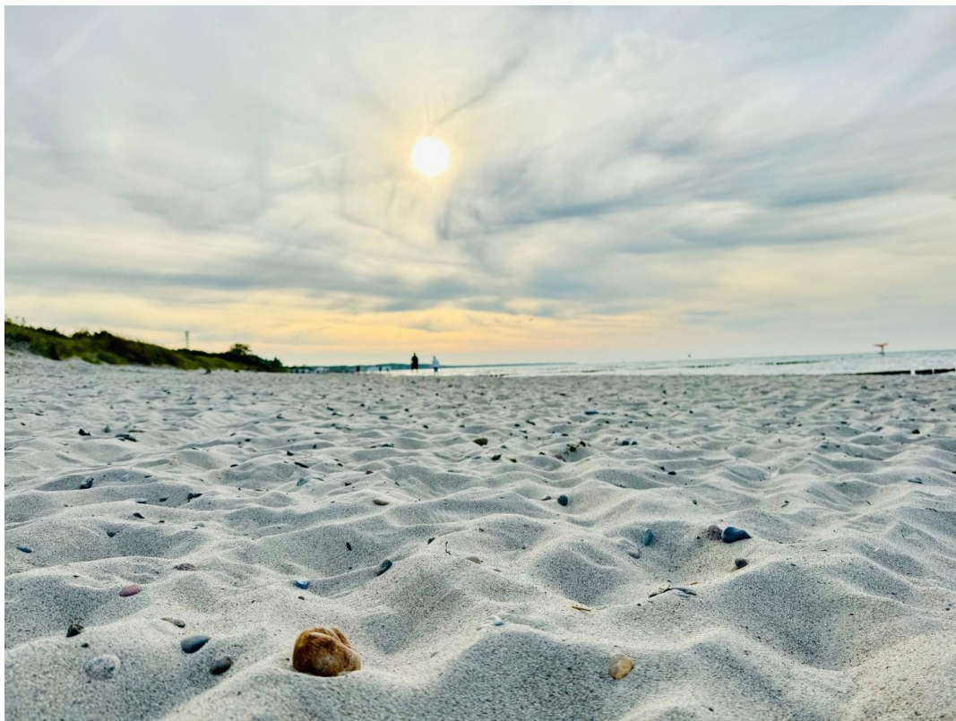
Strand Börgerende fußläufig