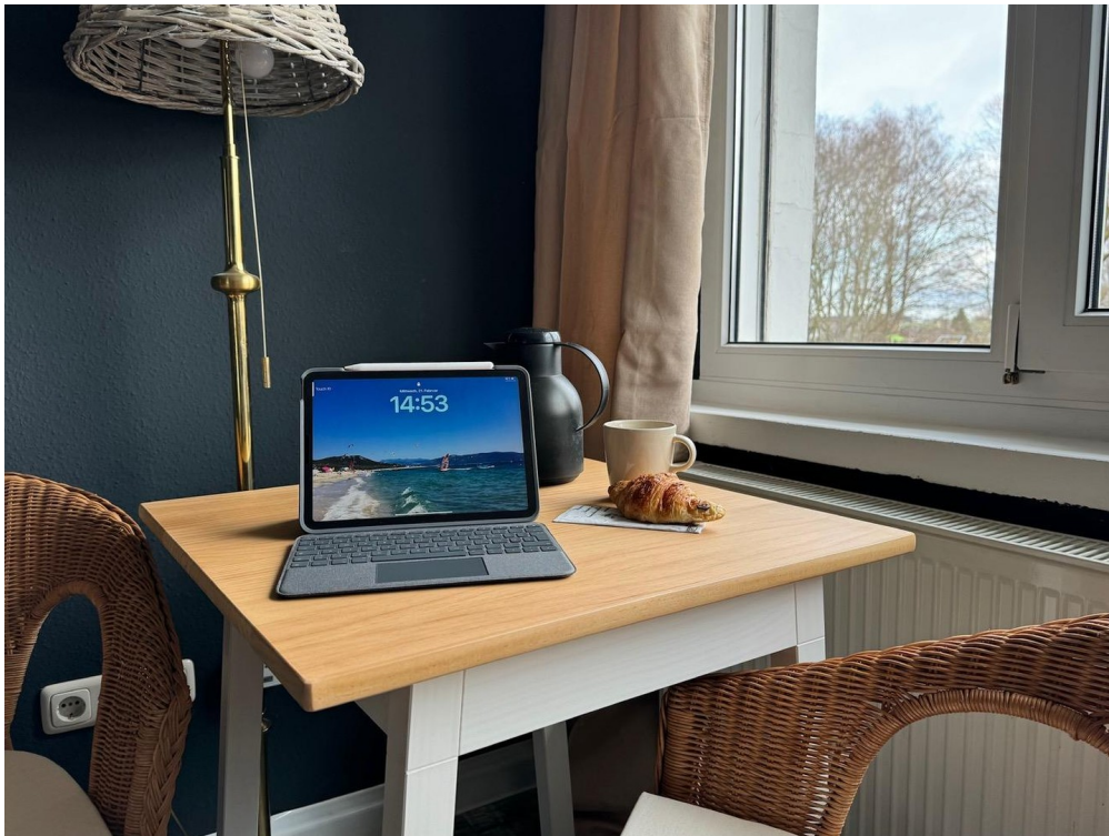
Tisch in jedem Zimmer