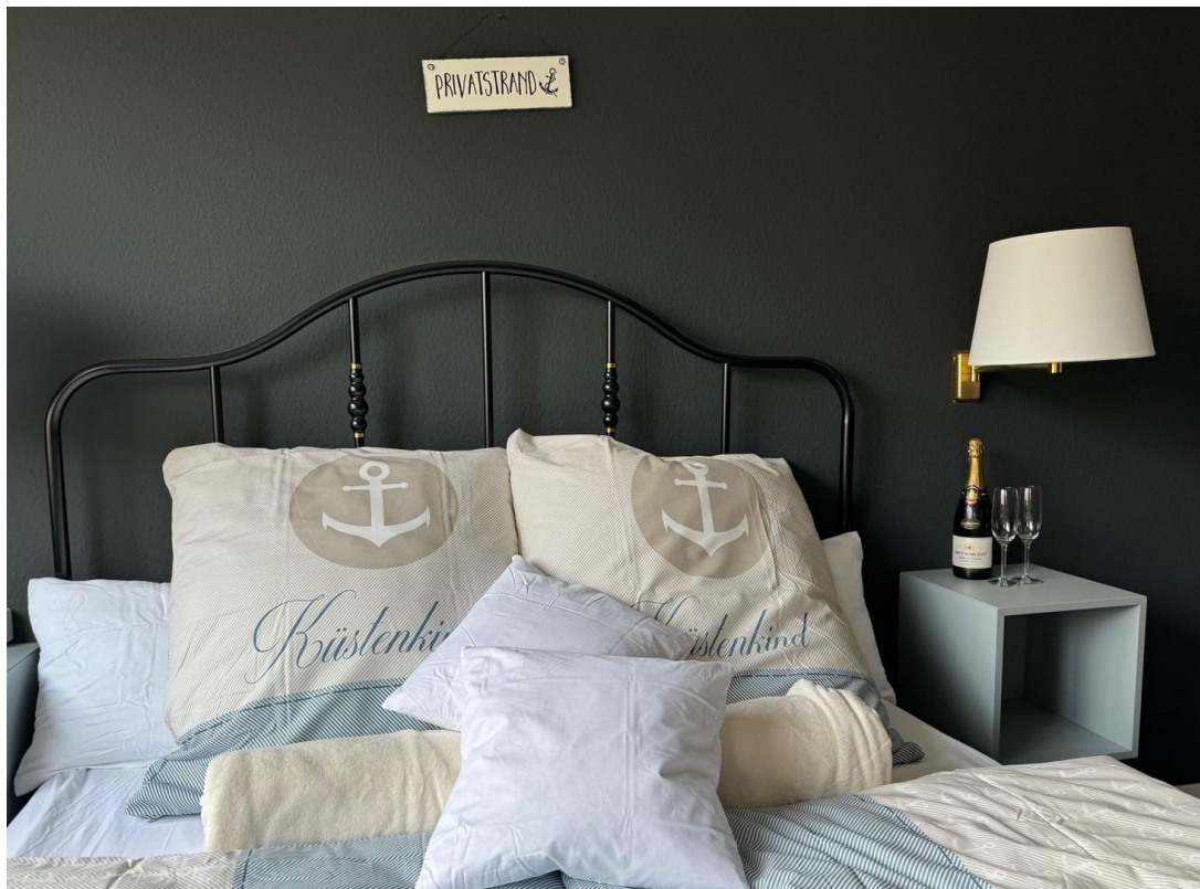
alle Zimmer hübsch renoviert