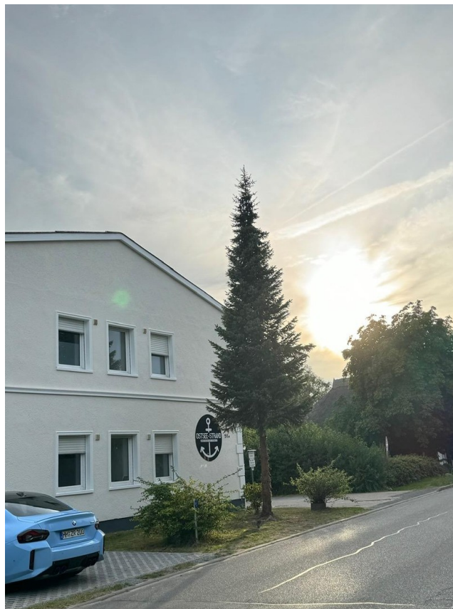
8 Parkplätze am Haus