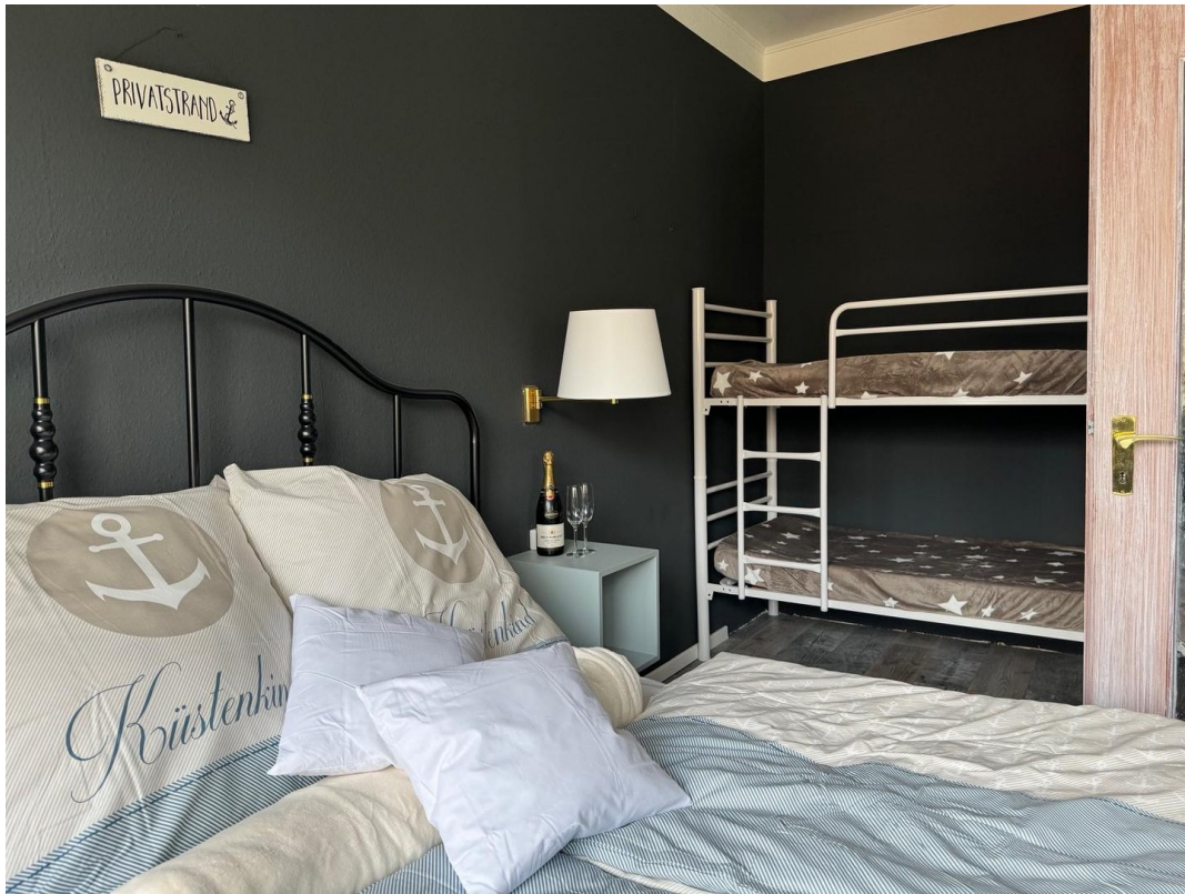
eins von 9 schönen Zimmern