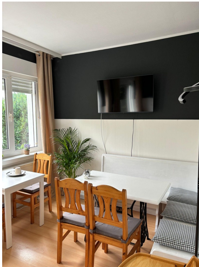
Frühstücksraum mit Smart-TV