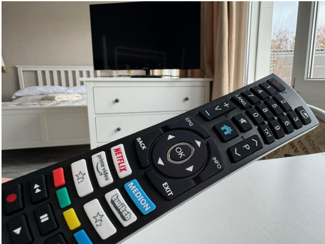
Smart-TV in jedem Zimmer