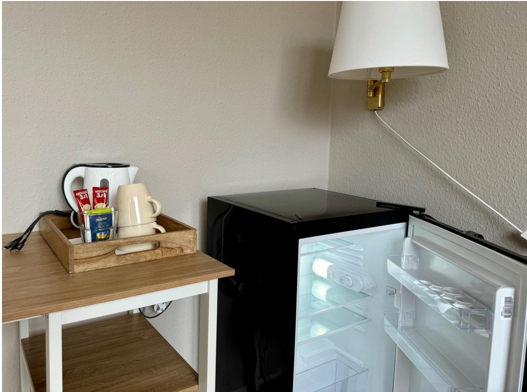
Kühlschrank in jedem Zimmer