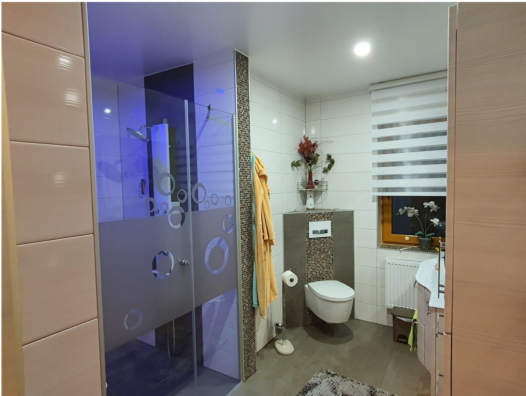
Badezimmer, Dusche 1,40x1,40