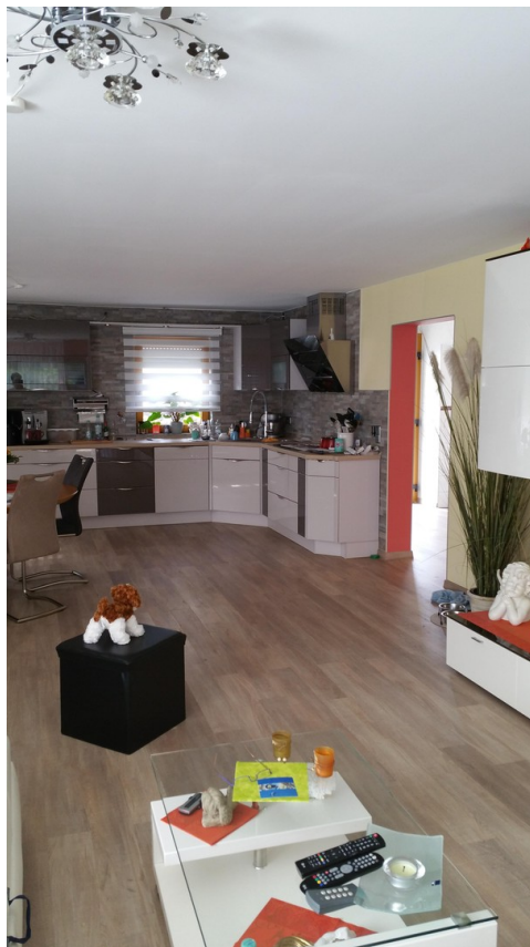
Küche mit offenem Wohnbereich