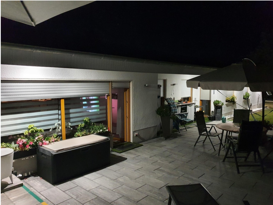
Terrasse am Abend