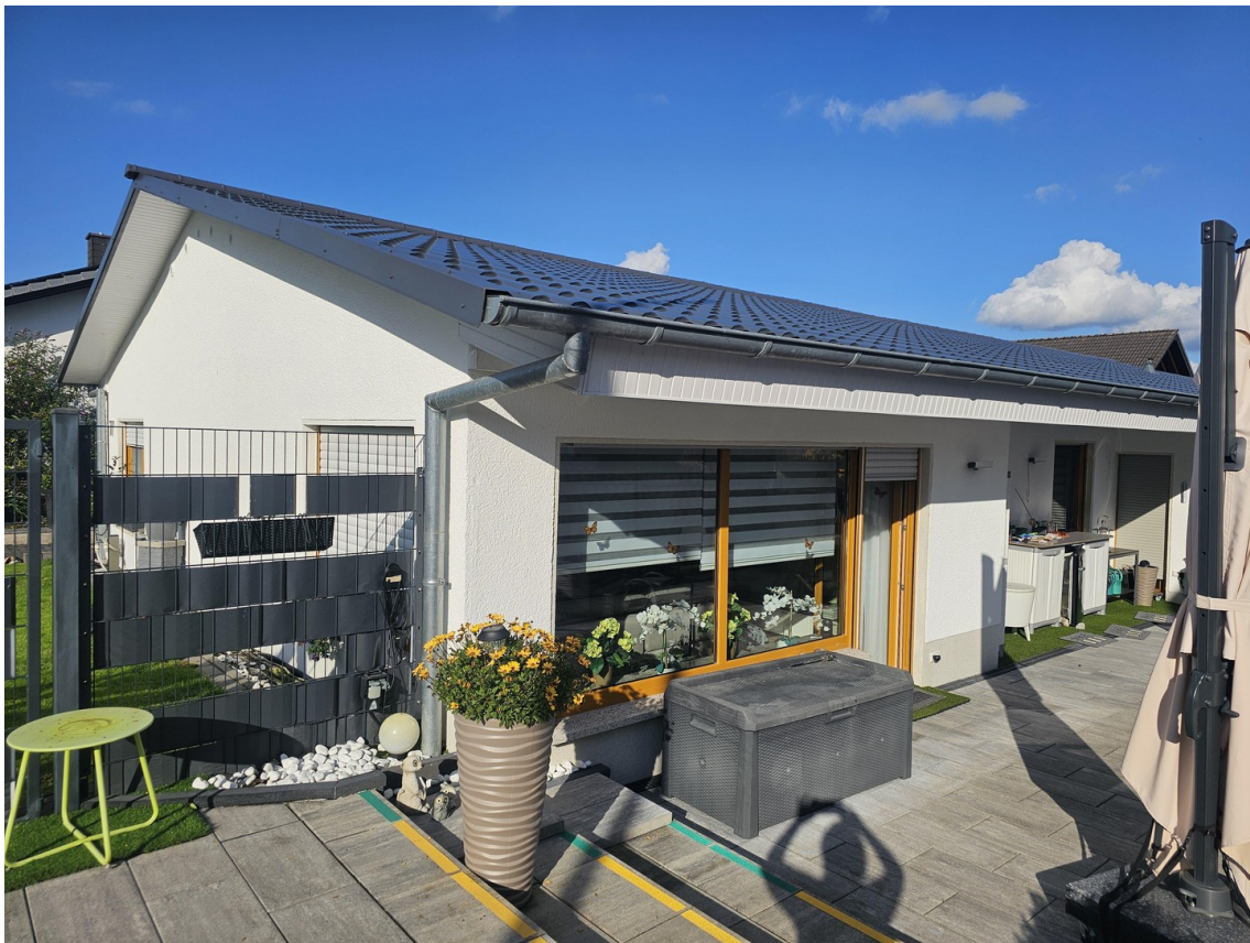
Terrassenseite Süd- Ost