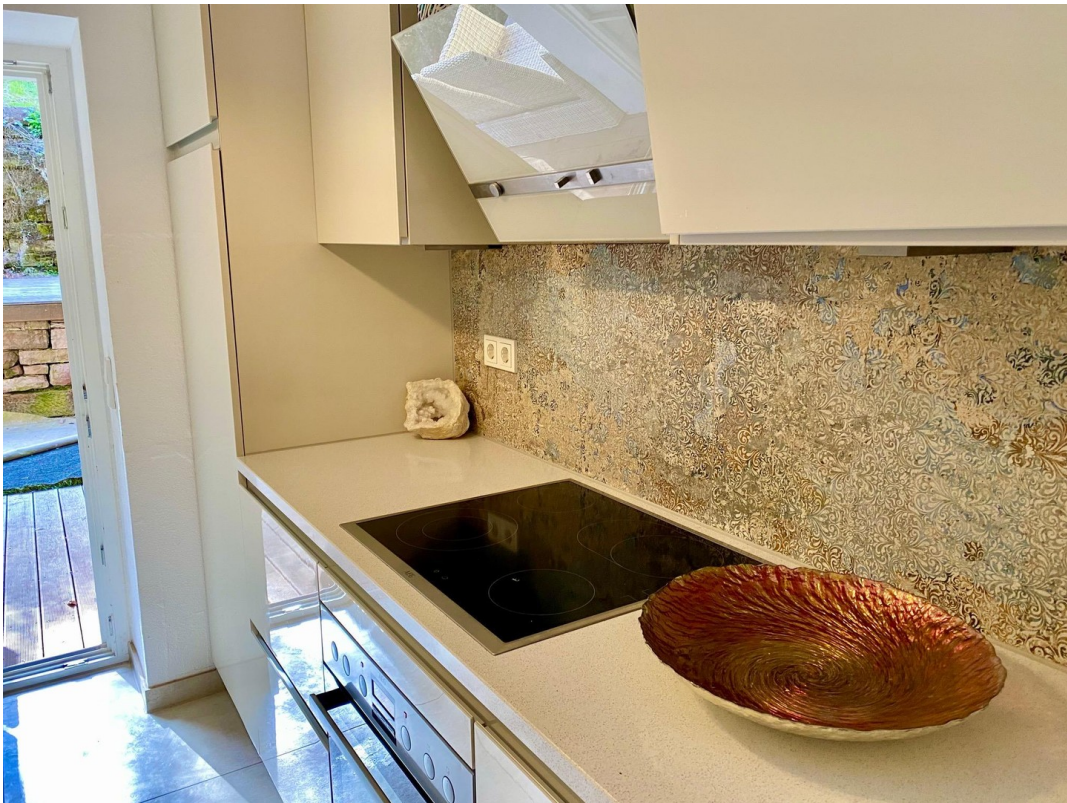
Küche Arbeitsbereich rechts