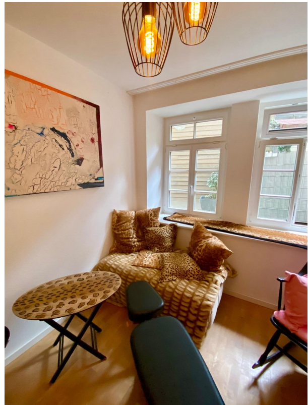
gemütliches 3. Zimmer