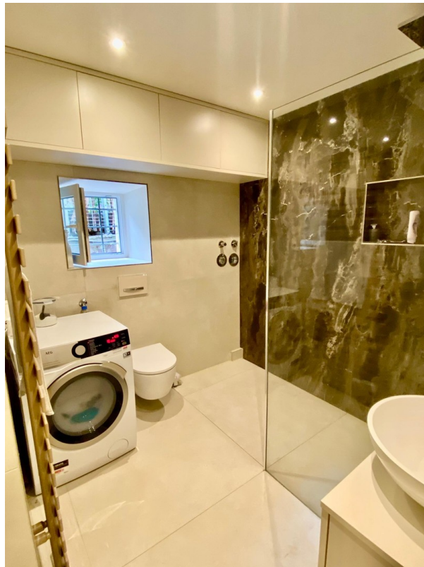
Luxusbad mit XXL Dusche