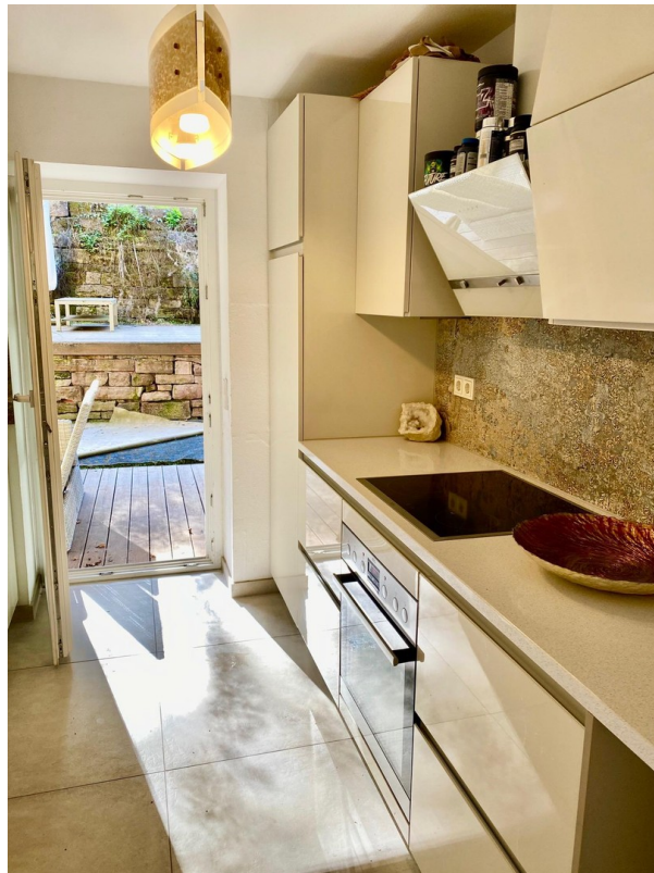
Küche Blick zur Terrasse 1