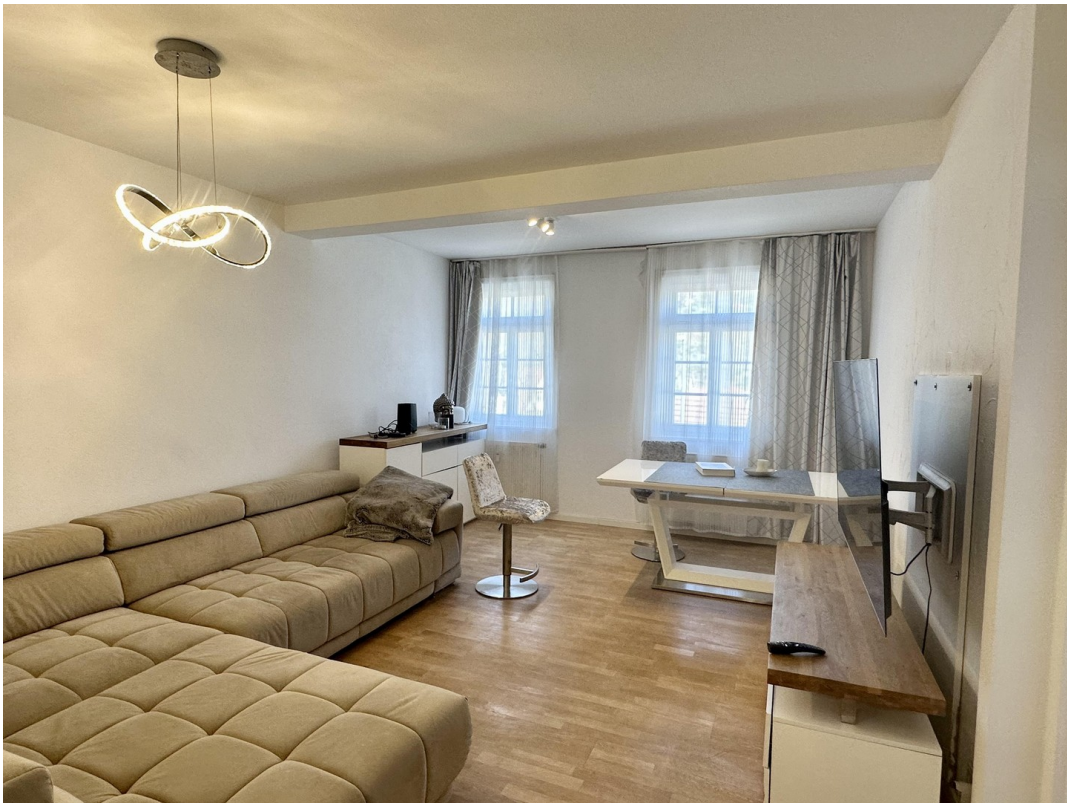
Wohnen mit Sofa