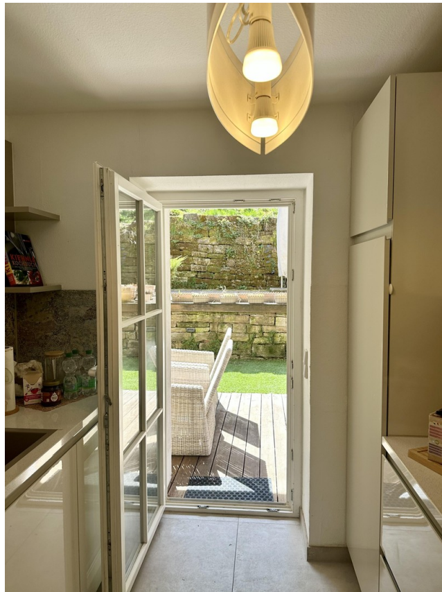
Blick von Küche zur Terrasse