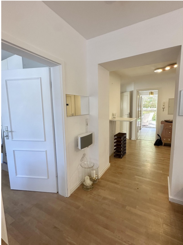
Blick von Wohnen zu Küche/Ter.