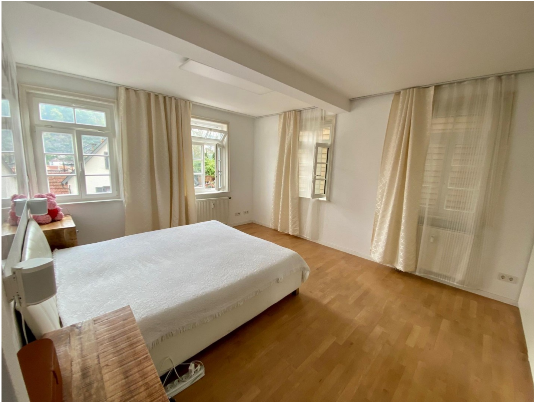
großer, sonniger Schlafraum