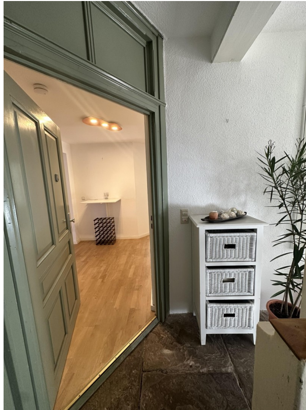
Stilvolles Entree mit Vorflur