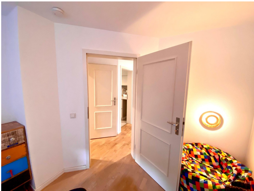
Lesecke Lounge/3. Zimmer