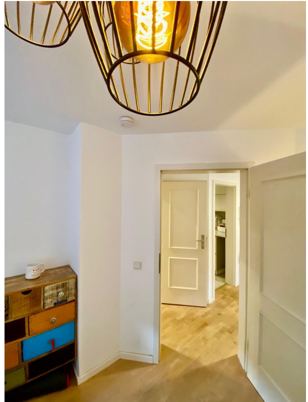
Blick von Lounge zu Flur