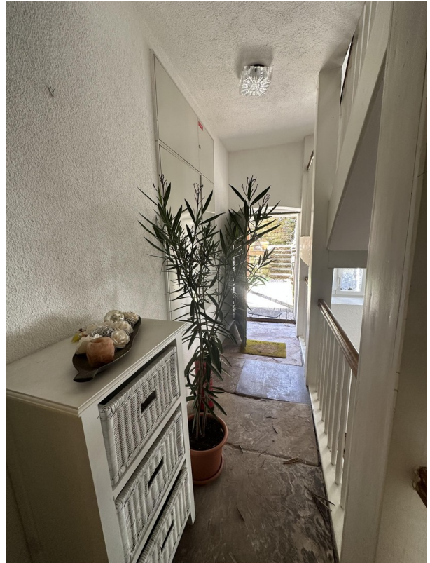
Vorflur mit eigenem Gartenausg