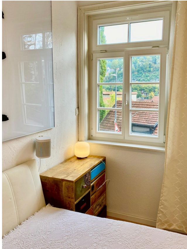
Blick Schlafen mit Morgensonne