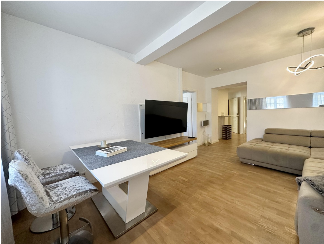
Wohnen mit Esstisch