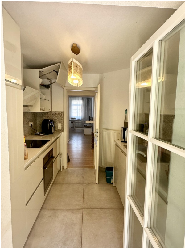
Blick in Küche von Terrasse