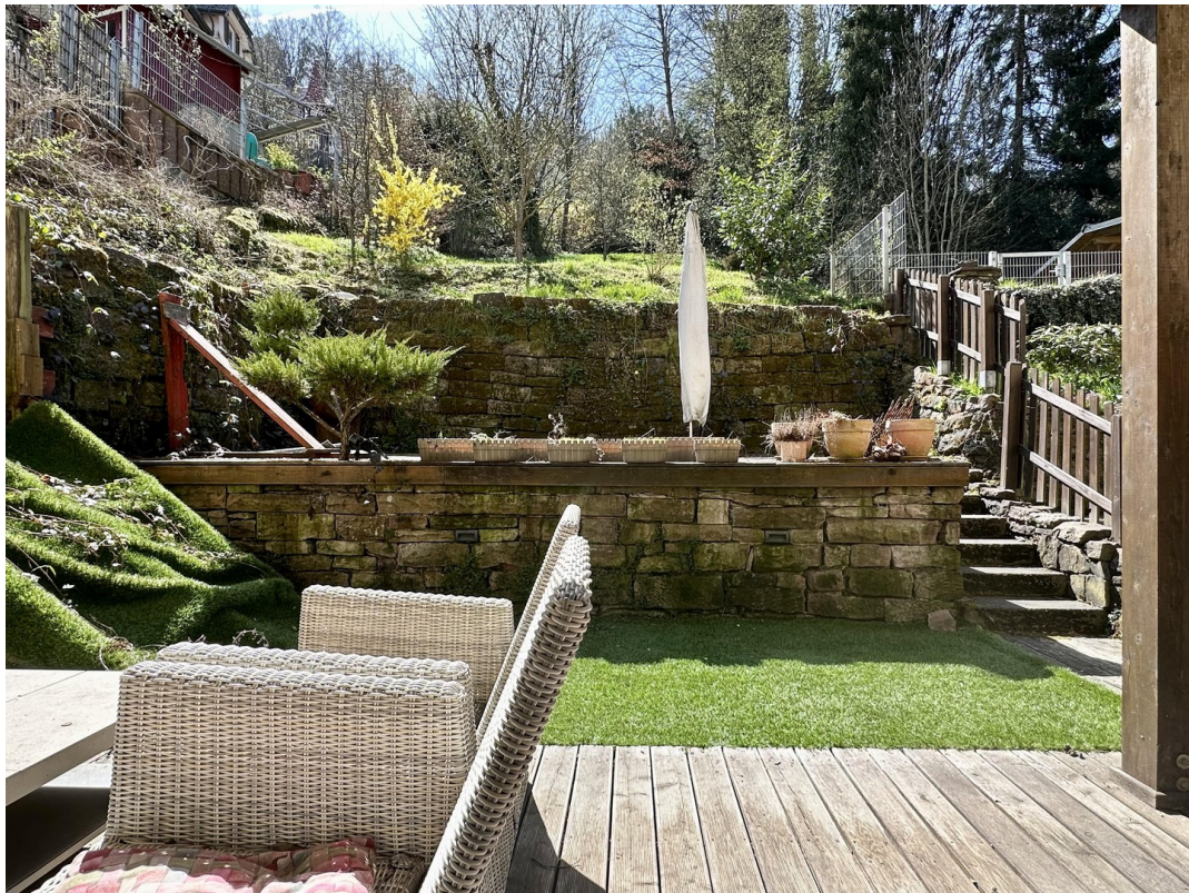
Aussenbereich mit 2 Terrassen